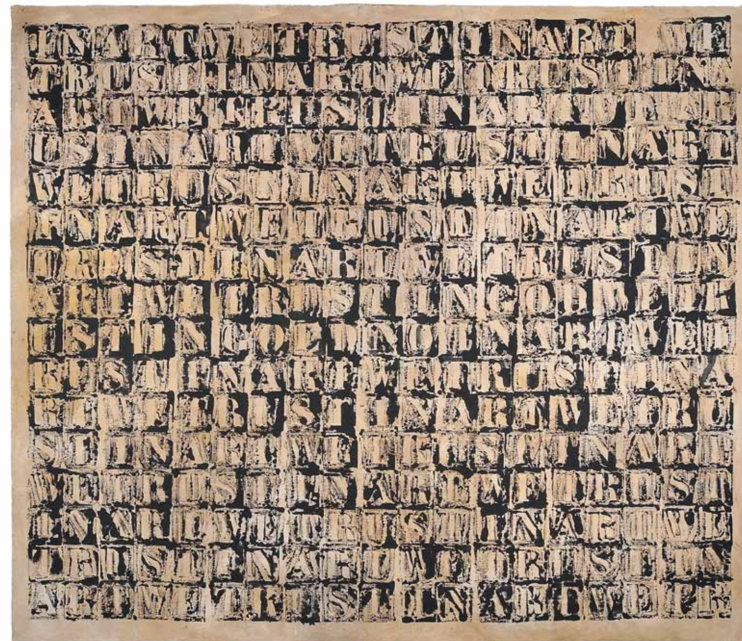
In Art We Trust n° 2 2011 Acrylique sur toile Acrylic on canvas 200 x 220 cm