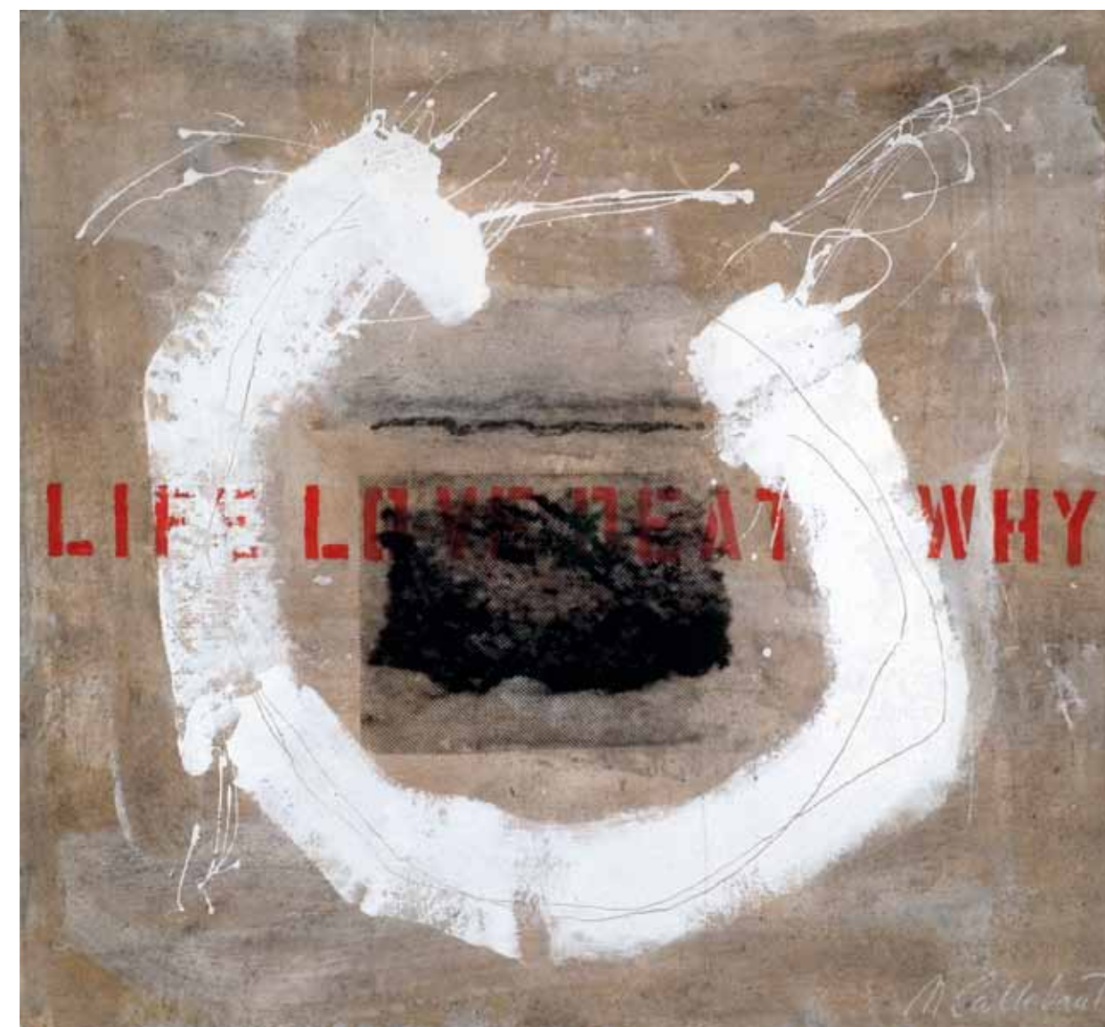
Sans titre 2006 Technique mixte sur toile Mixed media on canvas 108 x 116 cm