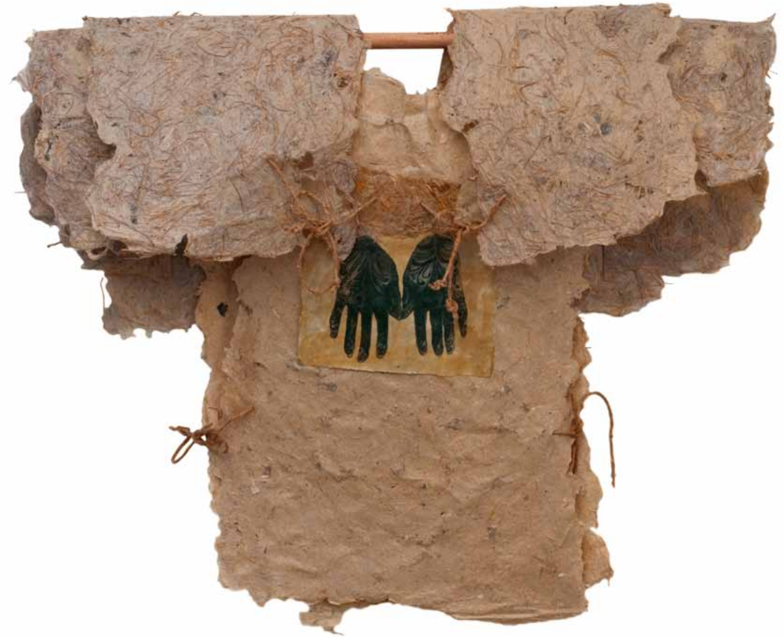
Esprit des lieux