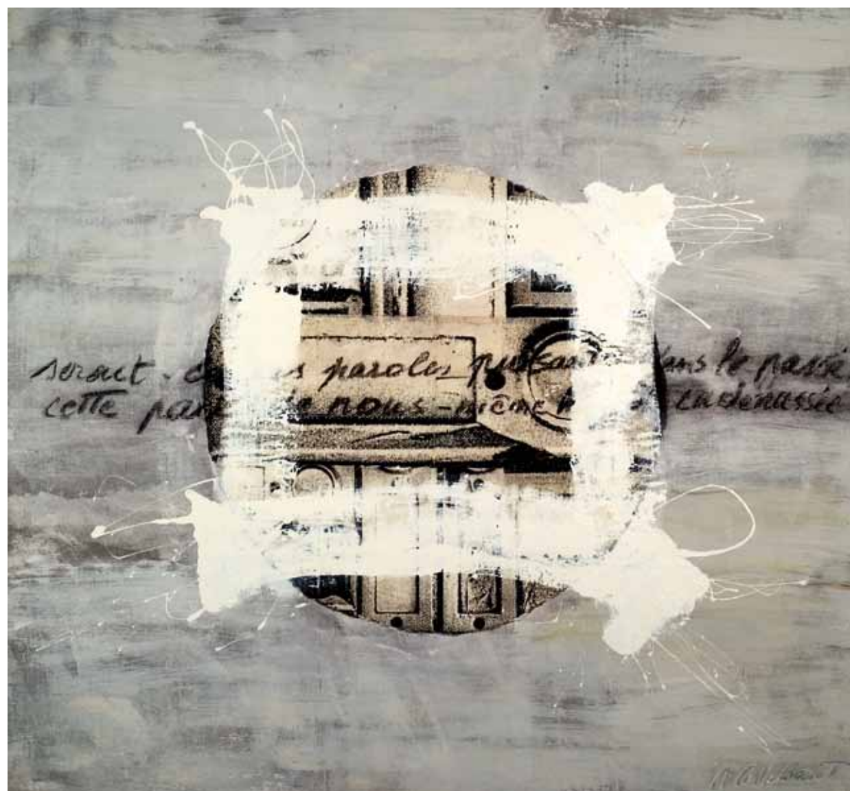
Sans titre 2006 Technique mixte sur toile Mixed media on canvas 150 x 140 cm