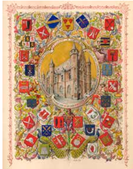
Achille Kas Bladzijde uit het Gulden Boek van Museum Vleeshuis, 1913. Het hele blad is versierd met de wapens van Antwerpse gilden en ambachten. In het midden bovenaan staat het wapen van het vleeshouwersambacht.