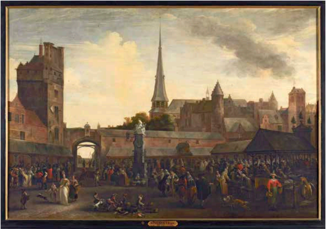
Hendrik van Minderhout De vismarkt , 1695.