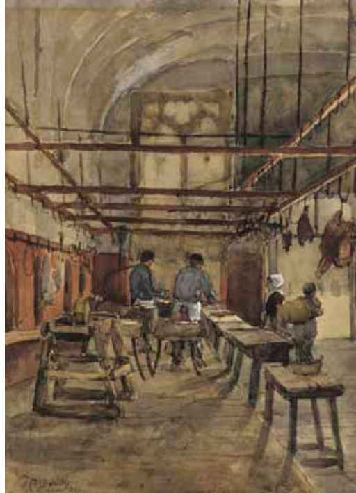
Willem Johannes Schütz Interieur van de Vleeshal in Middelburg, 1903.

De maatschappij van het ancien régime was een strikt geordende samenleving, geregeld op basis van stedelijke keuren of ordonnanties en hertogelijke privileges. Zowel de aanvoer van vee, de vleeshandel als de organisatie van het vleeshuis zelf was strikt aan regels gebonden. In de loop van de veertiende eeuw verzamelde het stadsbestuur die regels in het zogenaamde 'keurboek', een overzicht van alle reglementen en bepalingen die in Antwerpen van kracht waren. Veel van die regels werden dan wel op dat ogenblik genoteerd, maar waren vaak al decennia van kracht. Sommige gingen zelfs terug tot de dertiende eeuw.