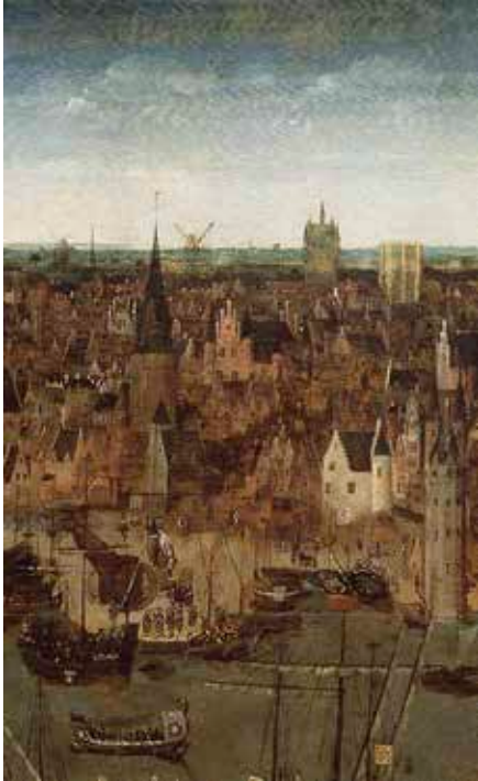
Anoniem Antverpia in Brabancia, 1515-1545.