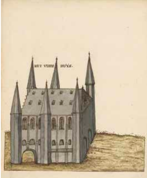
Anoniem Het Vleeshuis , zonder datum.

Voor het monumentale gebouw heeft het ambacht flink wat kosten moeten maken, meer dan wat het zich kon veroorloven. De verkoop van eigen goederen, huizen en gronden zorgde niet voor voldoende inkomsten, al waren de vastgoedprijzen in de buurt gestegen door de bouw van het Vleeshuis. De dekens van het vleeshouwersambacht moesten daarom al snel op zoek gaan naar bijkomende middelen. In mei 1501 kregen ze van de stad de toelating om gedurende zes jaar een bijkomende cijns (of belasting) te heffen op de jaarlijkse veemarkten.