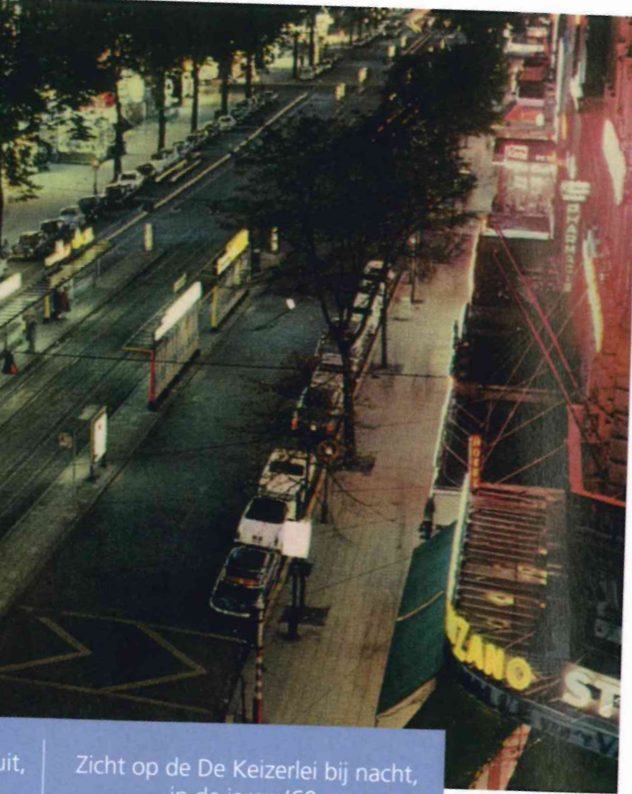
Zicht op de De Keizerlei bij nacht, in de jaren '60.

Het 'Tourist Hotel' (tegenwoordig het Century Hotel) met zijn bakstenen gevel aan de Pelikaanstraat in Antwerpen. Aan zijn voeten, een Plymouth Valiant van 1966, een Peugeot 504 en een Fiat 600.