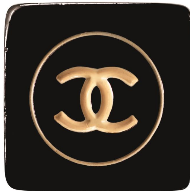
Rouge à lèvres Chanel de 1947-1950, vue de dessus, orné du monogramme en double C cerclé.