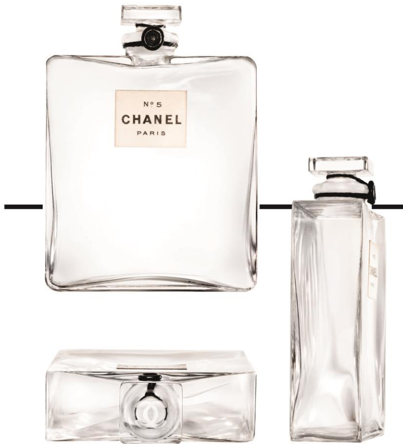
Le flacon et le bouchon du parfum N°5 de 1921 sous différents angles.