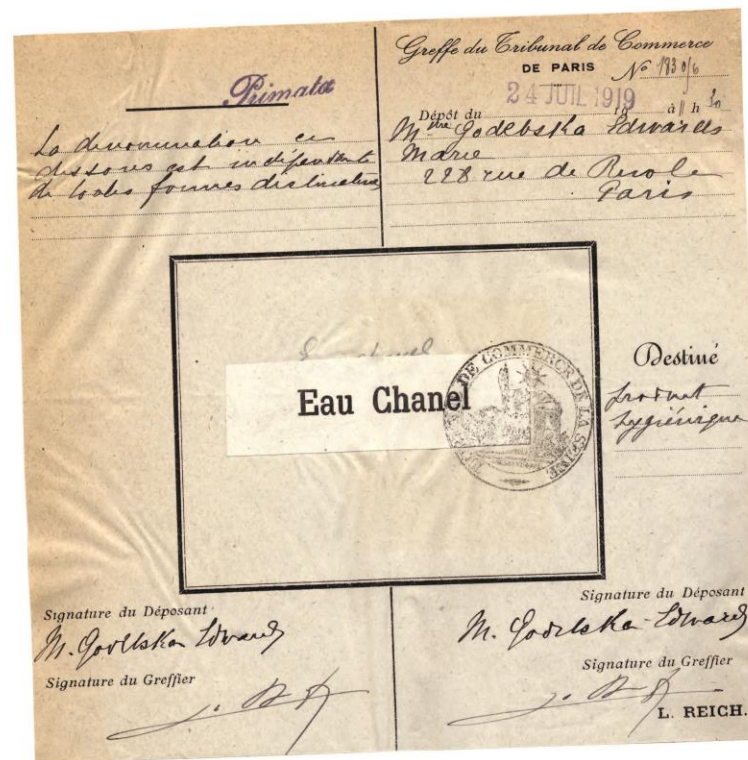
Dépôt de marque pour l'Eau Chanel daté du 24 juillet 1919, portant signature de Misia Godebska Edwards (future Misia Sert).

Pourtant, la couturière tergiverse. Elle ne partage pas l'enthousiasme de Misia, car elle nourrit des préventions anciennes contre les femmes trop parfumées, suspectes à ses yeux de chercher à cacher de mauvaises odeurs. Combien en avait-elle croisé, dans ses jeunes années, de ces cocottes qui s'aspergeaient