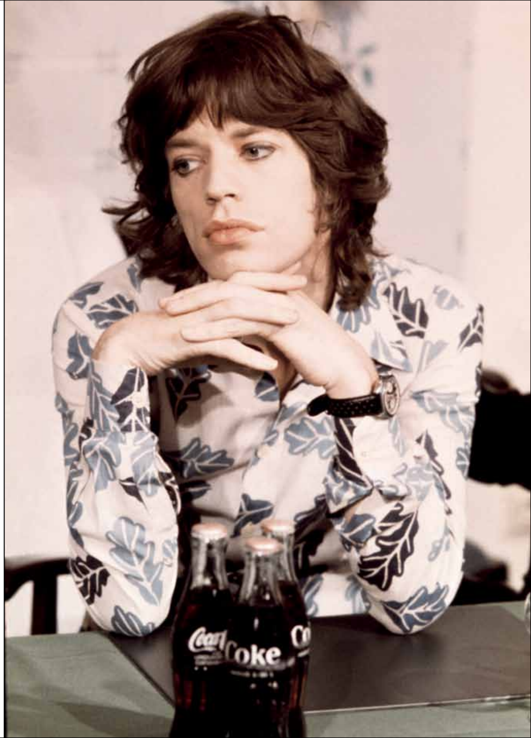
OPPOSITE: Mick Jagger , Amsterdam, 1973.