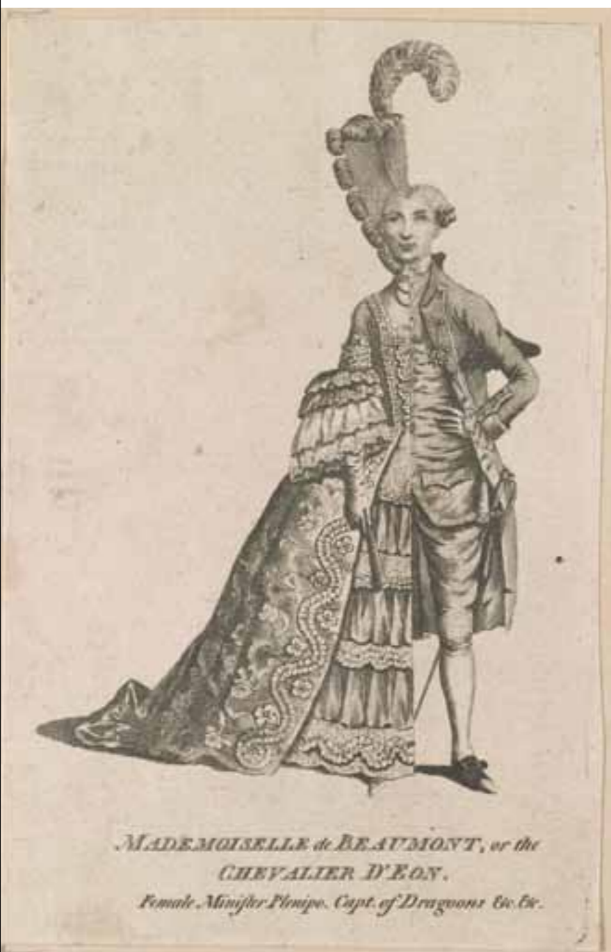
MADemoiselle de BEAUMONT, or the CHEVALIER D'EON. Female Minister Plenipo. Capt. of Dragoons &c. &c.

ABOVE: Charles Eon de Beaumont dressed half as a woman, half as a man. Engraving, 1777.