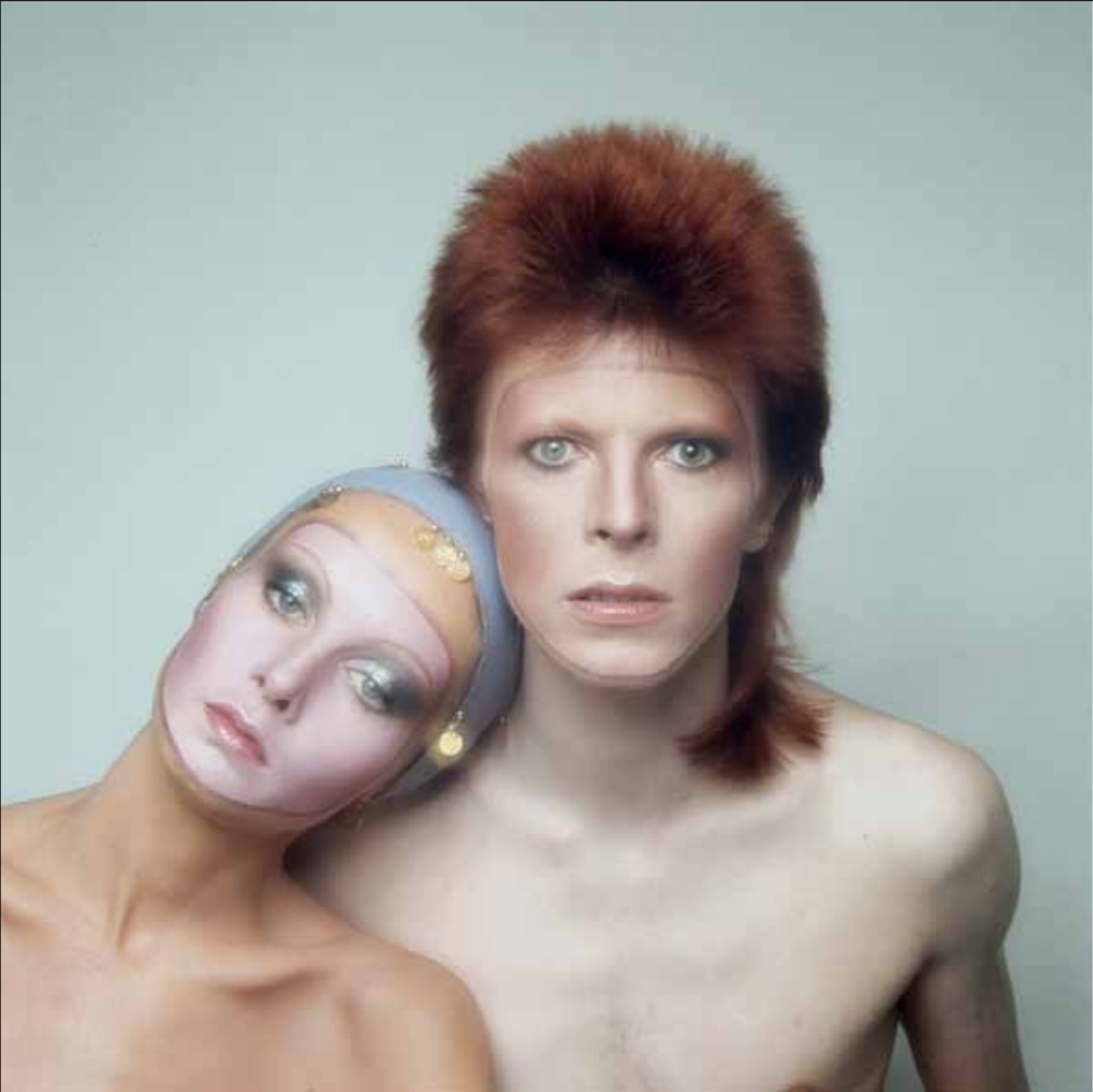
ABOVE: Twigg and David Bowie, Paris, 1973.