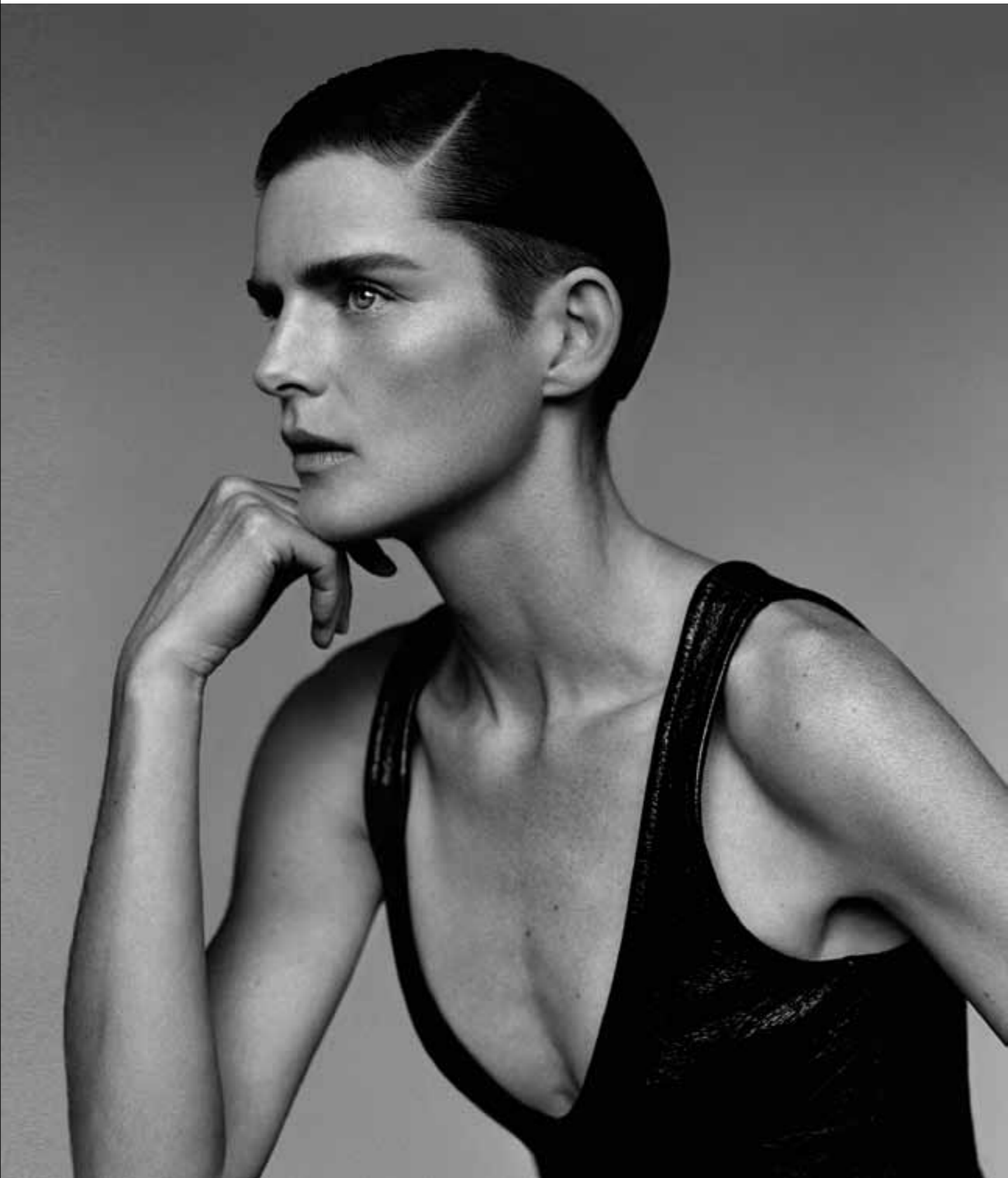
Stella Tennant wears Louis Vuitton, 032c, Winter 2014