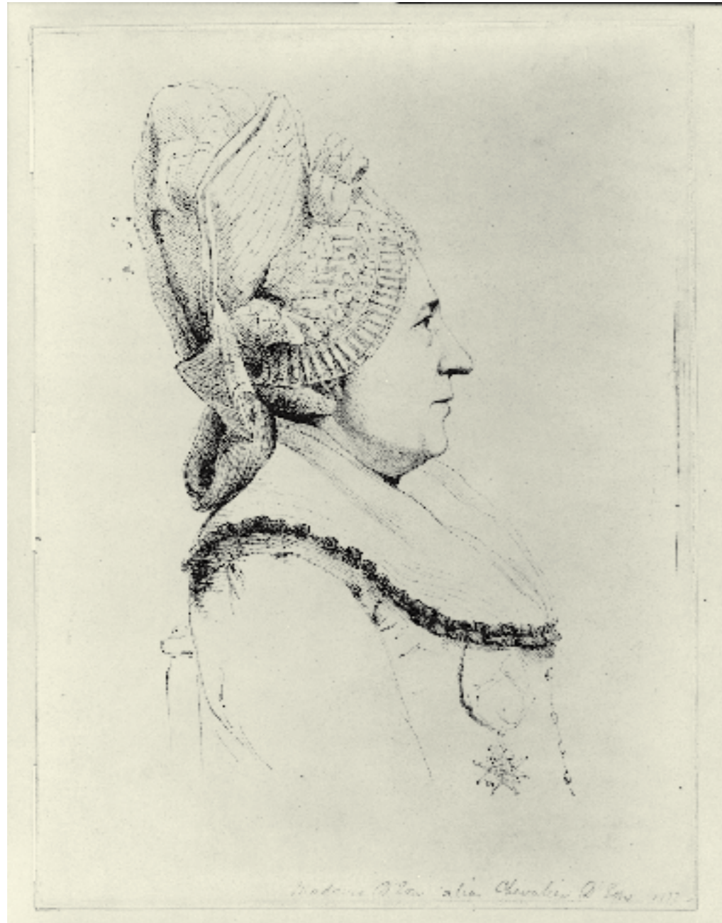
Charles Eon de Beaumont, soft-ground etching, 1791.