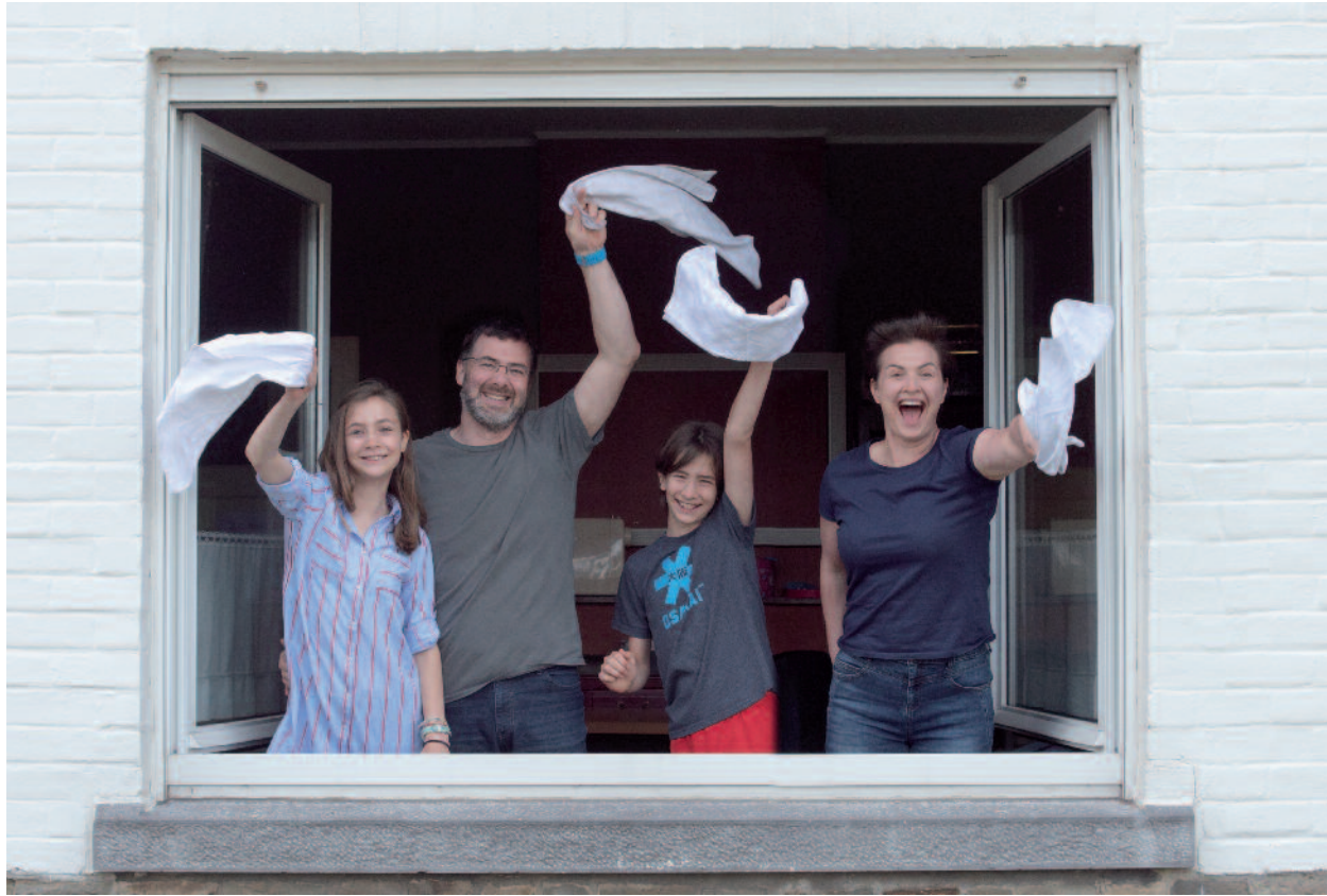
Famille ???????? : Xxxxxx, Yyyyyyy, Zzzzzz, Aaaaaaa (Namur)