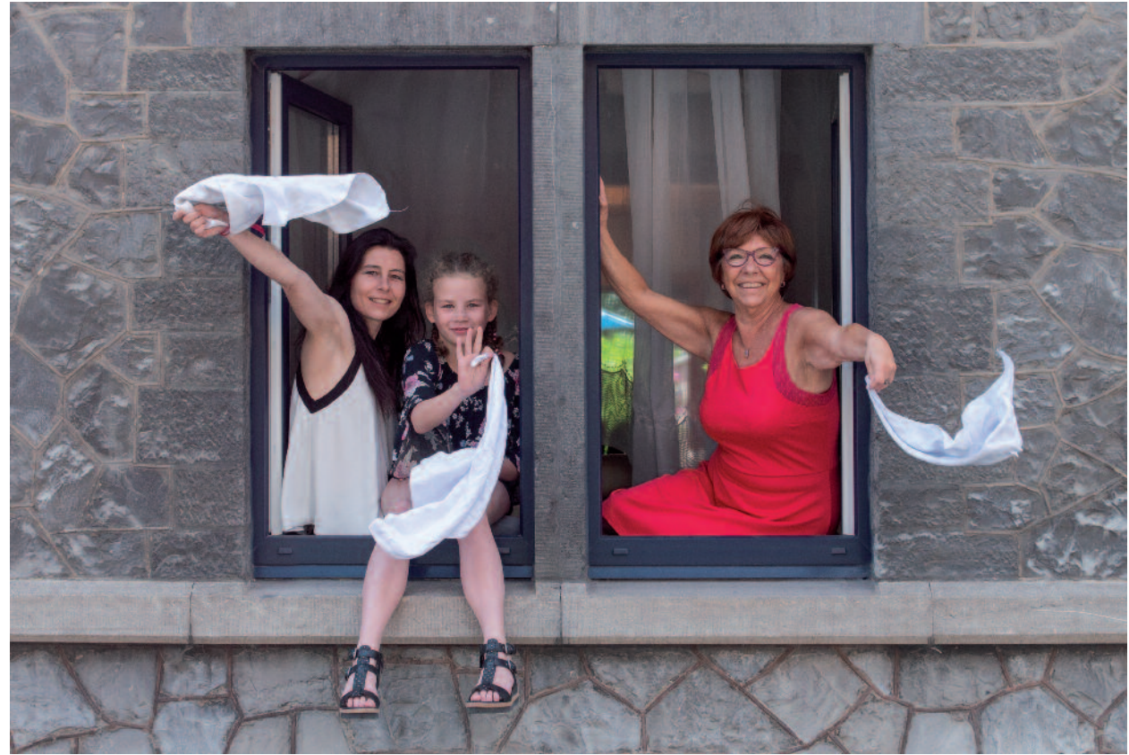
Famille ???????? : Xxxxxx, Yyyyyyy, Zzzzzz, Aaaaaaa (Namur)