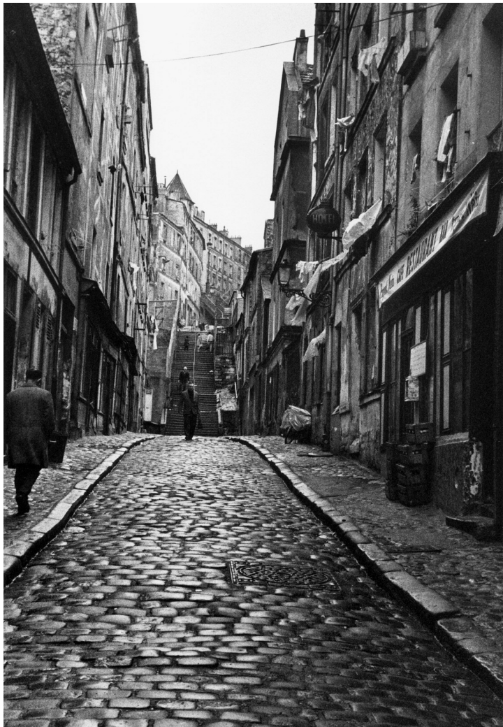
Peau de Belleville – Passage Julien Lacroix, 1969. Ivan Alechine.