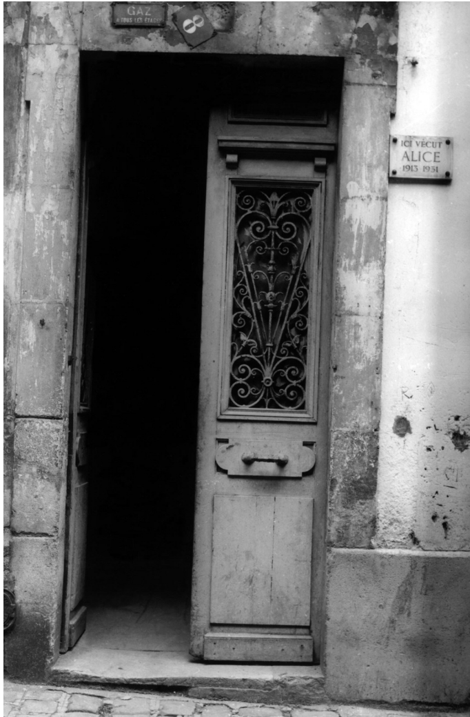
Ici vécut Alice – Rue Rampal, 1966. Pierre Alechinsky.