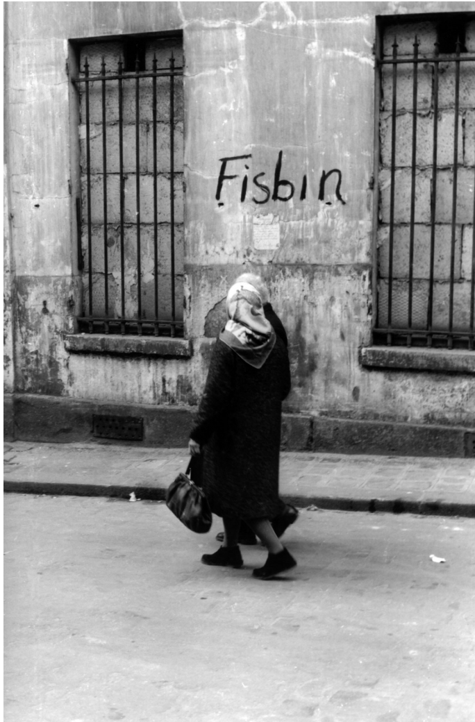
Fisbin – Rue Rebeval, 1966. Pierre Alechinsky.