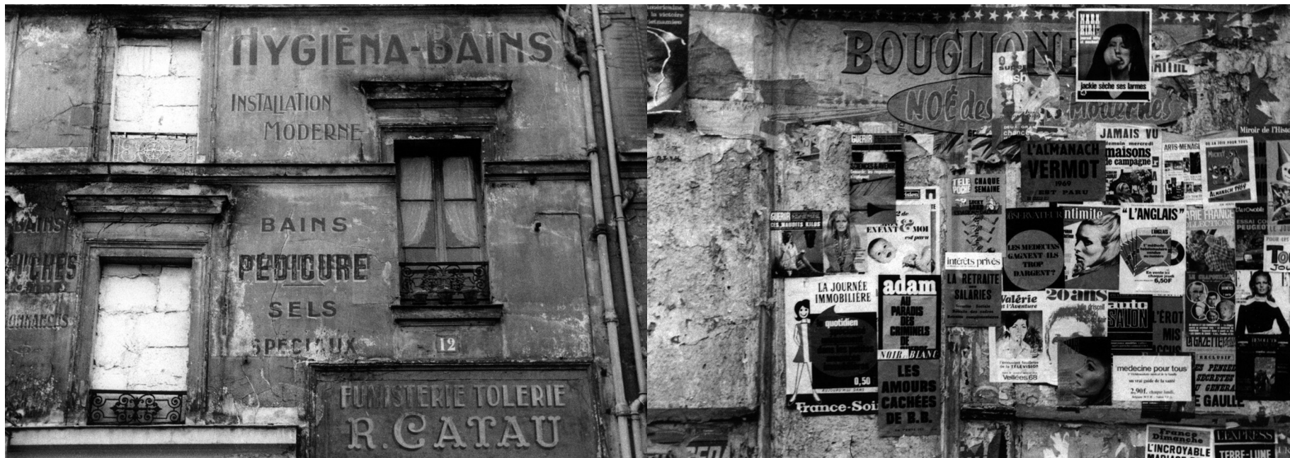
Dernière fenêtre – Bas de Belleville, 1968. Ivan Alechine.