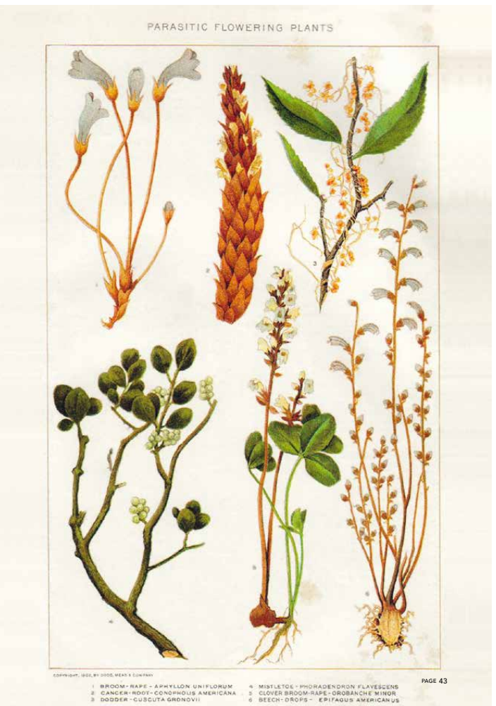
COPYRIGHT, 1921, BY 1920, WEAVER & COMPANY