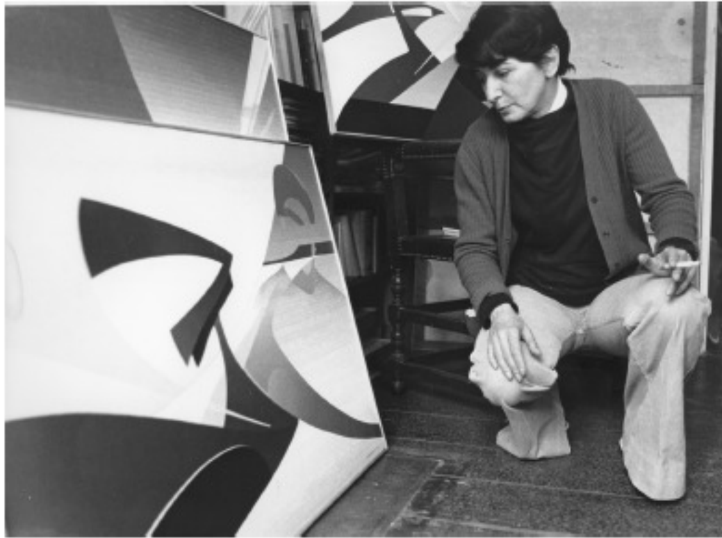
LA FORGE DES AUBES , 1975, huile sur toile, 68 x 106 cm. L'hommage à Marcel.