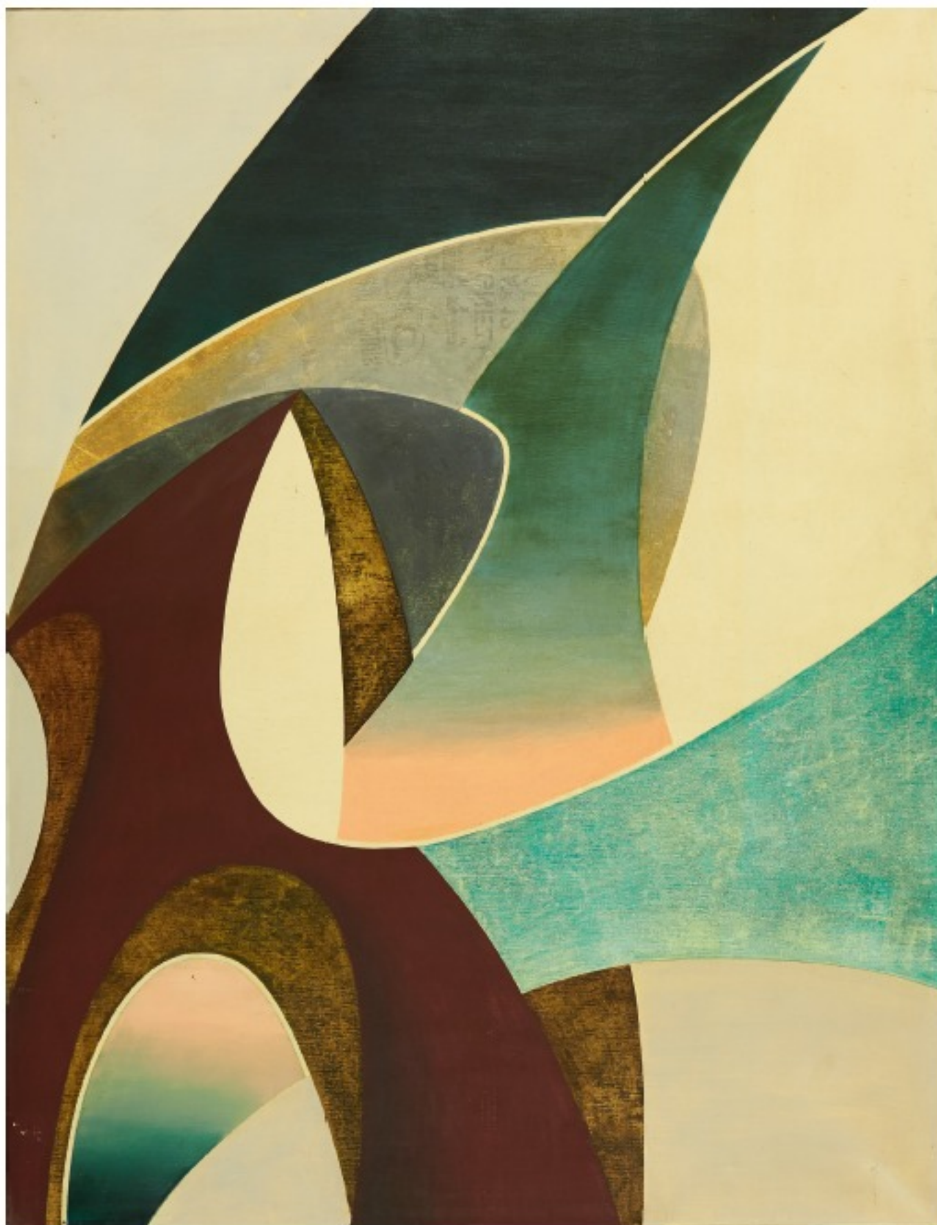
MOUVEMENTS 18, années 1960, huile sur toile, 130 x 100 cm.