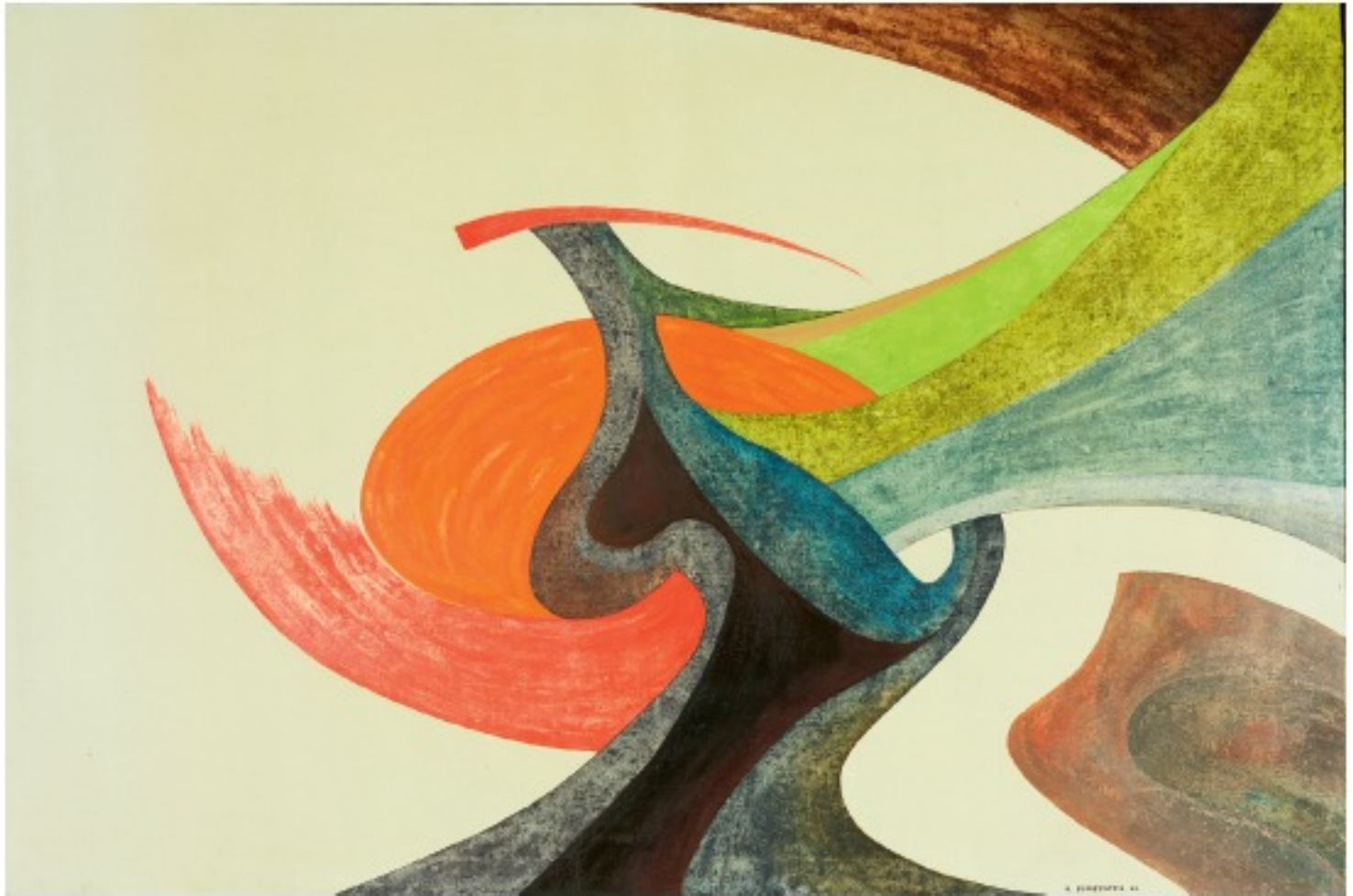
MOUVEMENTS 3, 1966, huile sur toile, 100 x 150 cm. Collection Maurice Verbaet.