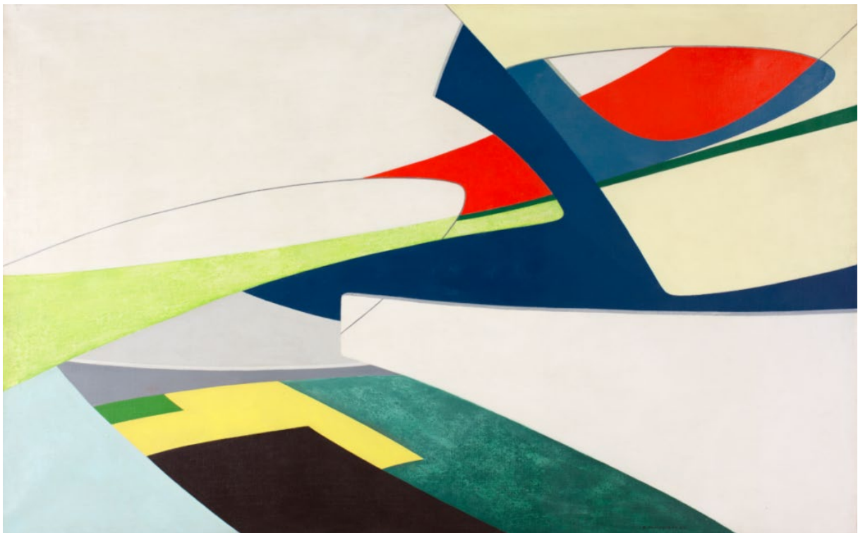
Renée Demeester, Valsent des éléments n°2, olieverf op doek, 150 x 90 cm, 1972.

Het René Magritte Museum – Museum voor Abstracte Kunst wijdt een solotentoonstelling aan Renée Demeester, die in april 2022 van ons is heengegaan. De expo “Abstracte landschappen” biedt de ideale gelegenheid om deze getalenteerde en discrete kunstenares beter te leren kennen. Binnen de Belgische abstracte kunst van de jaren 1960–1980 was ze immers een opmerkelijke figuur: een harde werkster met een eigen stijl en met een vormtaal die constant verder evolueerde.