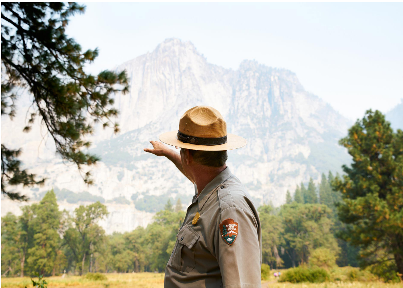
Lorem ipsum dolor sit amet, consectetur adipiscing elit. Aenean commodo ligula eget dolor.