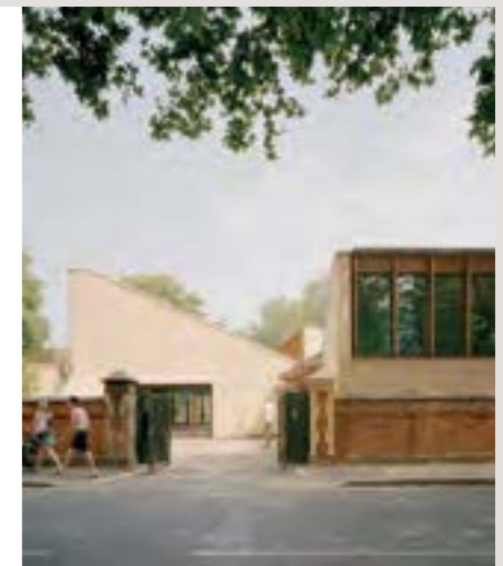
143 Sands End Community Centre