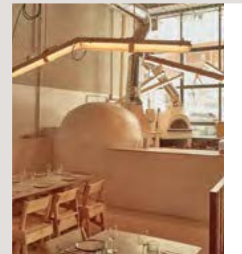
136 MO de Movimiento Restaurant