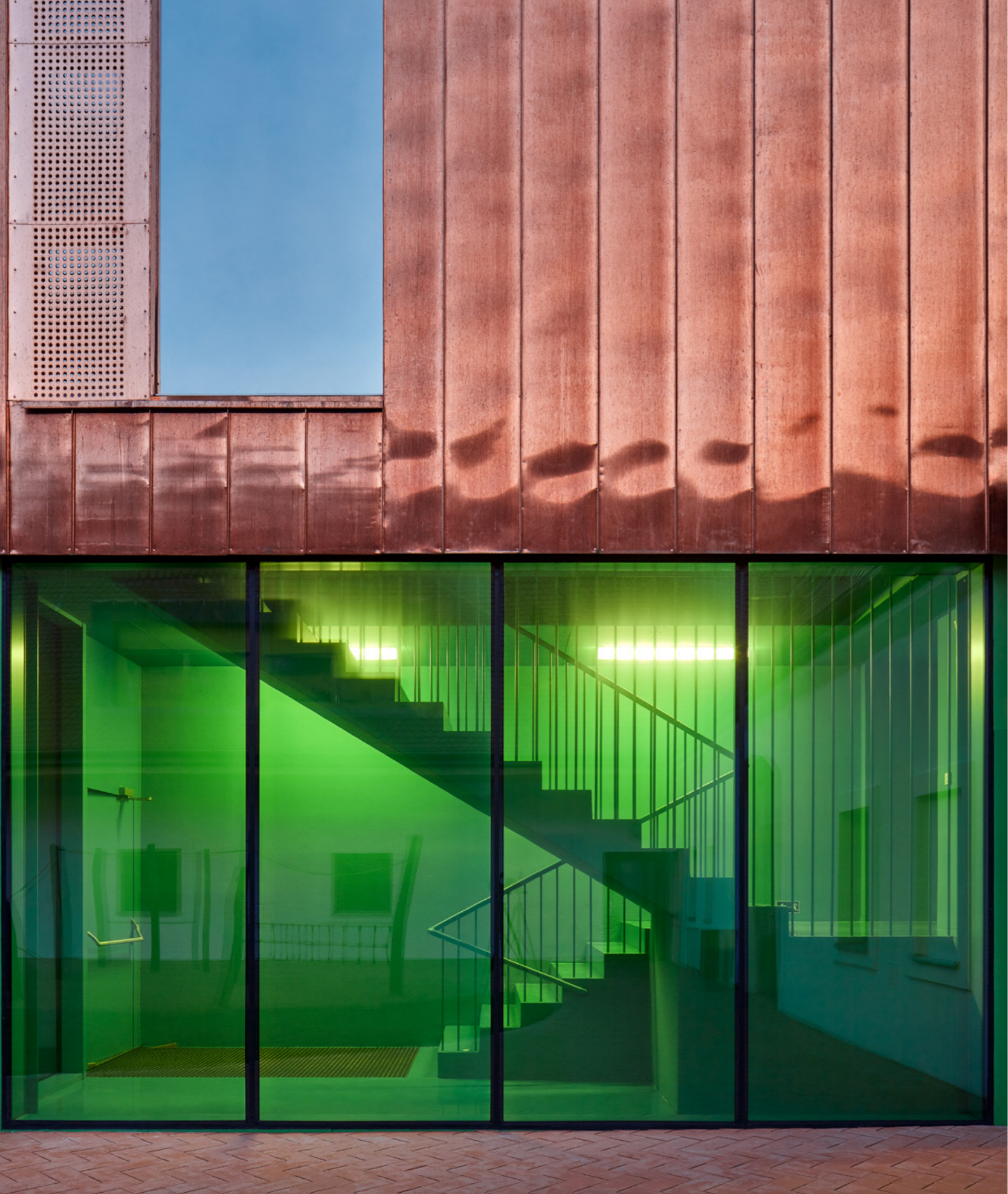
This collage of materials and construction approaches is no surprise given the rich and varied history of the 950m2 site. The original brief was three-fold: to accommodate the school's growing needs for classroom spaces.