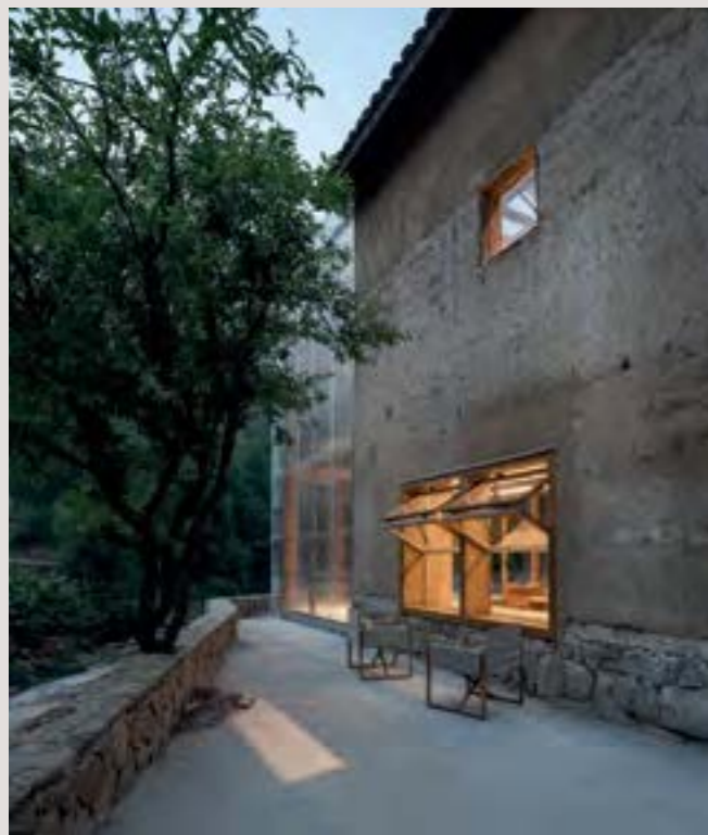
Raresequi omnisantur, occum es dolupta aut voluptaturl silivere labo. Aperepres quos aut event ex et laboreh enielicume es autatur itaturion eatia aut aut labora silmuscipsum met renis audae non consequ aedifect, silmagis repel et renidit utempis sil mison non collatio. Rovit vel iplitor all voloreh endesed uparlos idel mo ditatia dipas atur