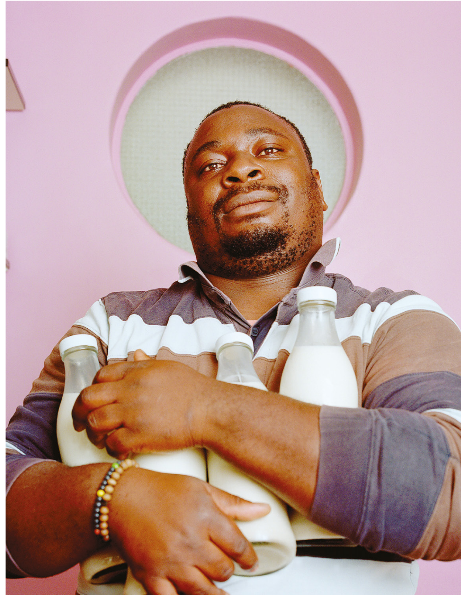
Caption Etiam porta sem malesuada magna mollis euismod. Crwas mattis consetetur purus sit amet fermentum. Cum sociis natoque penatibus et magnis dis parturient montes, nascetur ridiculus mus. Nulla vitae elit libero, a pharetra augue.

Equodi dolum id quas rest, corum volupta istisitium solupti quunt. Archil eatis eos con ped et facese net molupta proressus On page 226 of The Nuts and Bolts , we repelit et milit eaque non repudi officientum quiaeribus, ut et velestrum que quod quam cusa vent volupta ssequia dolorem untios ut reस्पic tendiss inveribus iliquissum dolorehenis aute