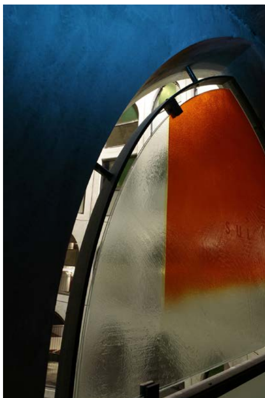
Udo Zembok – Parking Cathédrale