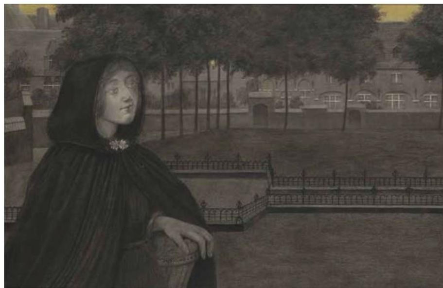
Le Béguihoge de Mont-Saint-Amand, s.d., graphite et aquarelle, 48 x 72 cm, courtesy Thomas Deprez Fine Arts.