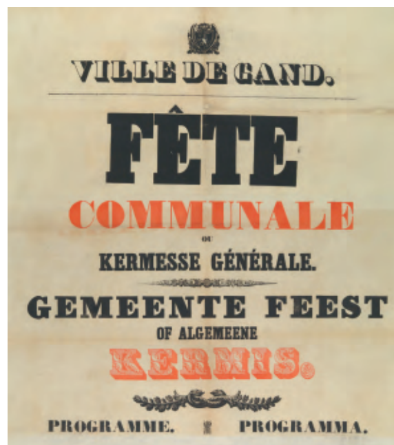
← Affiche van de eerste Gentse Feesten, het 'Gemeente Feest of Algemeene Kermis' van 1843.