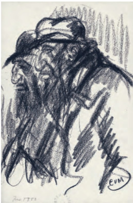
↖ EMIGRANT Eugeen Van Mieghem zwart krijt, 15.1 x 9.4 cm, ca. 1903 privéverzameling