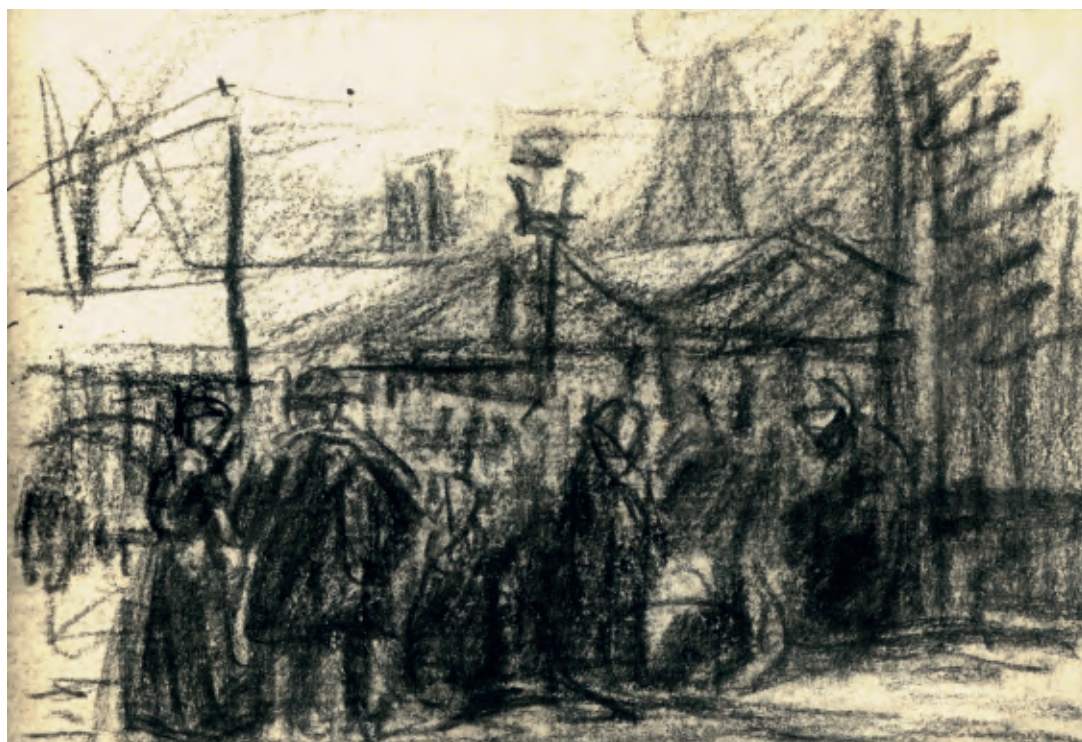
→ EMIGRANTEN AAN HET RED STAR LINE- MAGAZIJN Eugeen Van Mieghem zwart krijt, 8,9 x 12,7 cm, gedat. 8 dec. 1903 privéverzameling