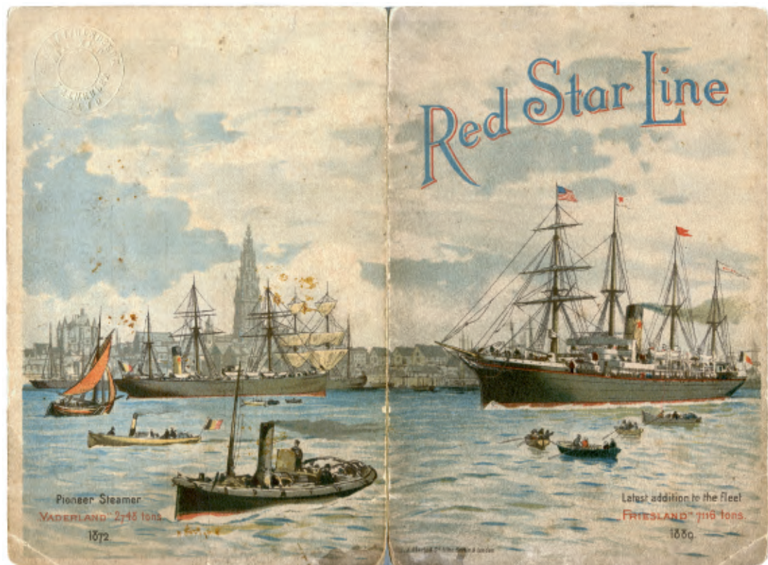
← RED STAR LINE passagierslijst SS Waesland, 1885

onderneming ter wereld en stelde zij 250 000 mensen te werk. Met ongekende financiële middelen had de onderneming behoefte aan diversificatie in haar activiteiten, waarbij de scheepvaart een logische keuze betekende. In 1871 werd met haar steun en op initiatief van Griscom American Steamship Company, beter bekend als American Line, opgericht. De scheepvaartlijn verzorgde een verbinding tussen Philadelphia en Liverpool, de toegangspoort tot de Engelse industrie. De schepen werden gebouwd op werven in Philadelphia, voeren onder Amerikaanse vlag met een Amerikaanse bemanning. Een groep financiers richtte datzelfde jaar ook International Navigation Co. in Philadelphia op, met Clement Griscom als ondervoorzitter. Op 4 mei 1871 werd het bedrijf met de machtige Pennsylvania Railroad Company als financieel controlerende partij door de staat Pennsylvania als naamloze vennootschap erkend.