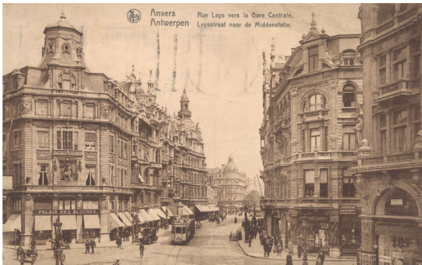
← HOEKHUIS LEYSSTRAAT EN JESUSSTRAAT Eugeen Van Mieghem pastel, 52 x 46 cm, ca. 1912 privéverzameling