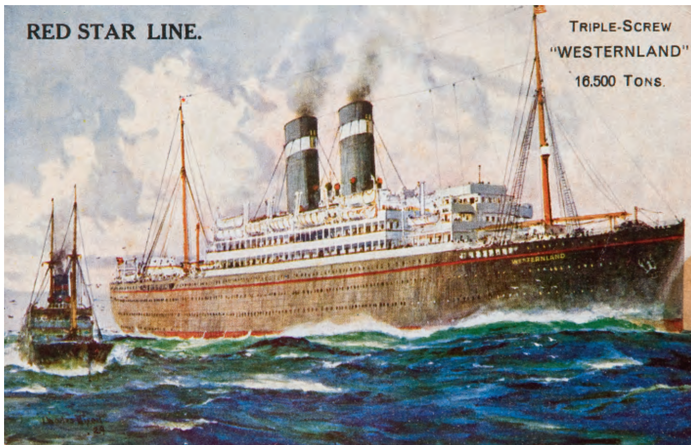
↑ RED STAR LINE prentkaart SS Western- land, ca. 1930