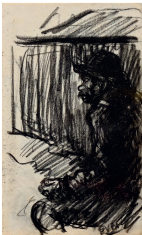
→ RUSTENDE JOODSE EMIGRANT Eugeen Van Mieghem zwart krijt, 15,1 x 9,4 cm, ca. 1903 privéverzameling