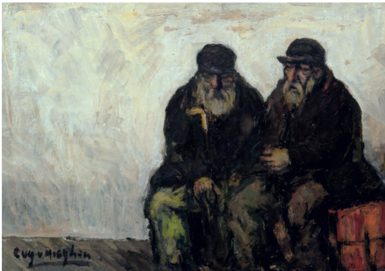
← RUSTIG HOEKJE (RED STAR LINE-SCHIP OP DE SCHELDE) Eugeen Van Mieghem olieverf op paneel, 33,5 x 24 cm, 1902 expositie groep Eenigen, Antwerpen, mei 1902, nr. 118 privéverzameling