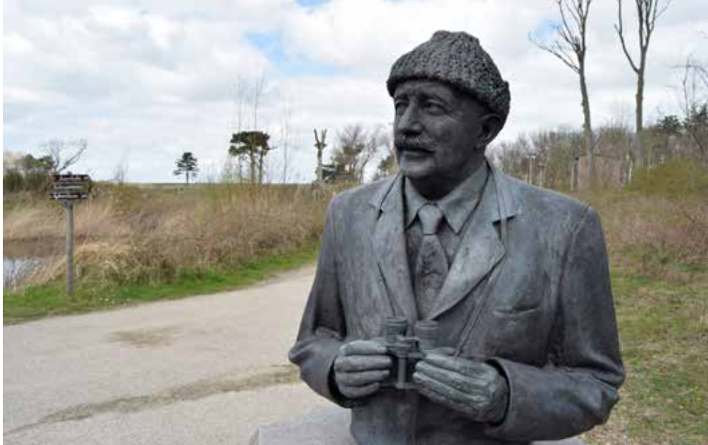
Buste van graaf Léon Lippens, de stichter van het Zwinreservaat en het Zwinpark, in karakteristieke outfit en pose, met de verrekijker in de aanslag.