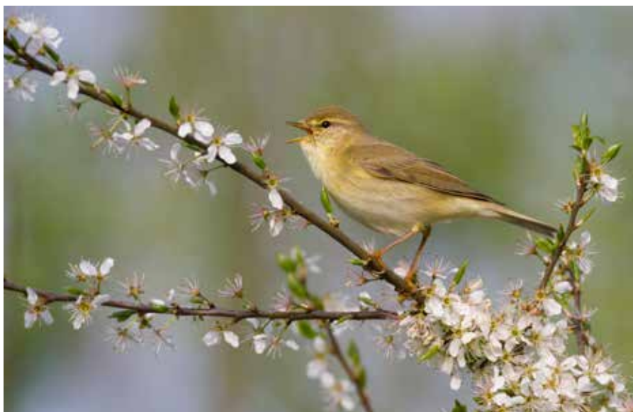
In het voorjaar weerklinkt de typische, aflopende zang van de fitis her en der in de struweelrijke delen van het Zwin.