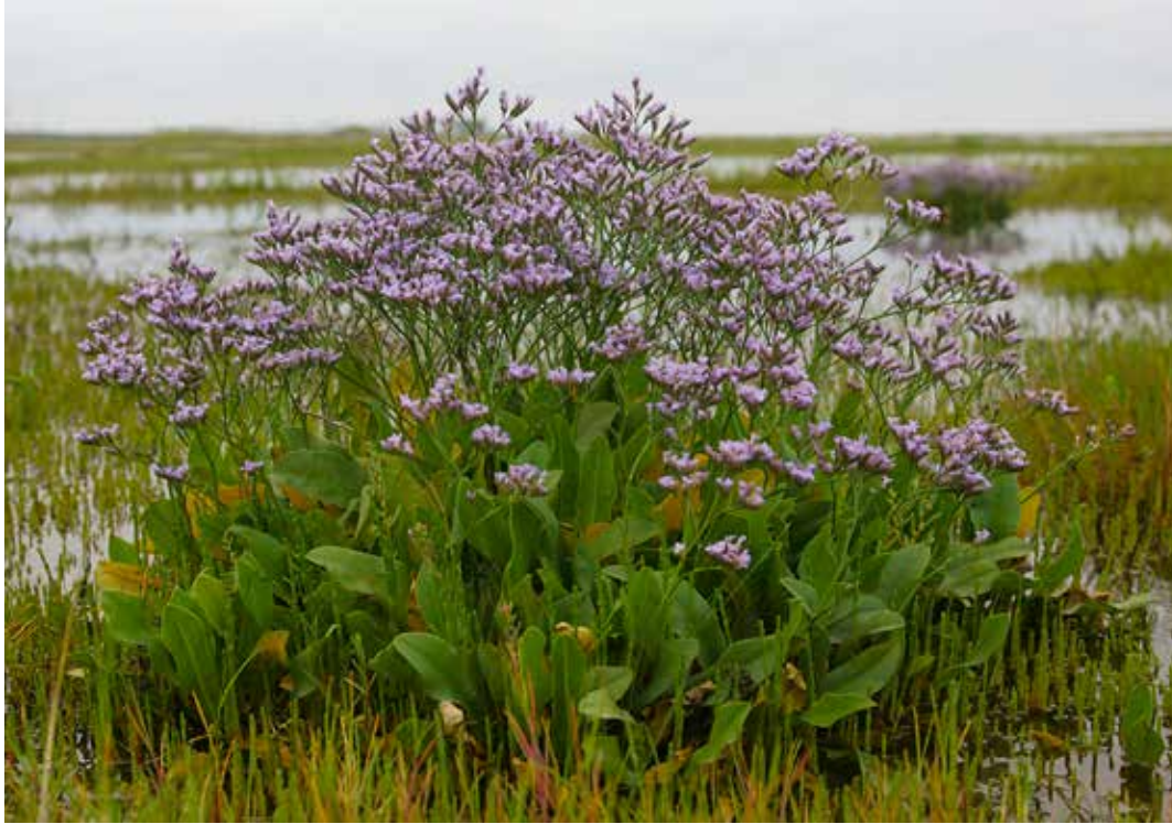
Lamsoor, een karakteristieke zoutverdragende plant, in volle bloei in de zomerse Zwinschorre.