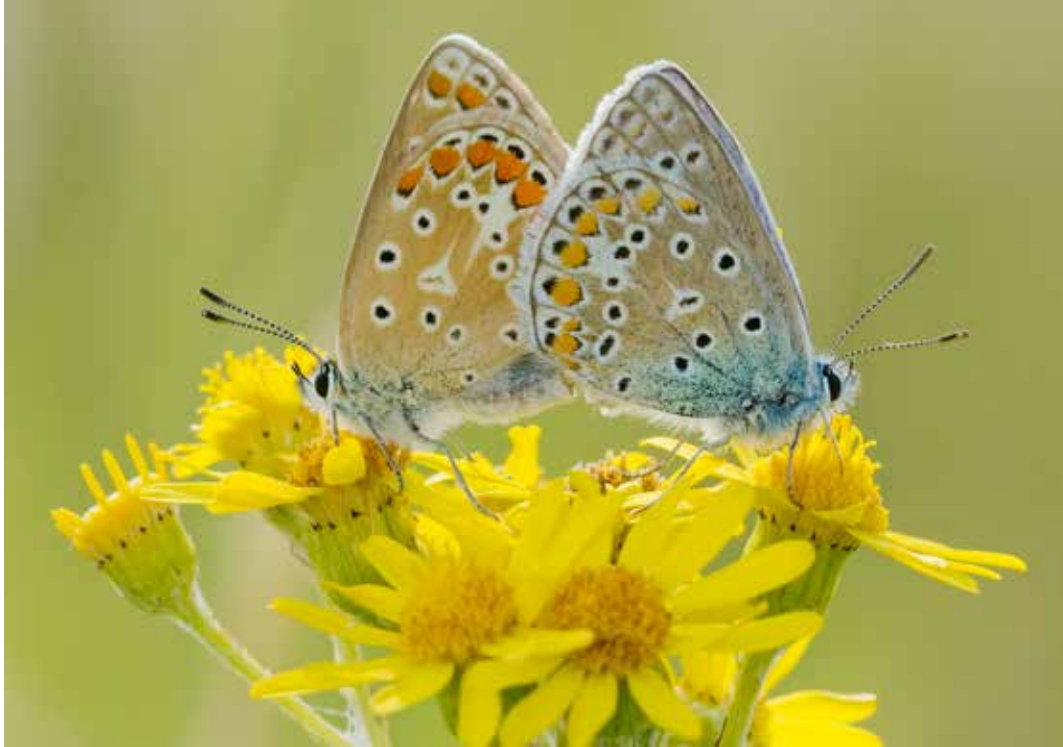
Twee parende Icarusblautjes. In de graslanden van het Zwin is dit een algemene vlindersoort.