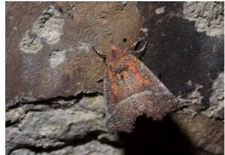
Het roesje is een algemene nachtvlindersoort die overwintert als volgroeide vlinder.

Een vlindergroep die het nog vrij goed doet in het Zwin, zijn de witjes. Groot koolwitje, klein koolwitje en klein geaderd witje zijn