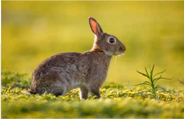
Een konijn in duinbiotoop. Vroeger zorgden grote aantallen konijnen voor de openheid van de duinen. De sterke afname van de soort is een belangrijke oorzaak van het oprukken van struweel in de duinen tijdens de voorbije decennia.