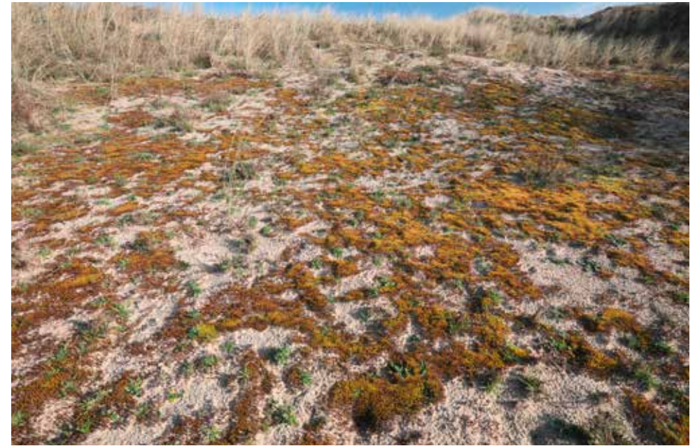
Mossen zijn in bepaalde delen van de duinen het overheersende vegetatietype.