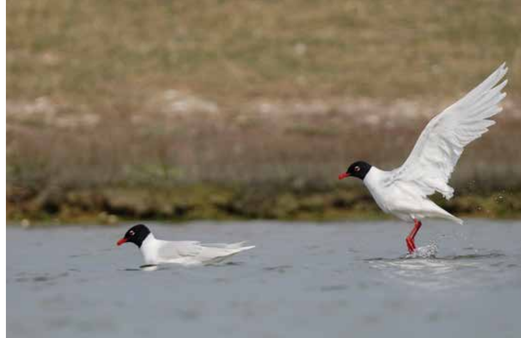
Tijdens de trekperiode passeren grote aantallen zwartkopmeeuwen langs het Zwin. In sommige jaren blijft een deel hier ook broeden.