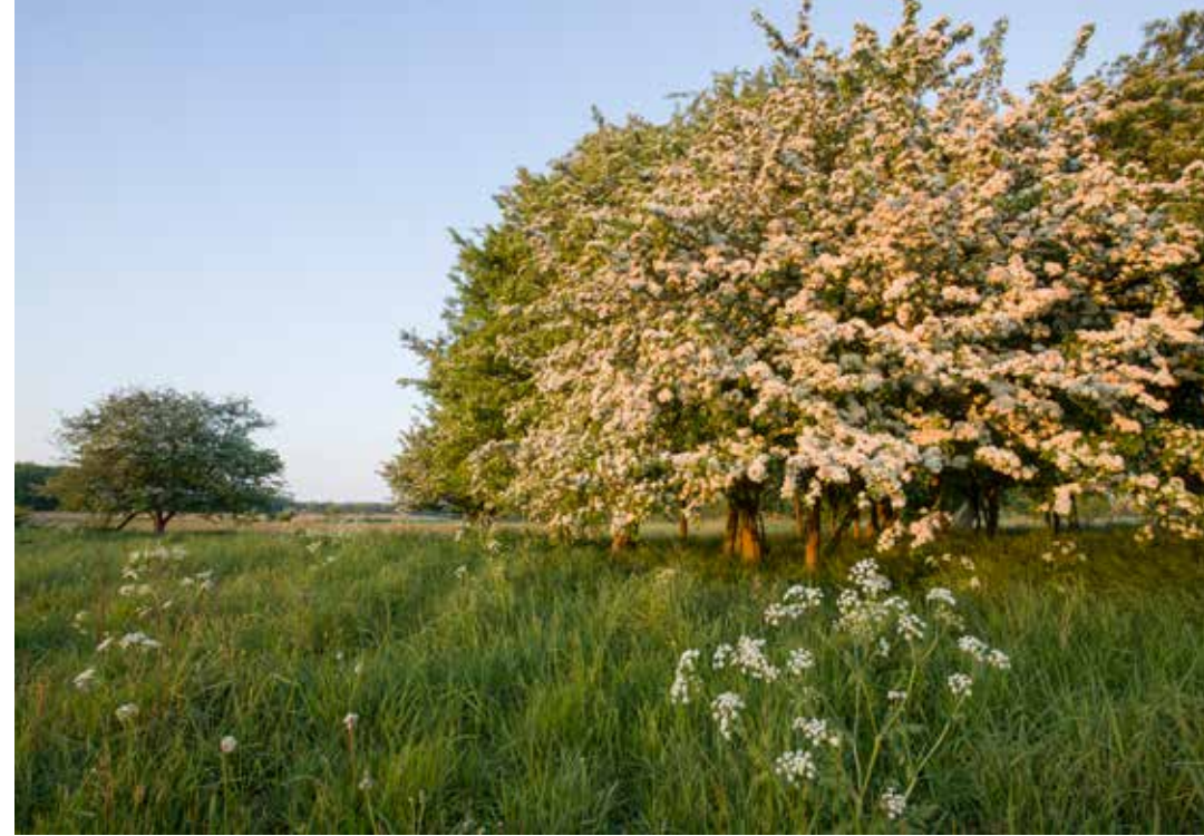
Meidoornstruwelen zijn van grote waarde als voedselbron voor tal van organismen. In april-mei geven ze met hun witte bloemen bovendien kleur aan het landschap.

Door begrazing, maar ook door hun graafwerken, kunnen ze, wanneer ze talrijk voorkomen, een grote impact hebben op vegetaties. De zanderige ondergrond in de open duinen is een ideaal leefgebied voor deze soort. Ooit hadden grote aantallen konijnen een bepalende impact op de vegetatie en het uitzicht van onze duinen. Maar vanaf de jaren 1950 begon de ooit zo talrijke konijnenpopulatie af te nemen. Ziektes zijn de oorzaak van de afname. Eerst was er myxomatose, later volgden nog andere ziektes. De konijnenstand raakte gedecimeerd. Konijnenpopulaties blijven het moeilijk hebben. Het is niet de enige oorzaak dat in de duinen nu veel meer struweel voorkomt dan vroeger, maar de sterke afname van het konijn heeft er zeker toe bijgedragen. Het dichtgroeien van de duinen met struweel heeft grote gevolgen voor al die soorten organismen die afhankelijk zijn van grijze duinen, met hun openheid en lage vegetatie.