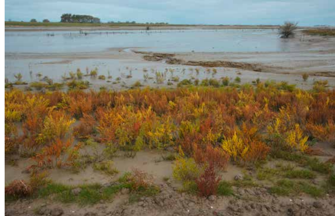
Het laagste deel van de schorre, op de overgang naar het slik. Hier verschijnen de planten die best overweg kunnen met frequente overspoeling door zout water, zoals kweldergras, klein schorrenkruid en zeekraal.

Lokale weersomstandigheden, zoals windrichting en windsterkte, kunnen ook invloed uitoefenen op de sterkte van het getij. Zo zal de combinatie van springtij met een noordwesterstorm die krachtig loodrecht op de kust blaast, voor een extra hoog getij zorgen.