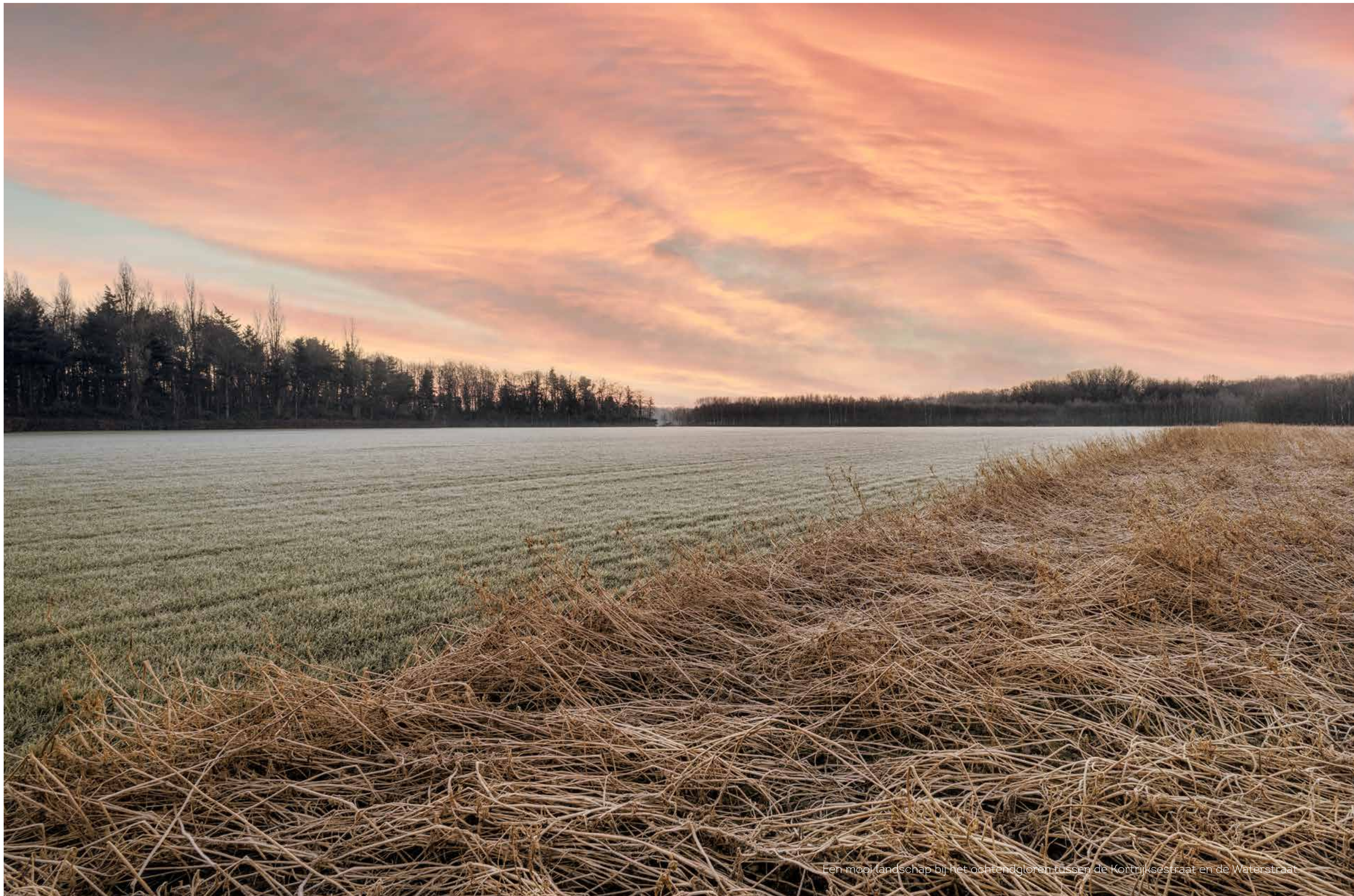
Een mooi landschap bij het ochtendgloren tussen de Kortrijksestraat en de Waterstraat.