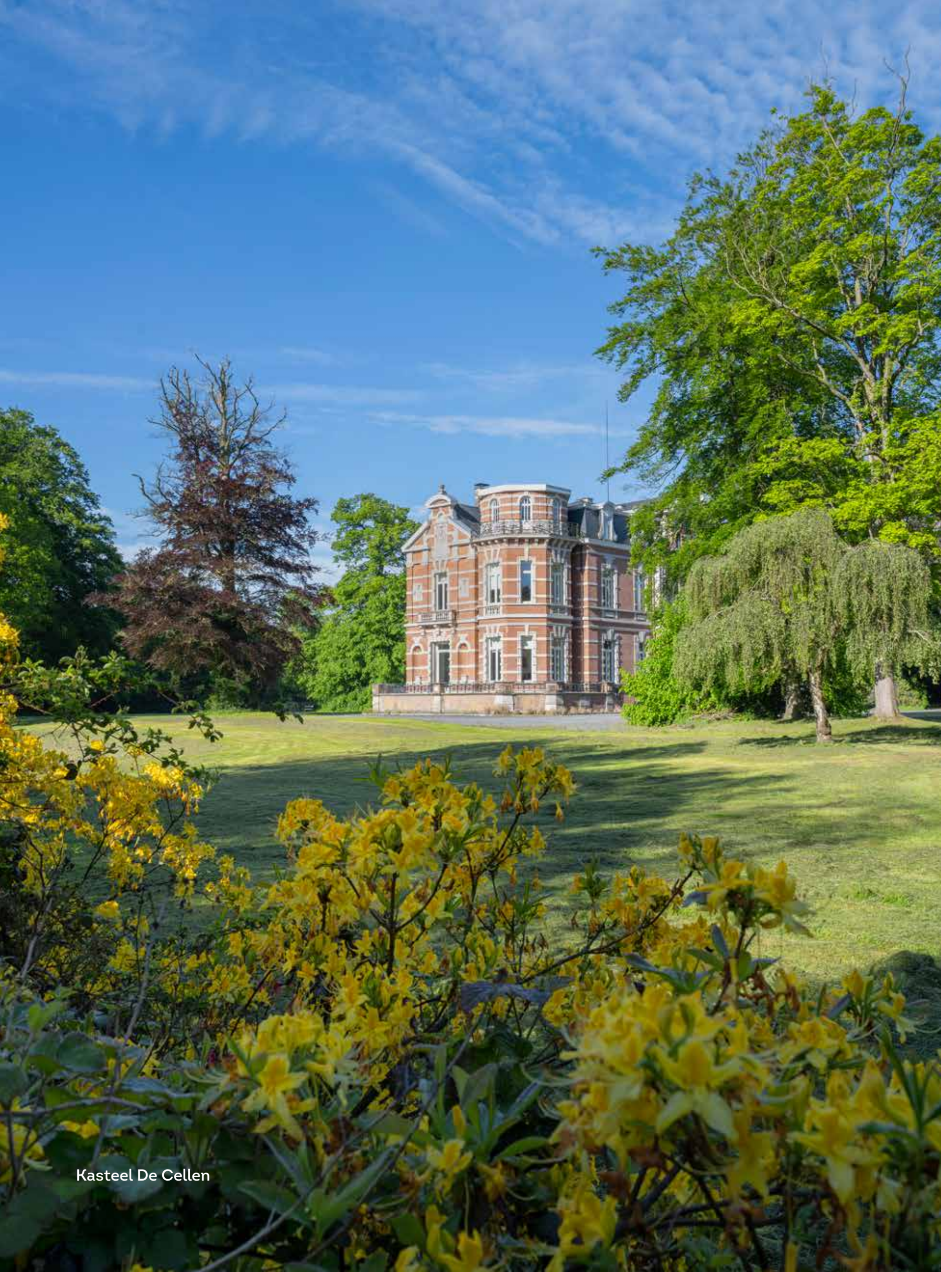
Kasteel De Cellen