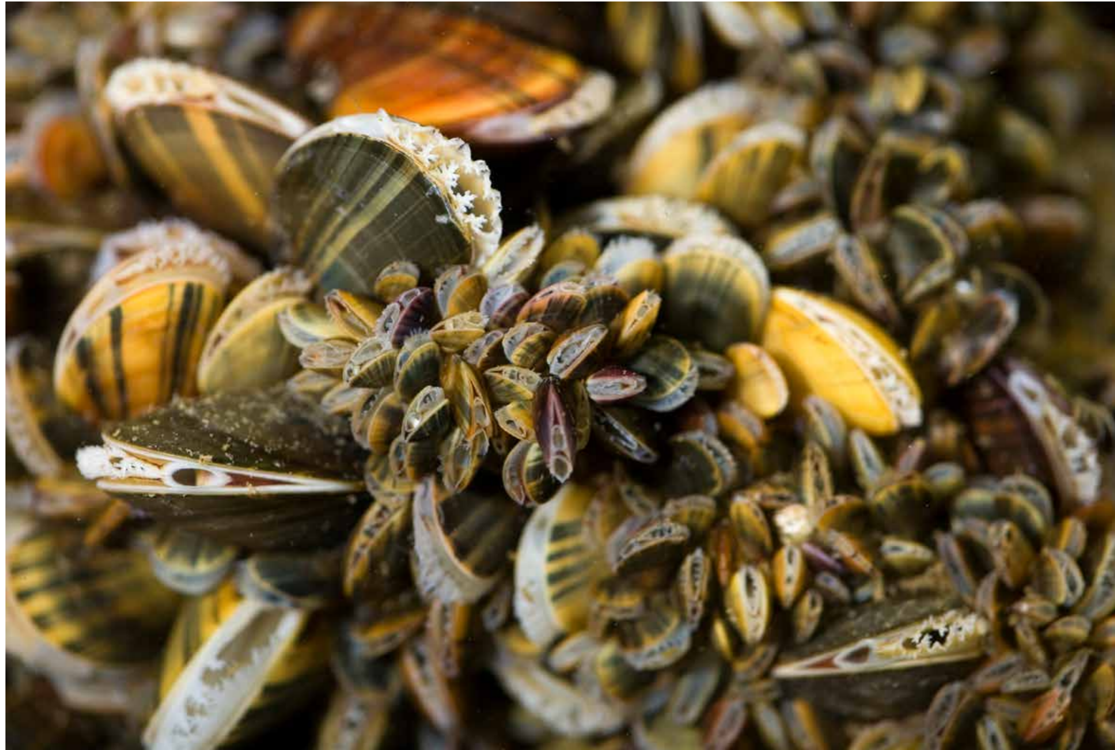
Mosselen groeien talrijk op de strandhoofden (in de volksmond beter bekend als 'golfbrekers') die dwars op het strand staan. De getijdenzone is een optimale groeiplaats. Mosselen voeden zich met plankton, dat ze met behulp van kieuwen uit het water filteren dat ze in en uit hun schelp stuwen.