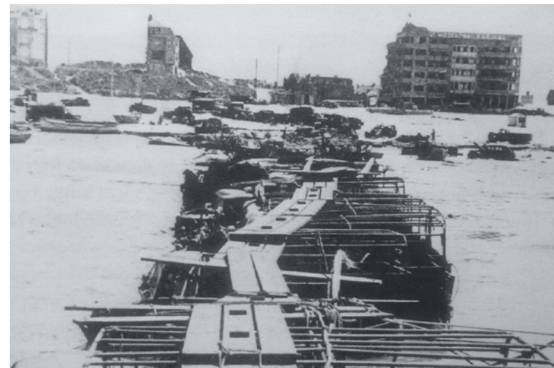
Chaos op het strand van De Panne