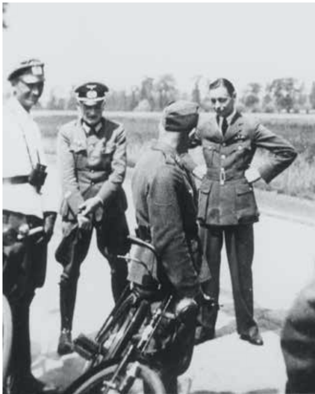
Een Engelse piloot werd gevangen genomen