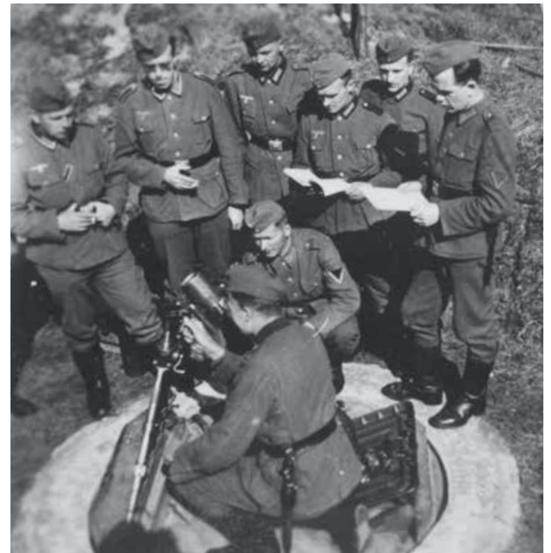
Geschutstand in de duinen van Oostduinkerke