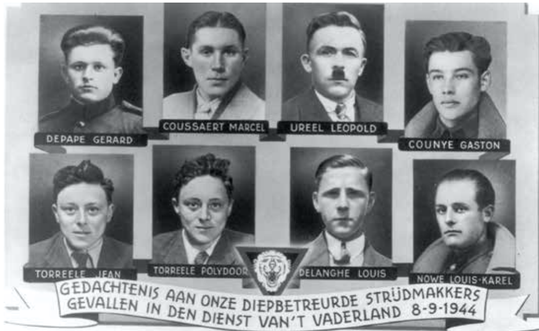
De slachtoffers van 8 september 1944 in Oostduinkerke