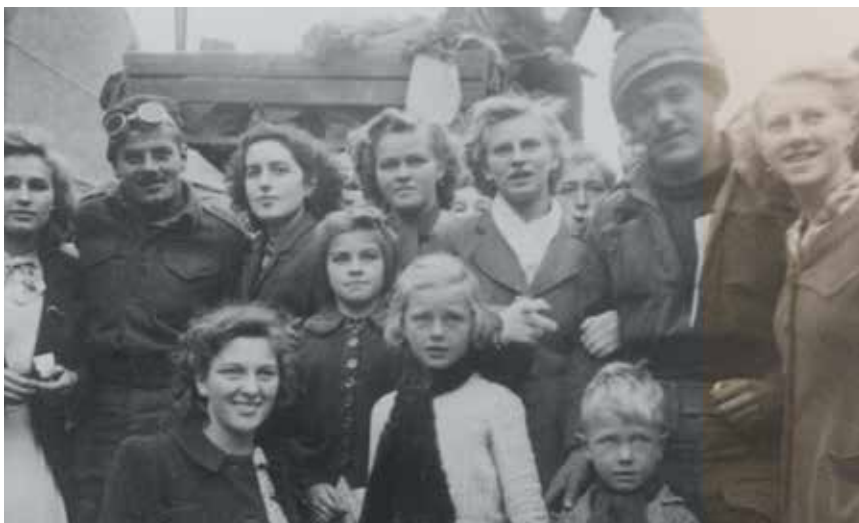
Veurne, bevrijding 1944