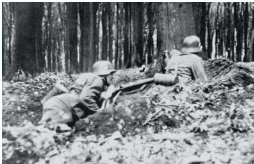
De Panne, 1940, het Duitse leger in de aanval