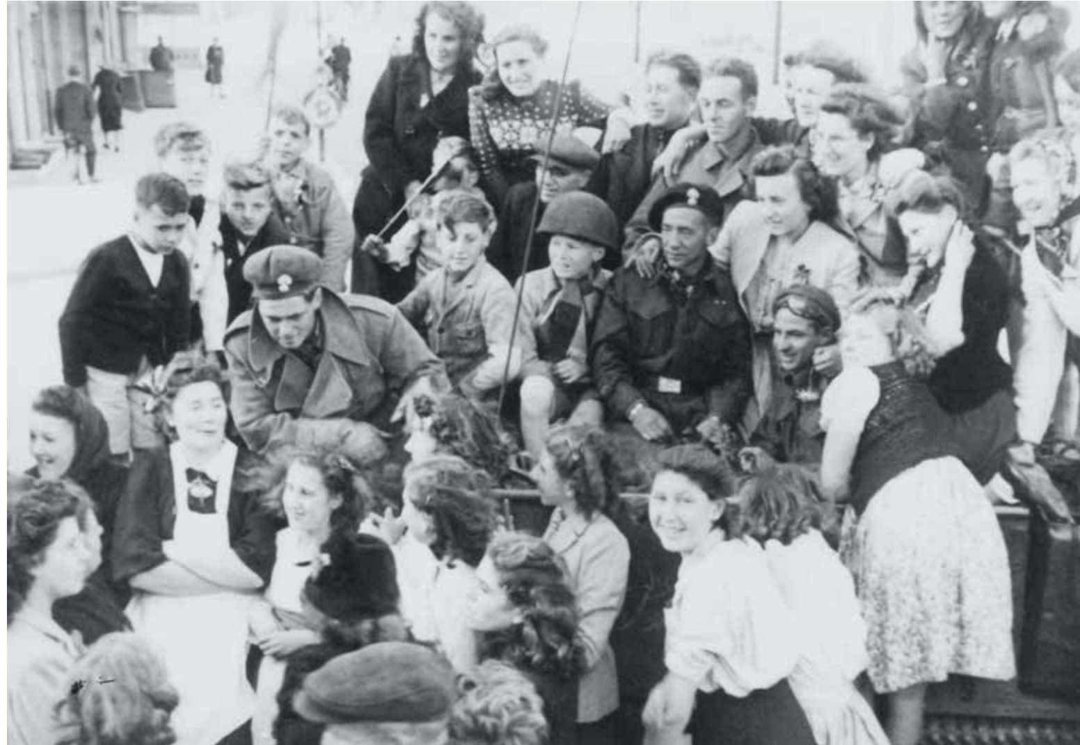
Veurne, de Canadese bevrijders in de D. Dehaenelaan