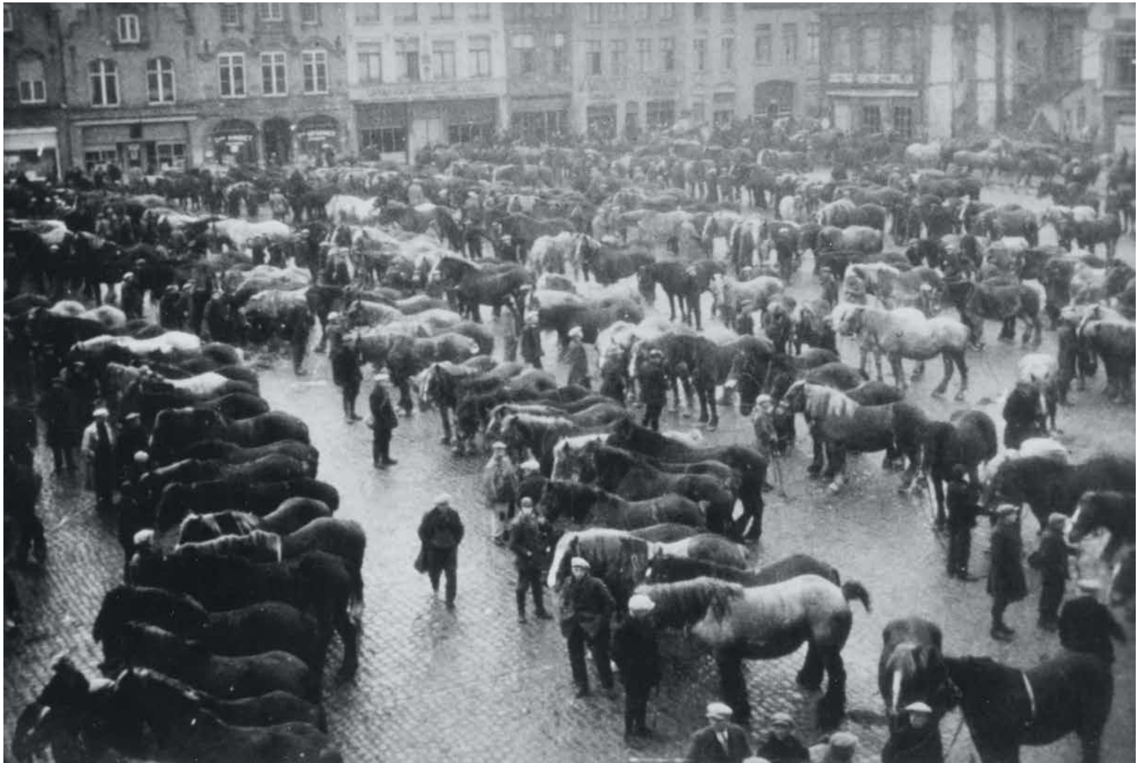
Opeising van paarden op de markt van Veurne