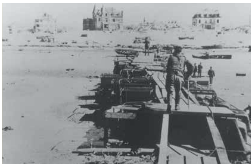
De Panne, een pier gemaakt van militaire voertuigen moet de inscheping van de Engelsen vanop het strand vergemakkelijken.