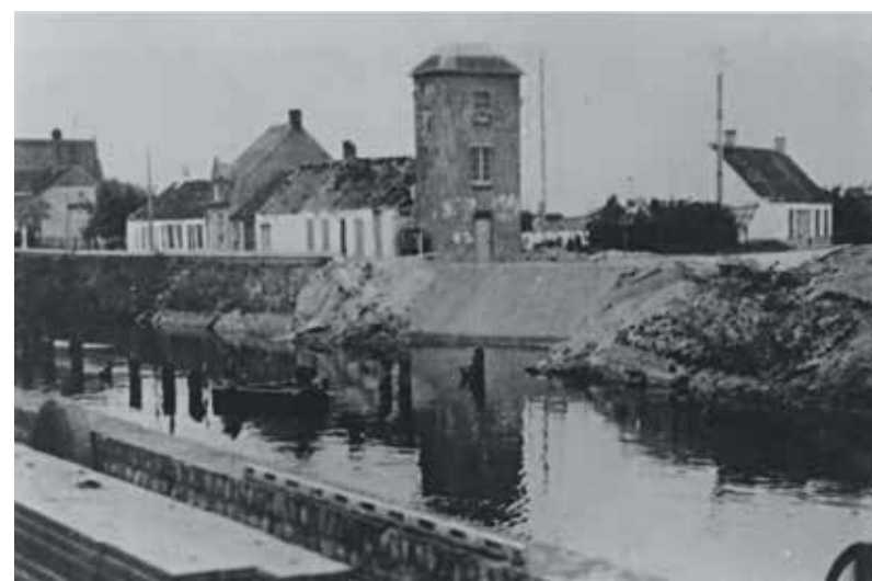
De brug in Wulpen werd o pgeblazen en sneed de gemeente in twee.