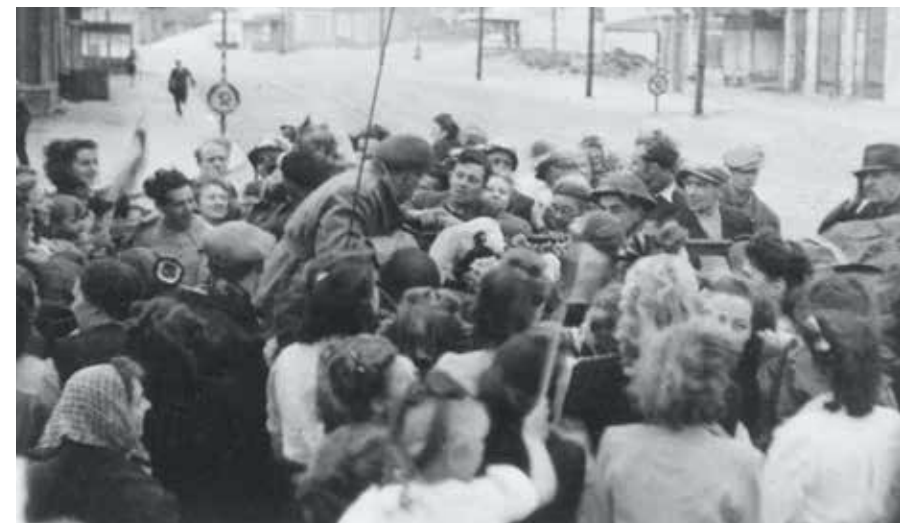
Hulde aan de Canadese bevrijders