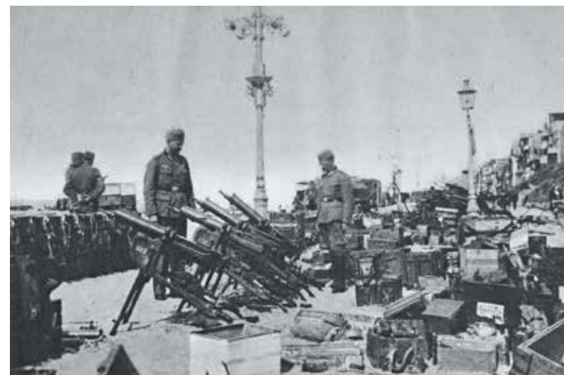
Achtergelaten buit op het strand van De Panne