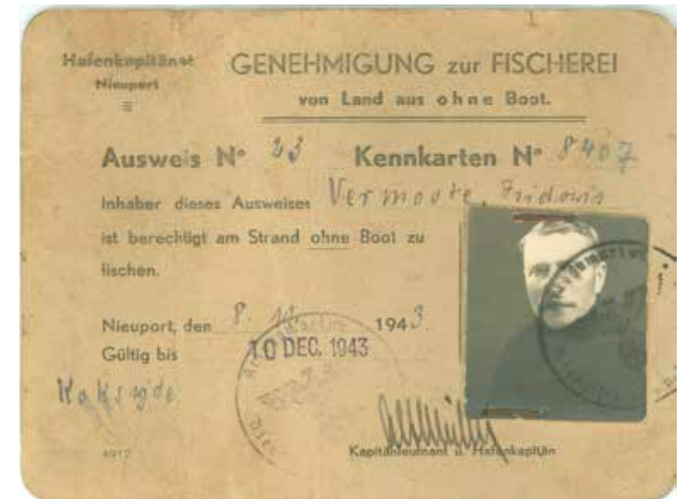
Schriftelijke machtiging voor het betreden van het strand om te vissen