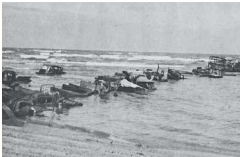
De Panne, een autobrug van het gevluchte Britse expeditieleger