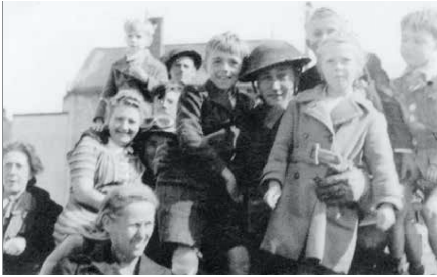
Bevrijding van Koksijde door de Canadezen op 9 september 1944