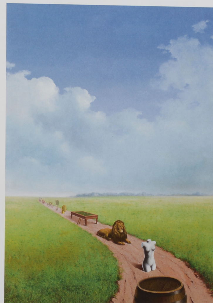
La jeunesse illustrée, 1937

Museum Boijmans Van Beuningen, Rotterdam