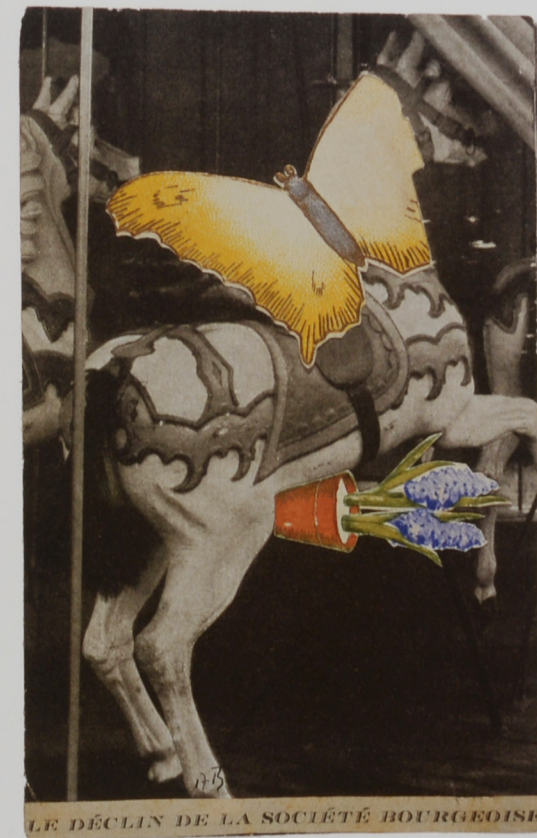
Le déclin de la société bourgeoise , ca. 1935-1939

Scottish National Gallery of Modern Art, Edinburgh