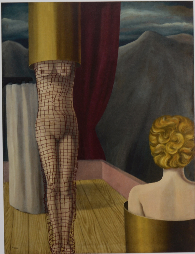
Les complices du magicien, 1926