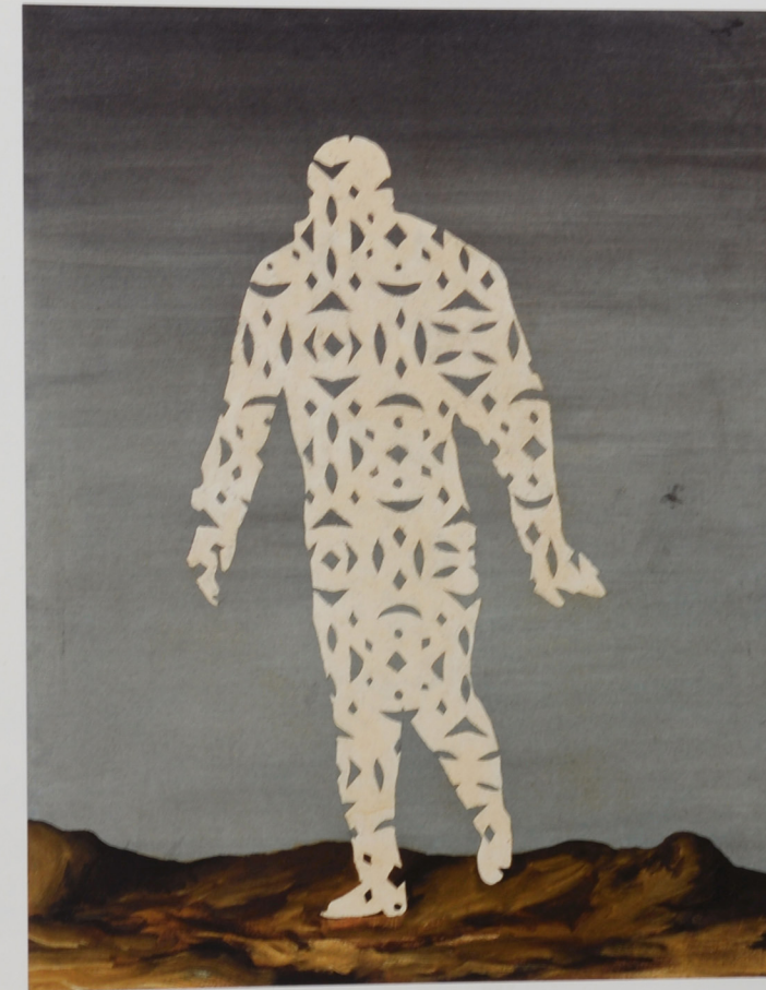
L'esprit comique, 1928