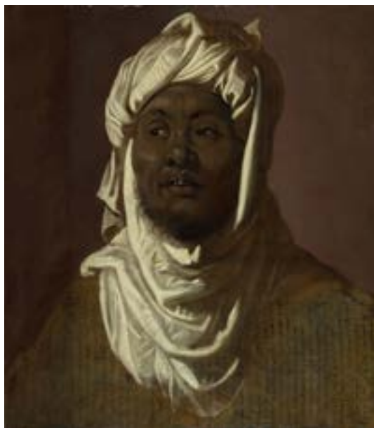
Afb. 2 Peter Paul Rubens, Portret van een Afrikaan met tulband , 1609

Als gevestigd schilder wist Rubens de manier waarop zwarte mensen tot dan in de kunst verbeeld werden, naar een hoger niveau te tillen. Hij maakte hiervoor gebruik van twee mannelijke modellen. Een van hen staat op de bekende olieverfschets Vier studies van het hoofd van een Moor in de Koninklijke Musea voor Schone Kunsten van België in Brussel. Rubens overtreft hier al zijn voorgangers, zowel door zijn kleurgebruik voor de huid, als door de authenticiteit in de uitdrukkingen van de man, in het bijzonder zijn spontane