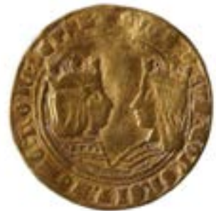
Cat. 1 Gouden munt (excellente) met Ferdinand van Aragon en Isabella van Castilië, ca. 1500

De Portugese aanwezigheid in Antwerpen tijdens de zestiende en de eerste helft van de zeventiende eeuw bestond minstens uit een tachtigtal firma's. Hun goederenhandel was vooral op de Portugese overzeese gebieden georiënteerd. In Antwerpen kochten ze vaak textiel, glaswerk en koperen voorwerpen uit Zuid-Duitsland om die in West-Afrika voor goud, ivoor, paradijskorrels ( Aframomum melegueta ) en zwarte slaven te ruilen. 4 De firma Ximenes, die in zowel Antwerpen als Lissabon actief was, specialiseerde zich in de slaventratiek tussen Angola en Zuid-Amerika. Zij charterde schepen in Lissabon, die aan de Angolese kust de Portugese factorijen aandeden om er slaven te kopen. De voornaamste bestemmingen van deze menselijke ladingen waren Pernambuco vandaag Recife in Brazilië en