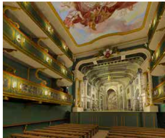
Twee computervisualisaties van het interieur van het Theater van het Tapissierspand, omstreeks 1730 Visualisatie: Timothy De Paepe