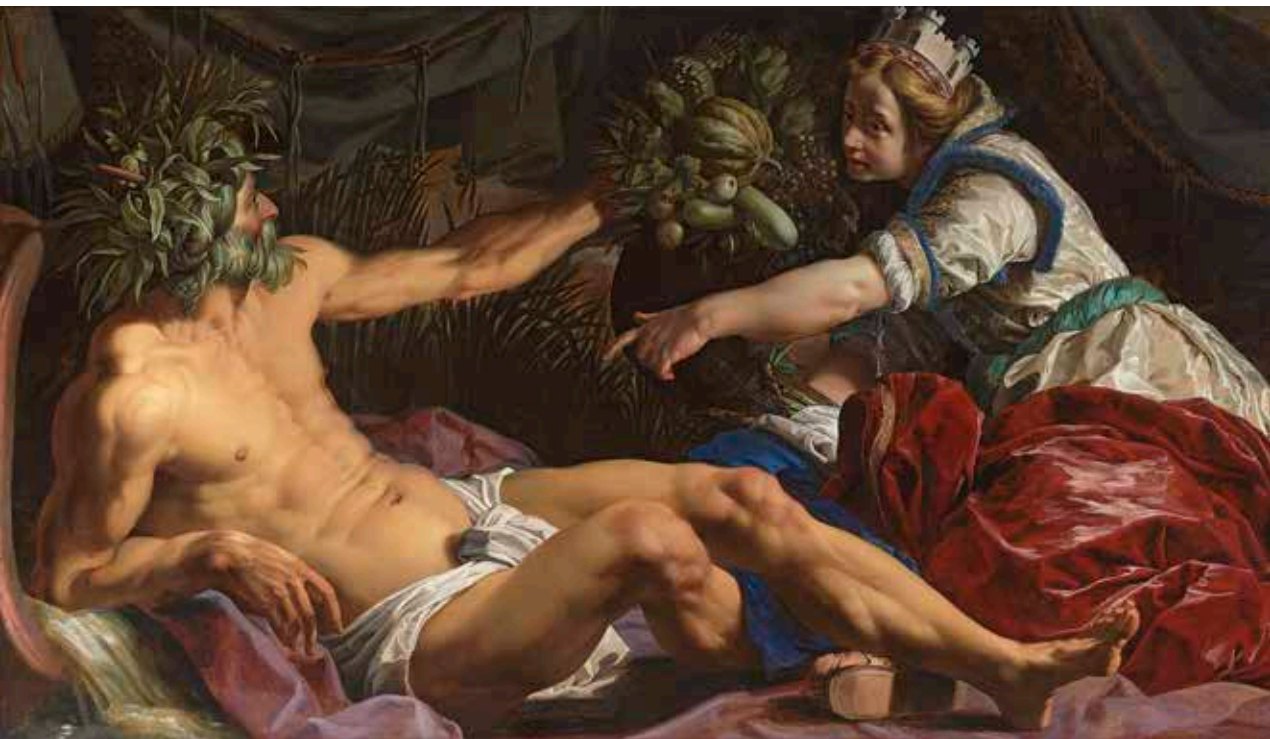
Abraham Janssens (I) Scaldis en Antverpia Antwerpen, 1609

Vooraan, tegen het podium, was er een orkestbak over de hele breedte van de zaal. Het publiek kon zien hoe daar, een kwartiertje voor het begin van de voorstelling, de musici plaatsnamen. De orkestleden zaten op twee banken: een bank aan elke zijde van een lange lessenaar. Aan het einde van de lessenaar stond een klavecimbel. Orkestleden betraden de orkestbak via een lage deur in de noordelijke wand van het auditorium.