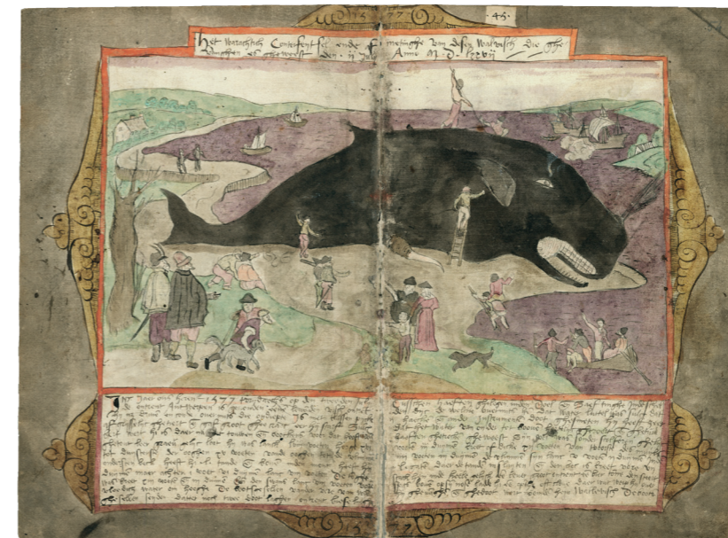
Adriaen Coenen, Groot Visboek , 1577–81. Koninklijke Bibliotheek, Den Haag.