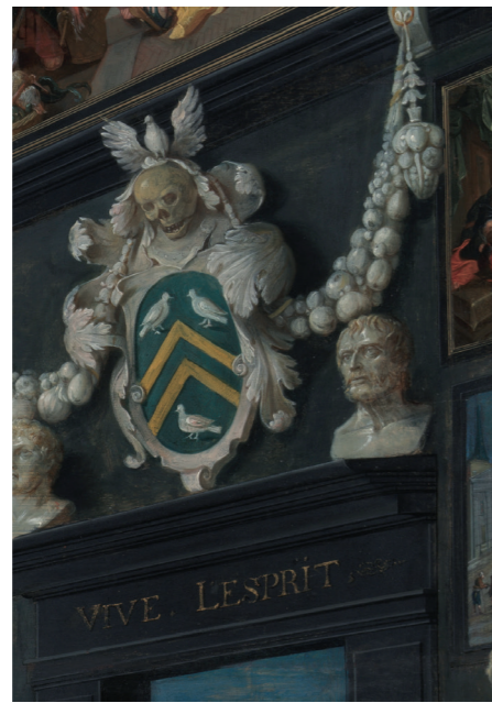
Wapen en devies van Cornelis van der Geest en buste van Seneca boven de deuropening