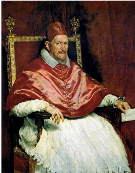
Diego Velázquez, Paus Innocentius X , 1650. Galleria Doria Pamphilj, Rome

S.M.A.K., Stedelijk Museum voor Actuele Kunst, Gent, 14