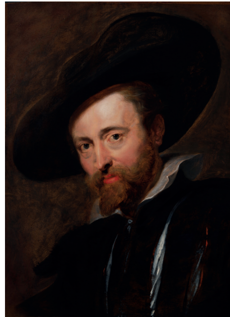
Peter Paul Rubens, Zelfportret , ca. 1623–30. Rubenshuis, Antwerpen

Olieverf op doek, 76,5 × 61,5 cm Mu.ZEE, Oostende