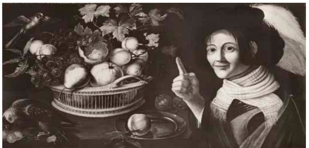
AFB.5 Jan Davidsz. de Heem

De vroegst bekende schilderijen van De Heem, die al in Leiden zijn gemaakt, vormen de enige aanwijzing voor zijn inspiratiebronnen. Uit deze werken blijkt duidelijk dat Balthasar van der Ast voor hem van groot belang was. Van der Ast, die van 1619 tot 1632 in Utrecht werkte, is de meest voor de hand liggende kandidaat om zijn leraar te zijn geweest.