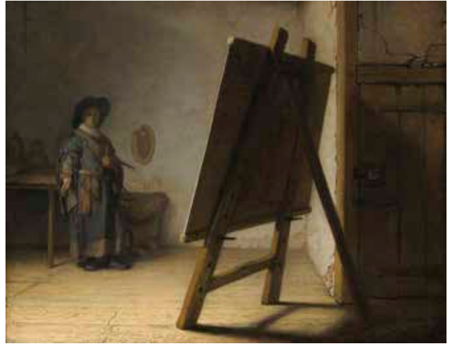
AFB.11 Jan Davidsz. de Heem Schilder in zijn atelier , ca. 1630 Paneel, 52,5 x 80,5 cm. Boston, Museum of Fine Arts (Center for Netherlandish Art) (cat. nr. 023).

Misschien zag De Heem Rembrandts schilderij en besloot hij de ruimte aan te passen aan zijn eigen compositie? Beide werken mogen niet beschouwd worden als een weergave van een bestaande situatie in een specifiek atelier. Het werk van De Heem kan, meer nog dan de Rembrandt, worden beschouwd als een toespeeling op het vak van de schilder.