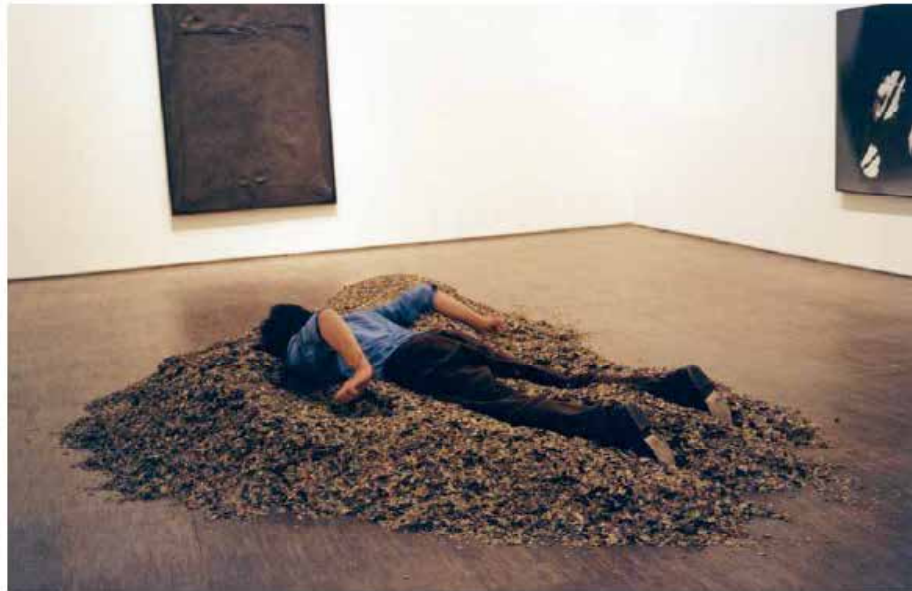
Boyle Family Elevational Study for the Barachara Site, 5th and 6th Streets with 5th Street, Greenwich Village and Chelsea, 2000-2008 de la obra: World Storm (1985) Tecnología mixta, video, obra de arte 180 x 180 x 95 cm Londres, Boyle Family