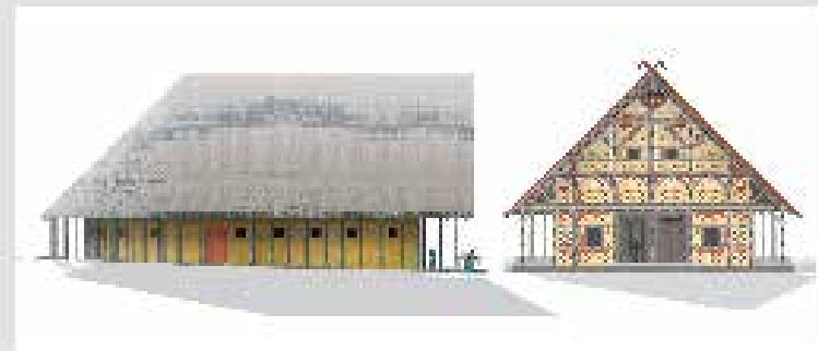
Figure 2 Ma « Mont Lassois » (21) Reconstitution architecturale de la grande maison à deux étages, Saint-Hilaire (21), Isère, PCJ « Mont Lassois » (Baer)

La situation d'échange spatial du moment ou les données archéologiques renvoient à l'existence de ces manifestations ostentatoires dans le temps et l'espace. Des groupements de sépultures princières ont ainsi pu être observés dans certaines régions au sein même de l'Europe nord-alpine, entre la fin du v^e s. et la fin du premier quart du iv^e s. av.-J.C. Ces zones privilégiées, séparées autour d'éléments princiers ou de grands centres de production et d'échanges ont été interprétées comme autant de territoires princiers ou de centres directs de puissance locale/principales qui permettent, entre autres, de contrôler des échanges à longue distance pour le profit ou le statut de la hiérarchie sociale. Pour ces périodes, il y a celle de Vix en Bourgogne. De occuper une position géostratégique de passage plus sûre ou difficile à des grandes voies de communication nord-sud que furent le réseau Nord de la Seine et de la Saône (le val de la Côte-d'Or) – fonctionnant comme autant de axes vers le Bassin parisien et les régions du nord et du sud-ouest – et la vallée du Rhin et un débouché sur la Méditerranée ou les pays alpins, le seul locus à être le lieu d'édification d'une résidence princière durant le dernier quart du v^e s. et le premier quart du iv^e s. av.-J.C. (fig. 1).