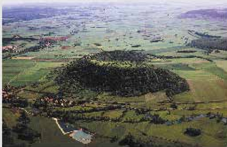
Figure 1 Vix et Mont Lassois (21), Vue aérienne