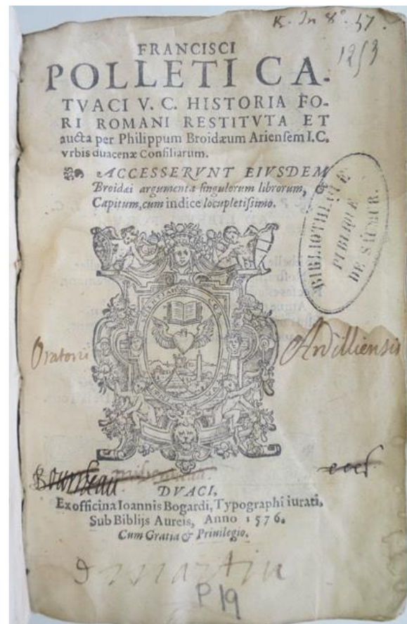
MSVL P 19