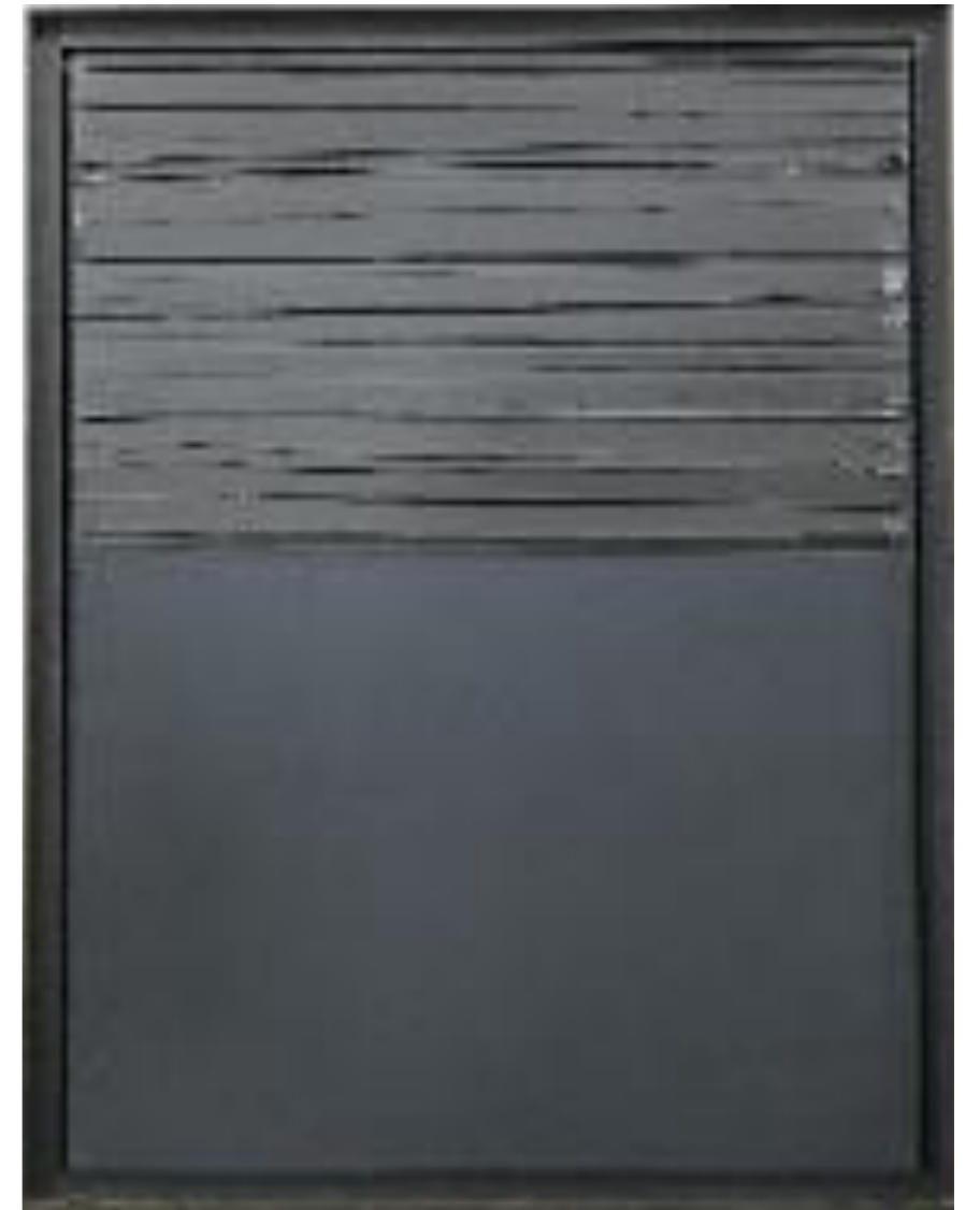
Peinture acrylique 25.05.2004 Collection particulière