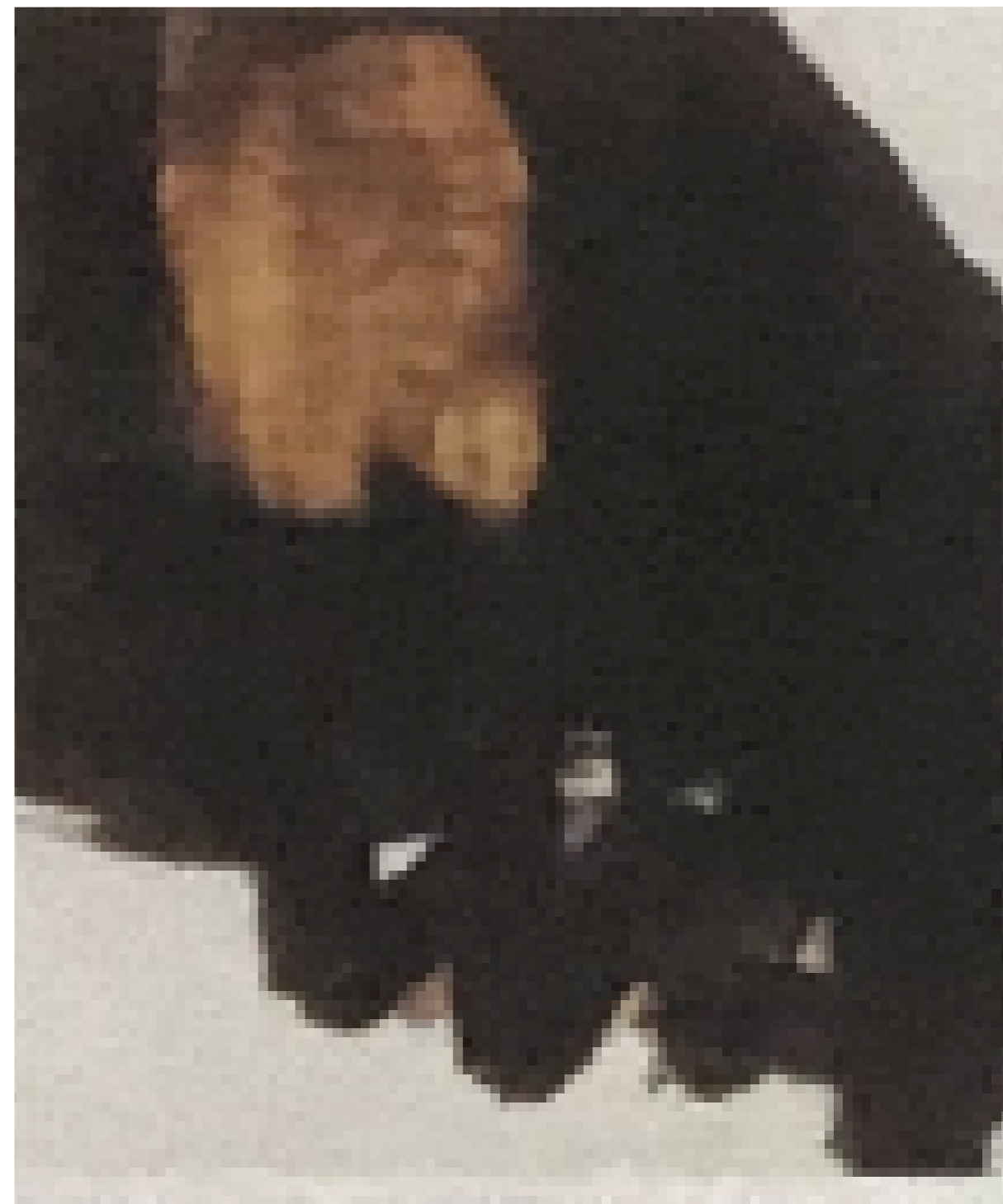
Peinture 162 × 130 cm Musée Soulages – Rodez 1.06.1964