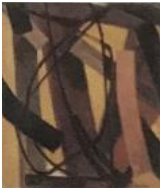
Peinture, 1946 81 × 100 cm Musée Soulages – Rodez 2014.3.14