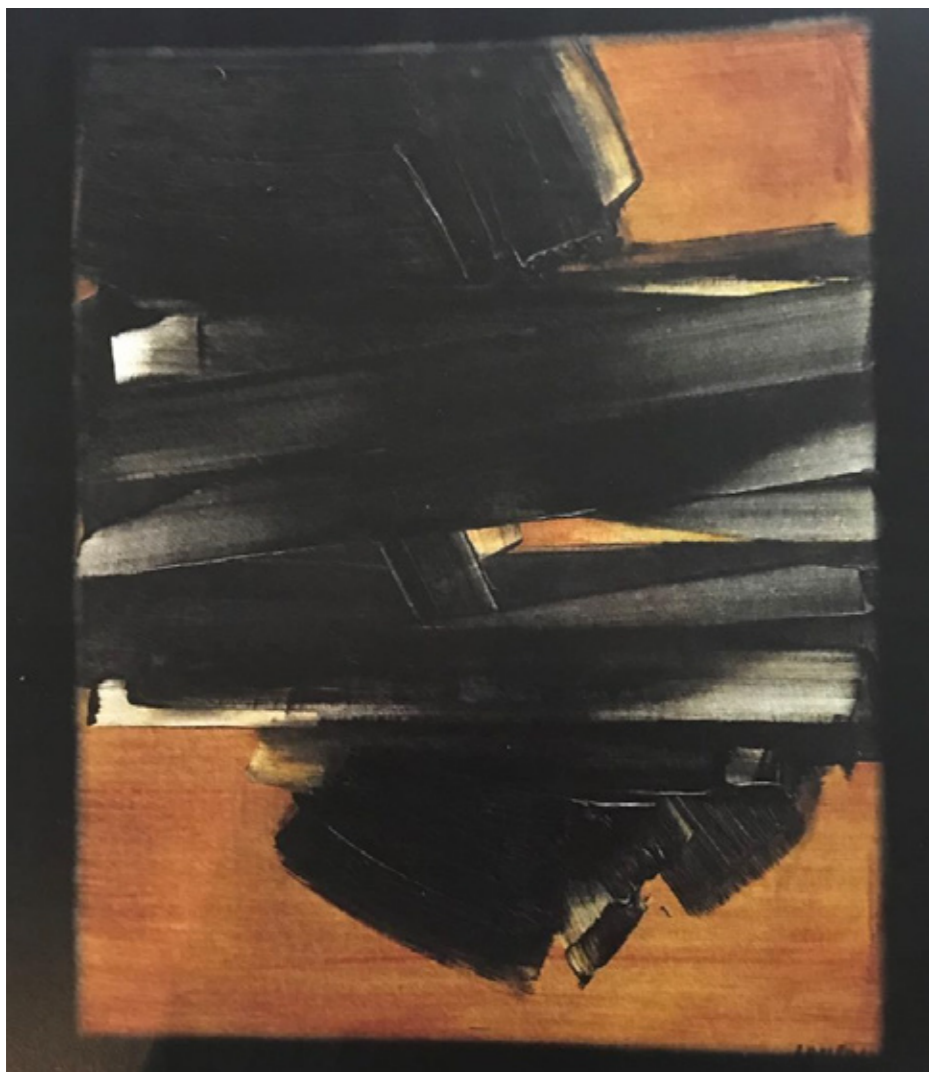
Huile sur toile, 1960 Collection particulière

Lorem ipsum dolor sit amet, consectetur adipiscing elit. Nullam vel vehicula massa. Mauris nec leo dictum, rutrum augue et, fringilla mauris. Duis in quam ipsum. Nam accumsan sit amet est eu finibus. Maecenas rhoncus, tellus tristique tincidunt lacinia, libero metus ornare velit, et dictum dolor risus non quam. Etiam et porta velit, vitae dapibus est. Ut sit amet diam non lorem iaculis pharetra. Fusce imperdiet vulputate mauris volutpat bibendum. Sed commodo mattis gravida. Class aptent posuere.