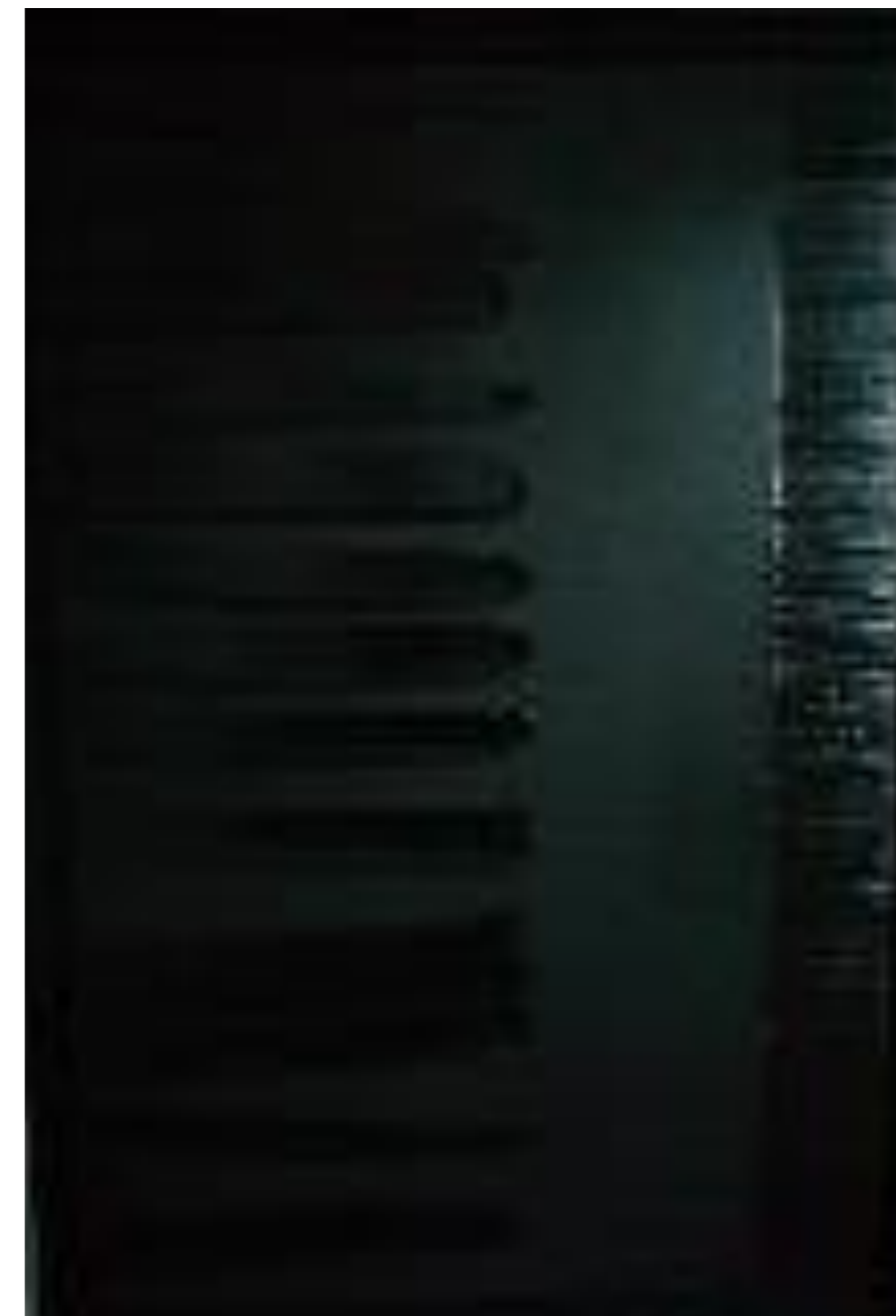
Peinture acrylique 125 × 174 cm 9.11.2008 Collection particulière