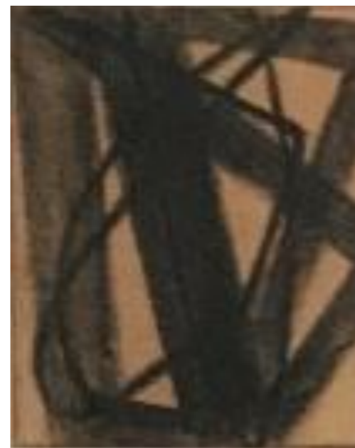
Fusain sur papier, 1946 46,5 × 61,5 cm Musée Soulages – Rodez 2014.1.82