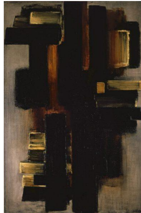
Peinture 1.6.1953 Collection particulière

Exposition Grosse Ausstellung Französische abstrakter Malerei, 1948