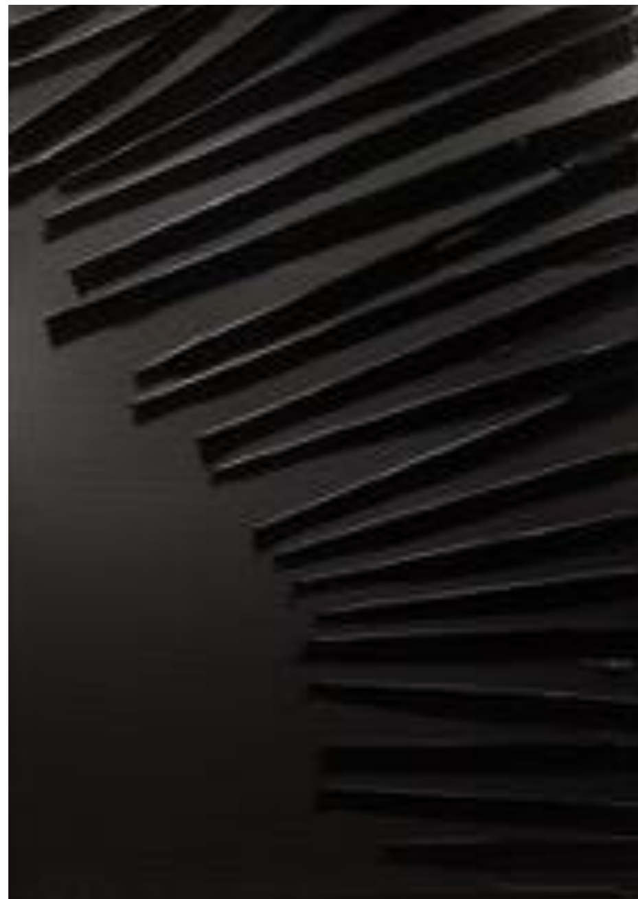
Peinture 143 × 202 cm 17.06.2008 Collection particulière