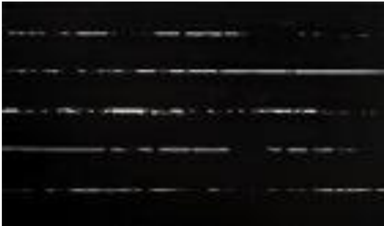
Peinture 116 × 73 cm 21.05.2001 Collection particulière

« Je peins d'abord pour moi ; je ne crains pas de le dire, c'est pour que ma vie soit possible. Je peins parce que j'ai besoin de peindre. Mais je considère que ma peinture ne devient de l'art qu'à partir du moment où elle est vue, où elle est regardée par d'autres et où elle est comme une oeuvre d'art, c'est-à-dire comme une chose que d'autres regardent et vivent à leur manière. »