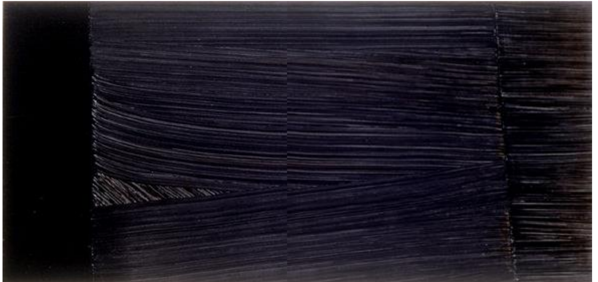
Peinture acrylique, 1979 310 × 162 cm Musée Picasso, Antibes

Entretien « Pierre Soulages, un atelier à Sète » d'un journaliste avec l'artiste, 9 avril 1961