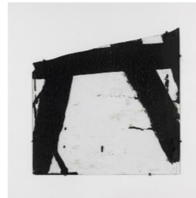
Goudron sur verre, 1948 45,5 × 45,5 cm