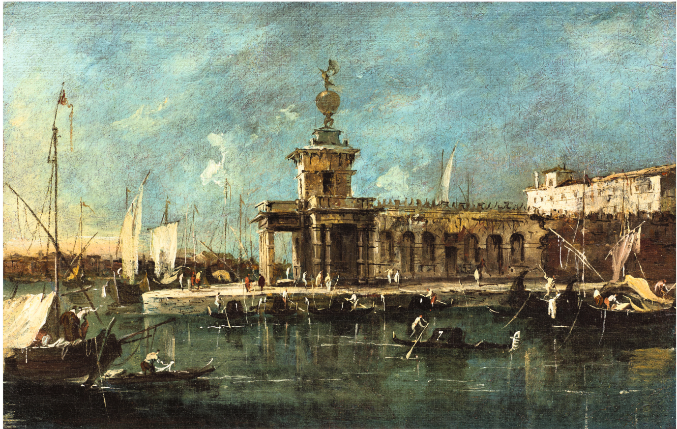
20. Francesco Guardi Vue de la Punta della Dogana, Venise, vers 1765 Huile sur toile 21 x 32 cm