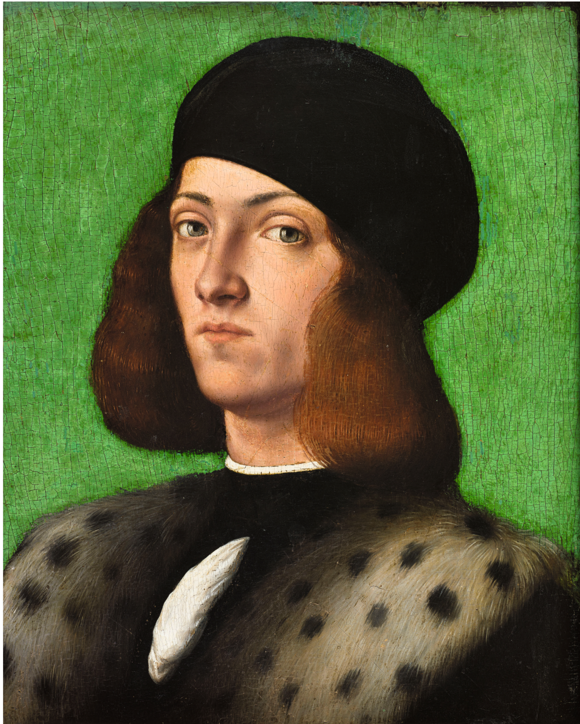
13. Andrea Previtali (aussi connu sous le nom d'Andrea Cordegliaghi) Portrait de jeune homme au bonnet noir , début du XVI e siècle Huile sur panneau 33 x 27 cm