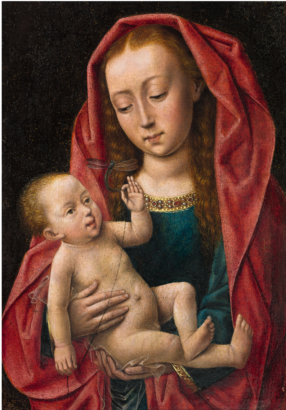
1. Rogier Van der Weyden (d'après) Vierge à l'Enfant , XV e siècle Huile sur papier marouflé sur bois 27,5 × 19 cm