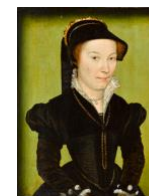
5. Catherine of Aragon by Hans Memling, 1480-1490