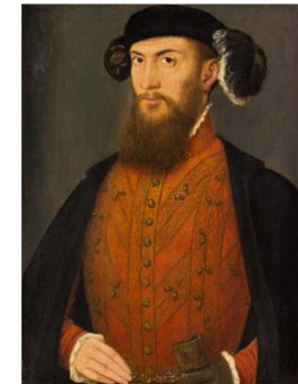
12 Pieter Pourbus, de Edele, en een andere 1480-1490, oil on panel 18.5 x 12.5 cm