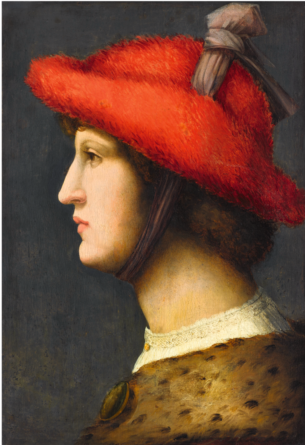
14. Andrea Del Brescianino (Andrea Piccinelli, dit) Courtisan au chapeau de fourrure rouge , début du XVI e siècle Huile sur panneau 45 × 30,9 cm