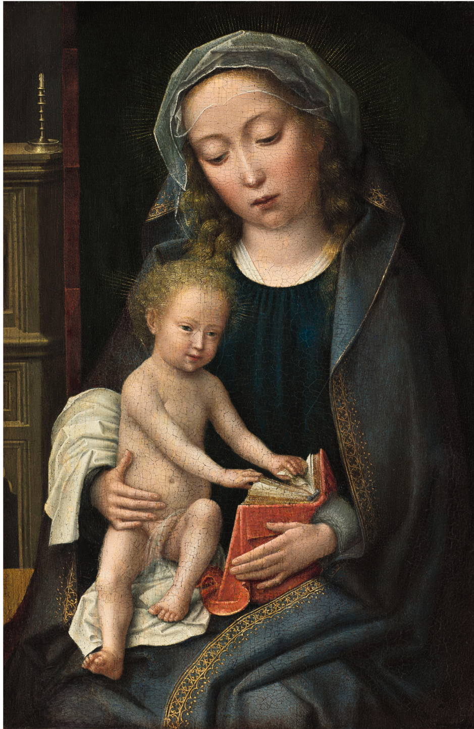
2. Gérard David Vierge à l'Enfant , fin du XV e siècle Huile sur panneau 34,5 × 23 cm