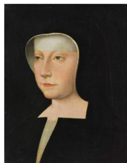
3. Jeanne d'Arc by Jean Fouquet, 1480-1490