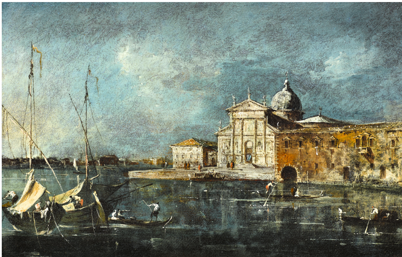
21. Francesco Guardi Vue de San Giorgio Maggiore, Venise, vers 1765 Huile sur toile 21 x 32 cm