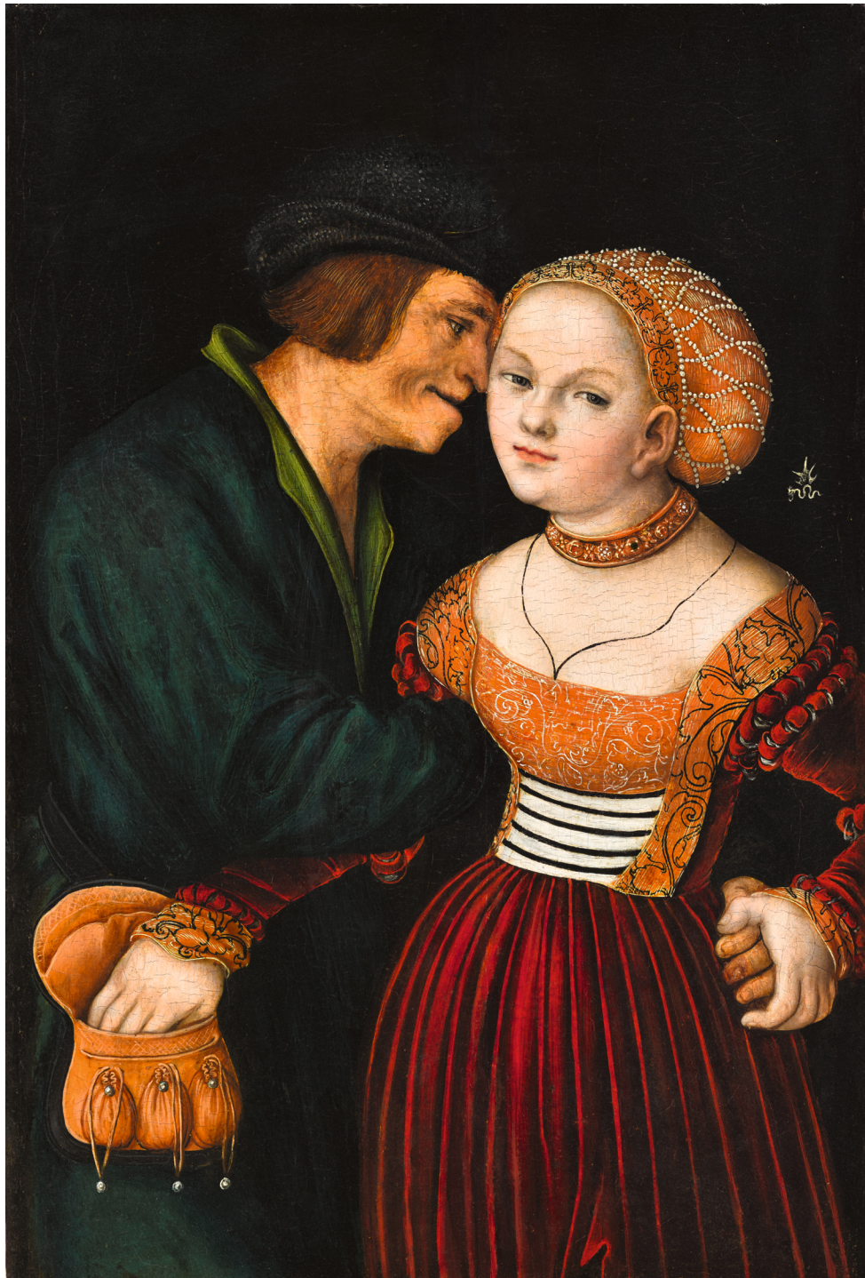
26. Lucas Cranach l'Ancien Les Amants mal assortis ou Le Vieil Homme amoureux , vers 1530 Huile sur panneau 38,7 × 26,7 cm