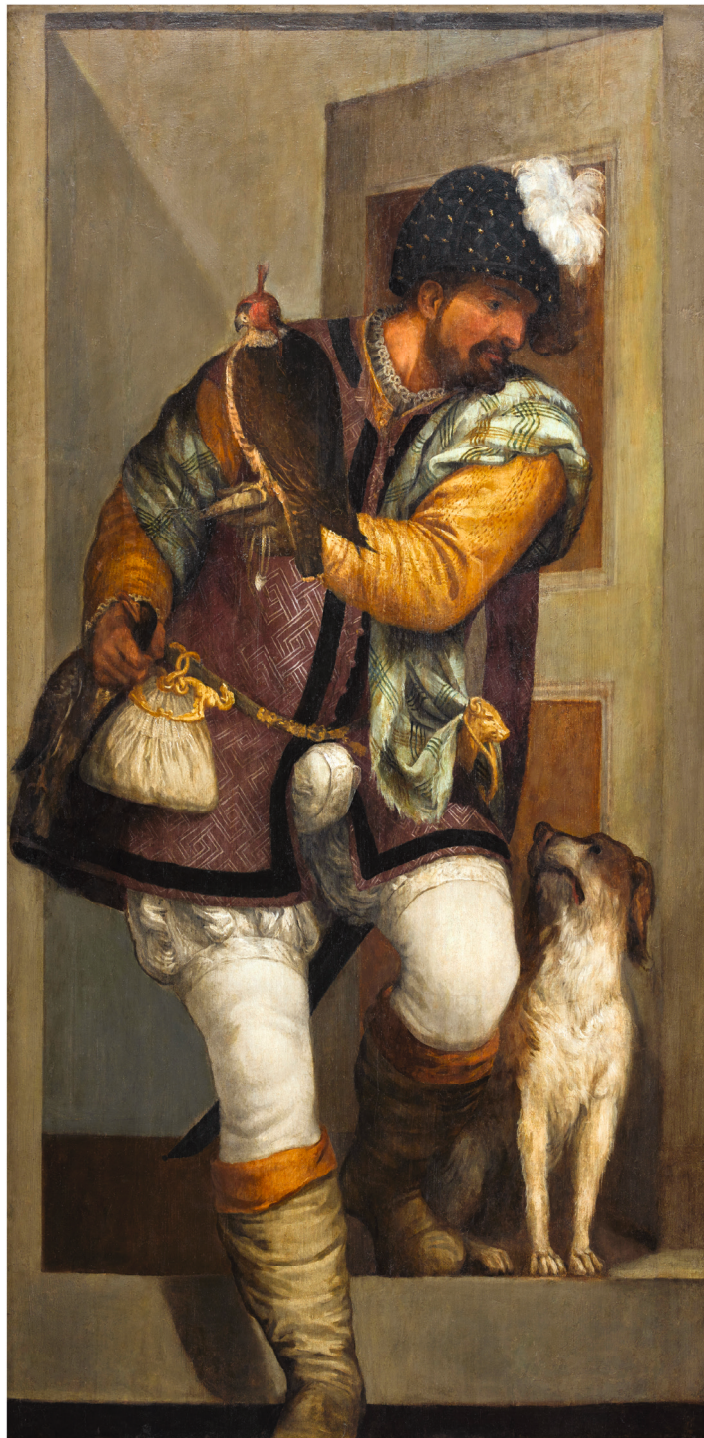
16. Véronèse (Paolo Caliari, dit) Le Fauconnier , vers 1560 Huile sur panneau 220 × 120 cm