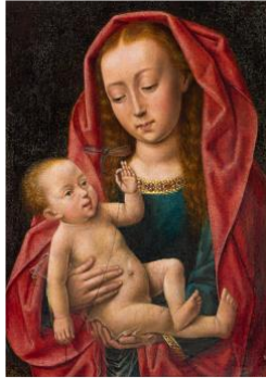
8 Rogier van der Weyden, Lactans do 1480-1490, oil on panel 18.5 x 12.5 cm