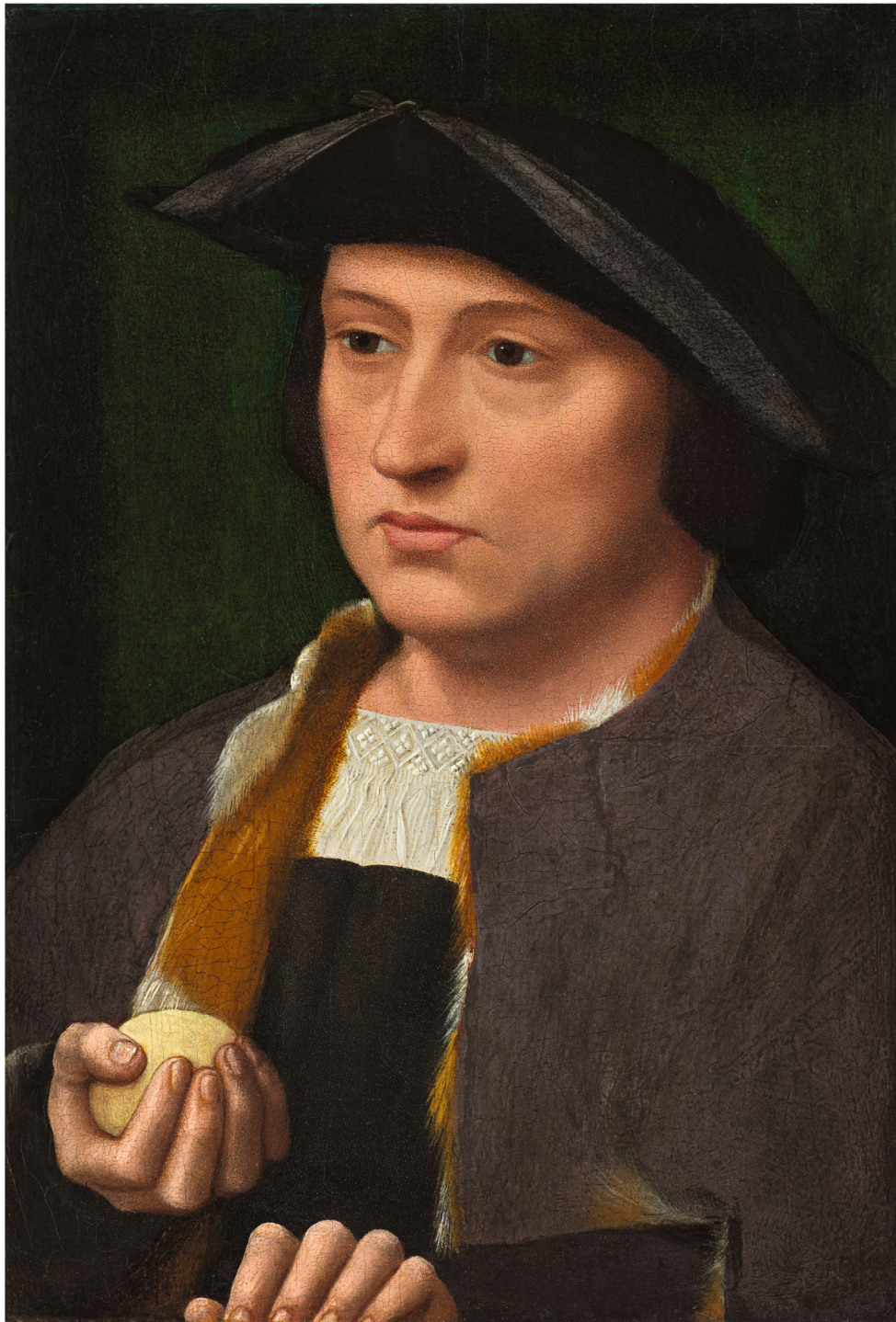
4. Adriaen Isenbrandt Portrait d'homme , première moitié du XVI e siècle Huile sur panneau 22,2 × 15,2 cm