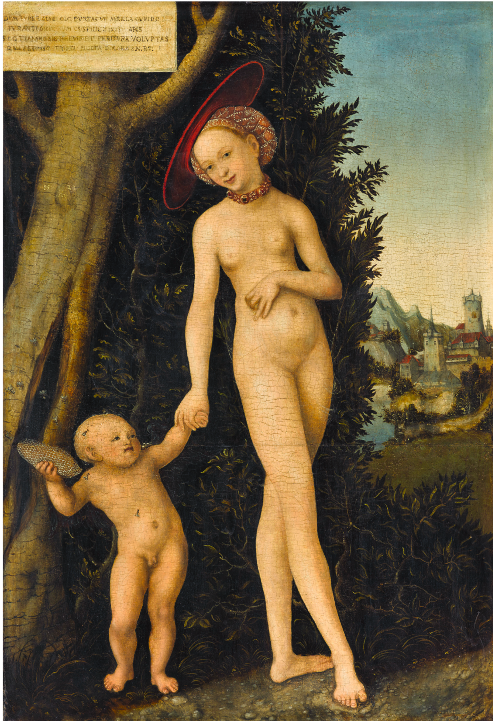
27. Lucas Cranach l'Ancien Vénus et Cupidon volant du miel , 1531 Huile sur panneau 51 × 35 cm