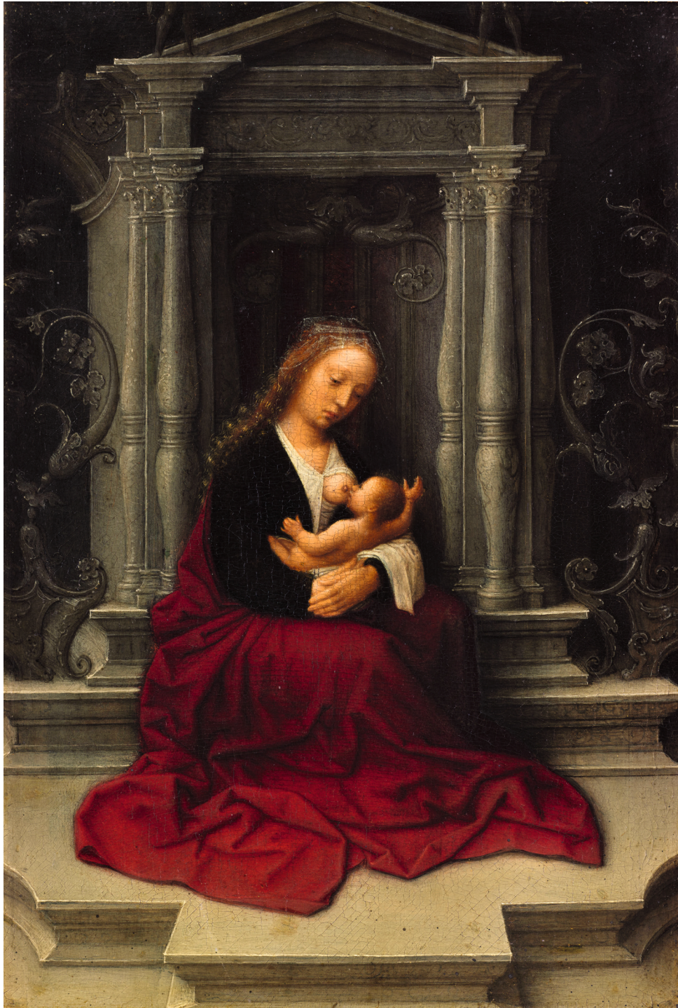
3. Adriaen Isenbrandt La Vierge et l'Enfant , début du XVI e siècle Huile sur panneau 31,5 × 22,5 cm