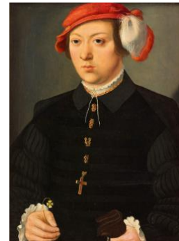
11 Barthel II Bruyn 1480-1490, oil on panel 18.5 x 12.5 cm