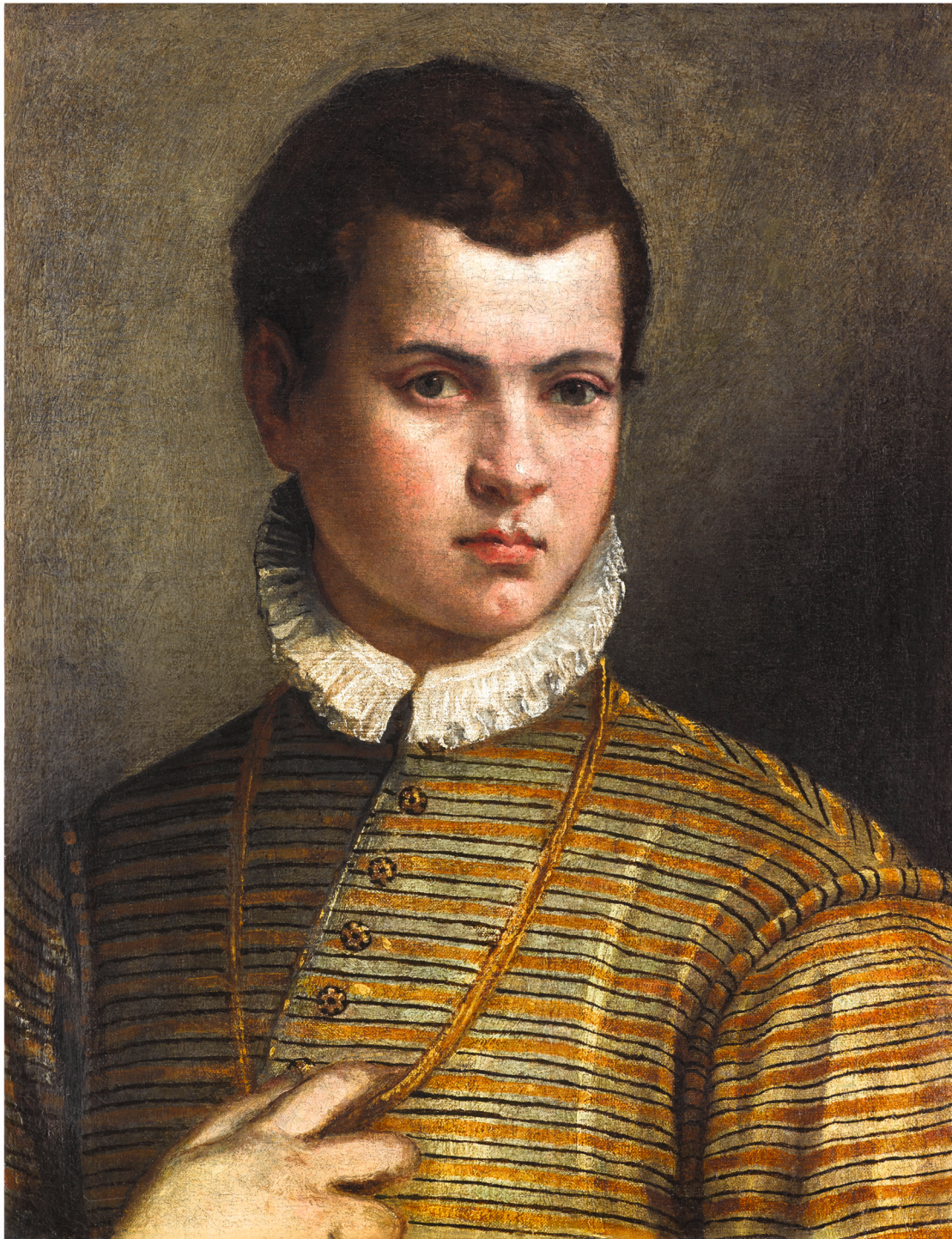
17. Véronèse (Paolo Caliari, dit) Portrait de jeune homme , vers 1560 Huile sur toile 51,2 × 40 cm