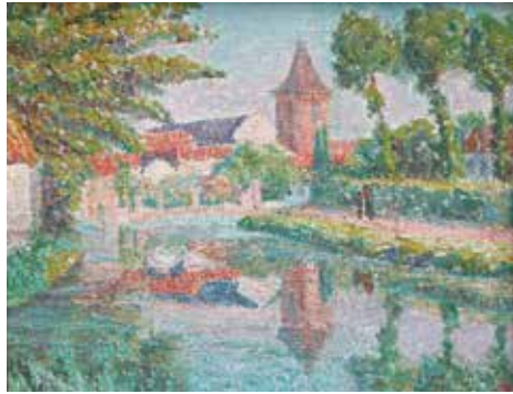
[Afb. 17] Yvonne Serruys, Licht met in de verte de Sint-Andreaskerk van Menen (Menen-Jules) (revers vers), afd. 66, 1925, olieverf op doek, 38 x 27,5 cm, Privécollectie (Vlaing Beach, Curacao, 30 april 2024).