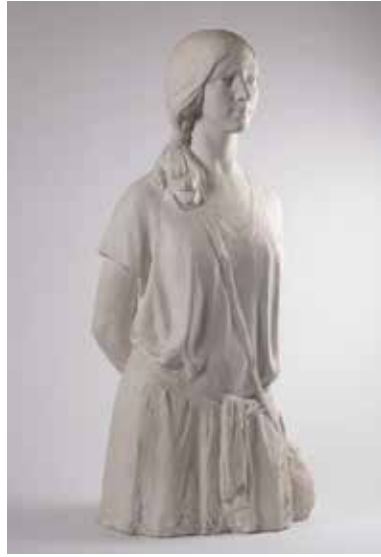
[Afb. 21] Yvonne Serruys, Yvonne Serruys, 1920, gips, ook uitvoering in Ebané (revers), 100 x 47 x 34 cm, Menen, Stedelijkmuseum, inv. 60 212 2 VI.