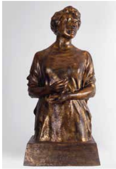
[Afb. 23] Yvonne Serruys, Zelfportret, ca. 1924, gips met bronskleurige patina, 100 x 55 x 44 cm, Menen, Stedelijkmuseum, inv. 60 212 2 XXXI.