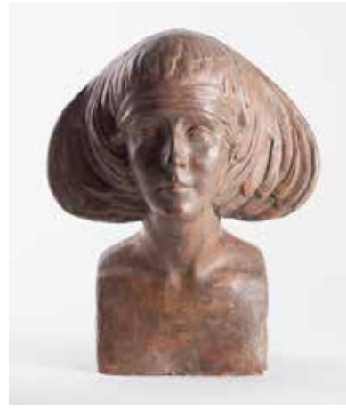
[Afb. 22] Yvonne Serruys, Man Paul Pellier, 1920, gips, 44 x 27 x 23 cm, Menen, Stedelijkmuseum, inv. 60 212 2 XXXI. Overeenkomstig in Paris, Musée de la Ville de Paris.