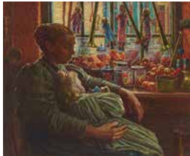
[Afb. 18] Yvonne Serruys, De groep en de familie van Menen (Menen-Jules) (revers vers), afd. 66, 1926, olieverf op doek, 60 x 70 cm, Menen, Stedelijkmuseum, inv. 6021221.