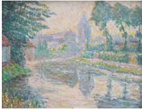
[Afb. 16] Yvonne Serruys, Licht met in de verte de Sint-Andreaskerk van Menen (Menen-Jules) (revers vers), afd. 66, 1925, olieverf op doek, 38 x 27,5 cm, Privécollectie (Vlaing Beach, Curacao, 30 april 2024).