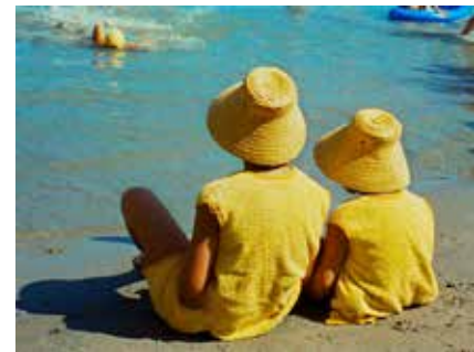
Du côté de la Côte, 1958