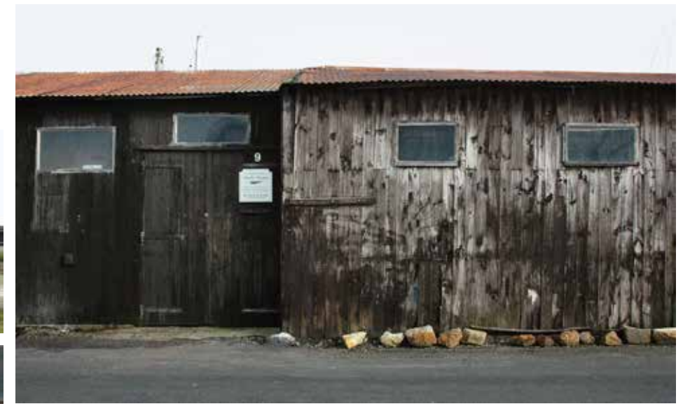
Cabanes de Noirmoutier, 2005-2006