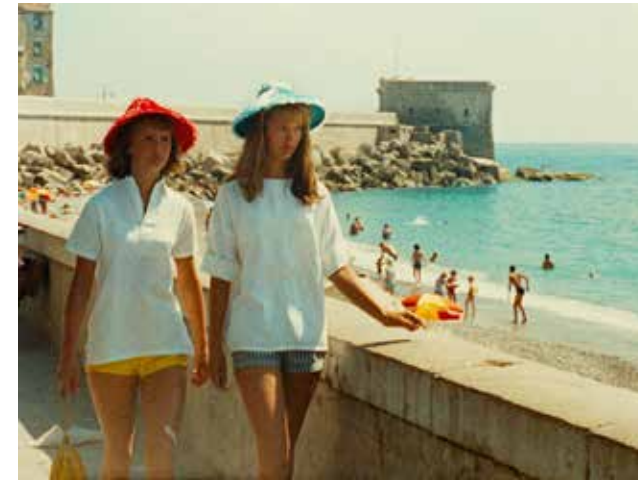
Du côté de la Côte, 1958