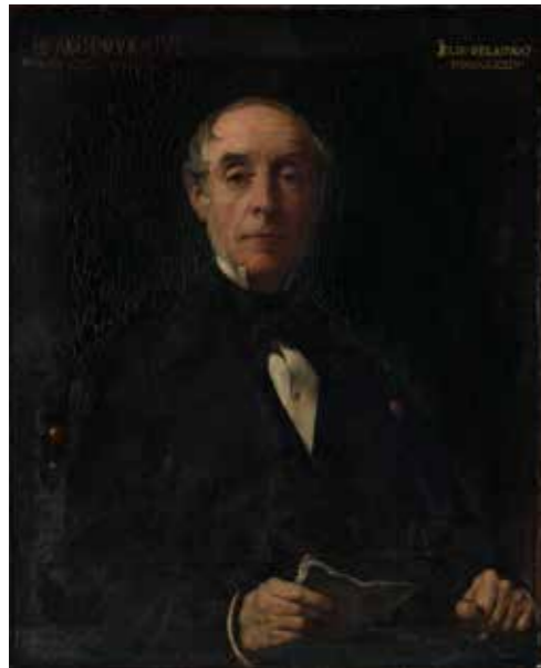
cat. 91 Élie Delaunay, Ernest Legouvé , 1874