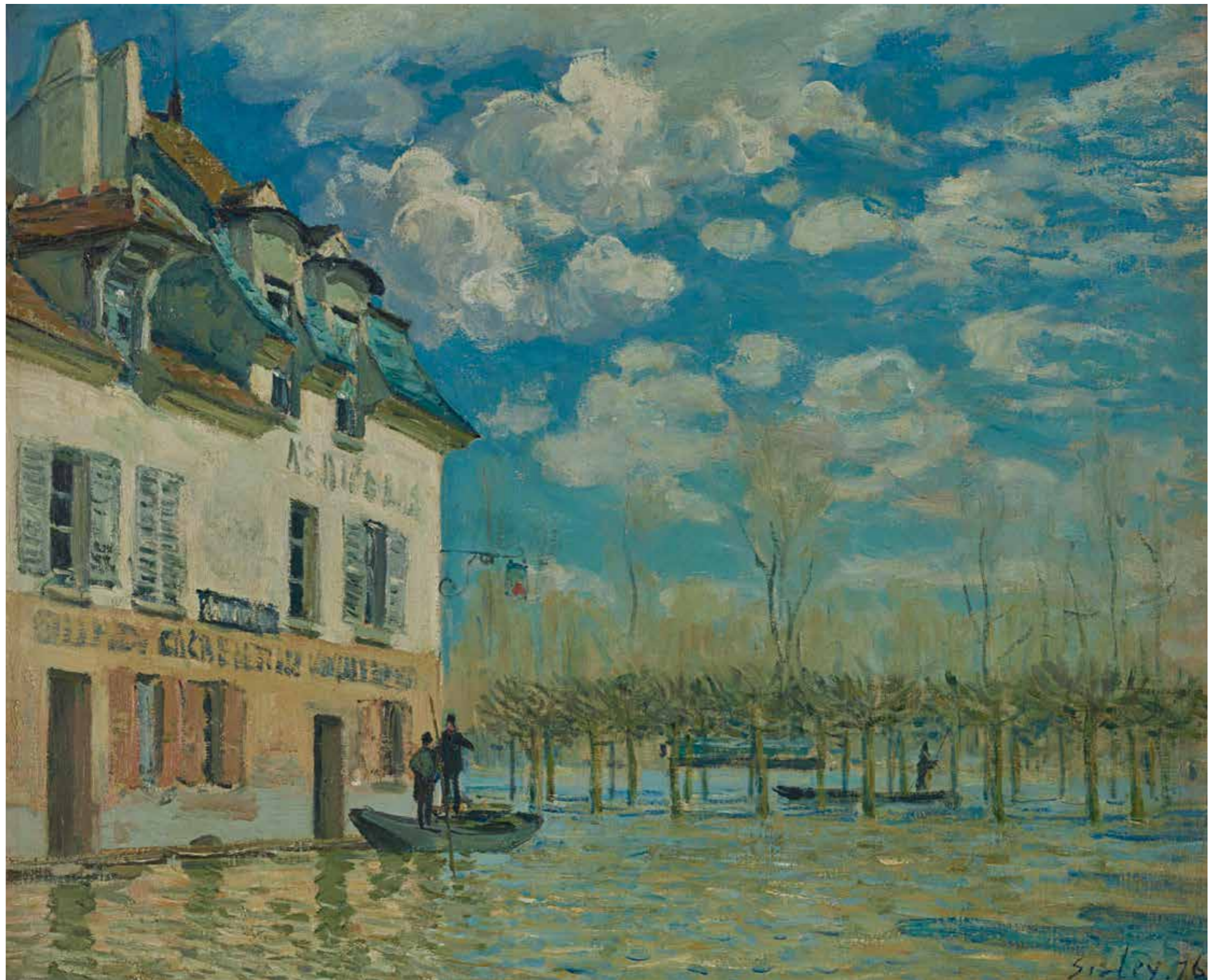
cat. 135 Alfred Sisley, La Barque pendant l'inondation, Port-Marly , 1876