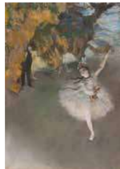
fig. 14 Edgar Degas, L'Étoile , vers 1876, pastel sur monotype, 58,4 × 42 cm, Paris, musée d'Orsay, RF 12258 recto