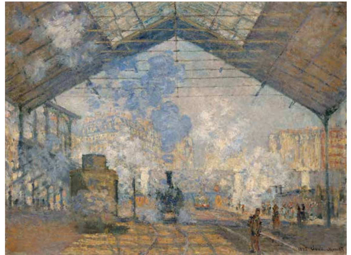
cat. 111 Claude Monet, La Gare Saint-Lazare , 1877