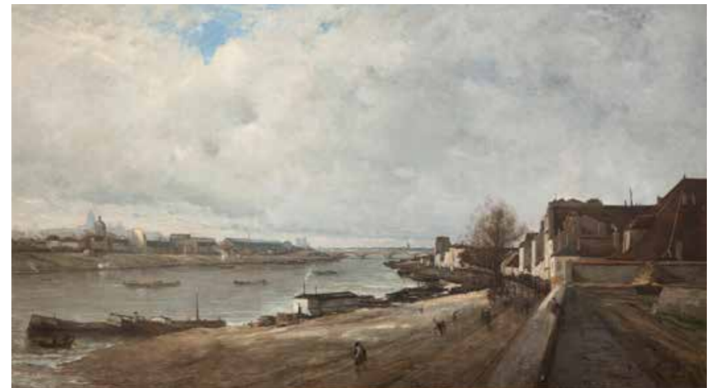
cat. 94 Antoine Guillemet, Bercy en décembre , 1874