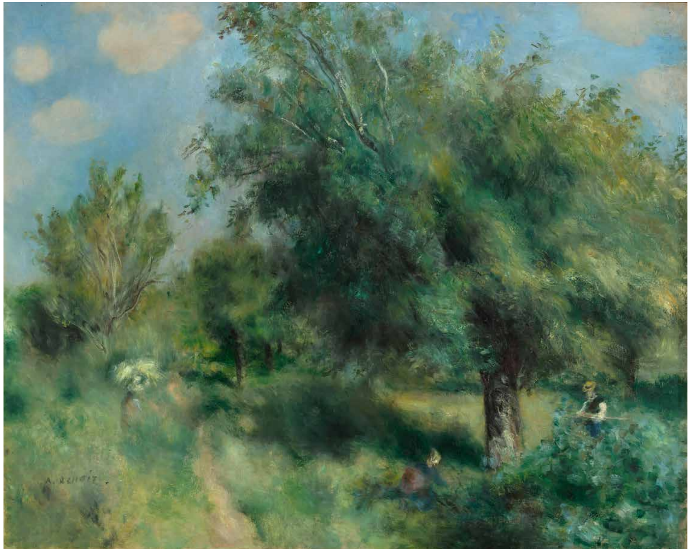
cat. 79 Pierre-Auguste Renoir, Le Poirier d'Angleterre , vers 1873