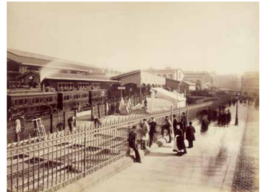
cat. 125 Louis-Émile Durandelle, Gare Saint-Lazare : groupe d'Auteuil et rue de Rome , 1885