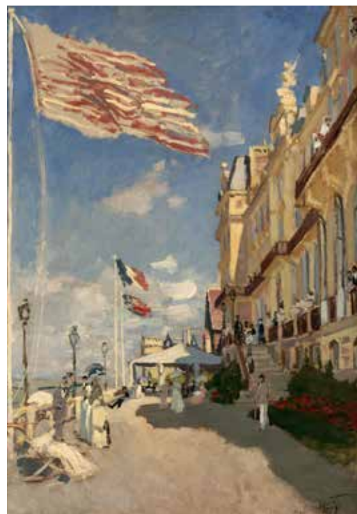
cat. 49 Claude Monet, Hôtel des Roches noires, Trouville, 1870