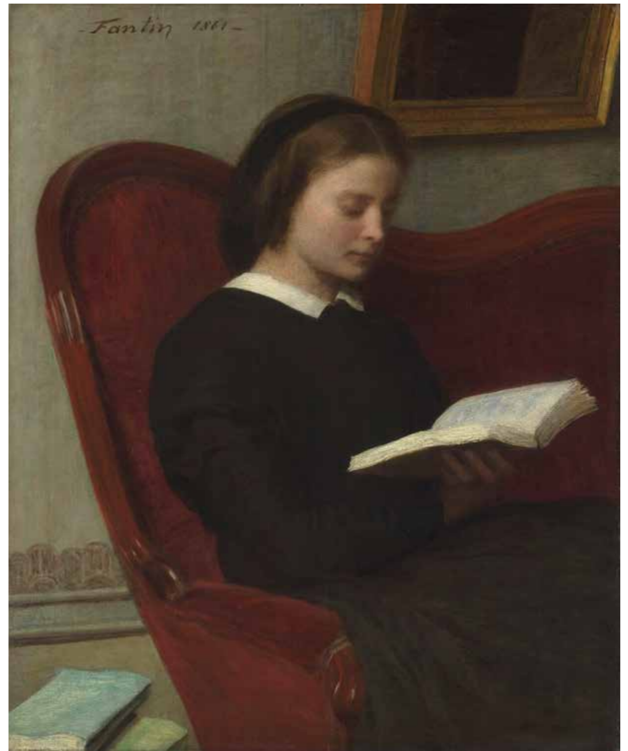
cat. 19 Henri Fantin-Latour, La Lisette , 1861