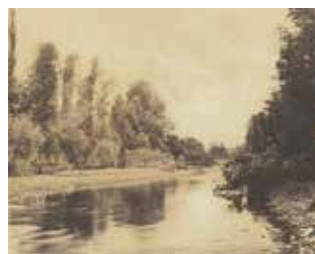
cat. 51 André Cassin, Vue de rivière (Seine-et-Oise ?), vers 1853