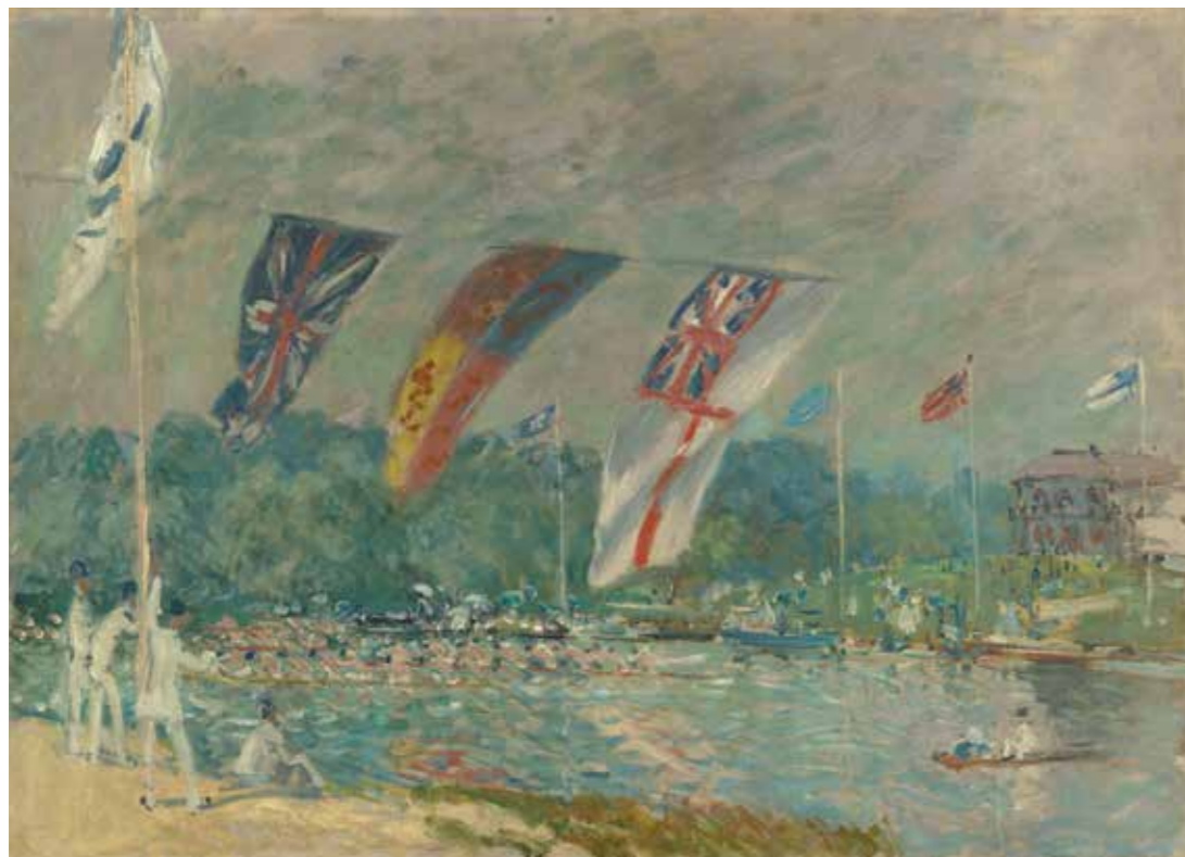
cat. 115 Alfred Sisley, Les Régates à Molesey , 1874