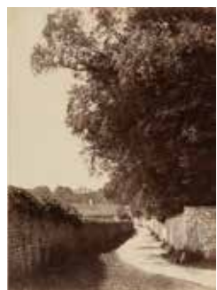
cat. 47 Eugène Carrière, Route de campagne, sections de Barbizon, vers 1862