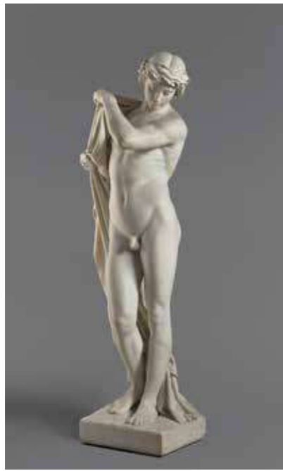
cat. 92 Paul Dubois, Narcisse , 1867