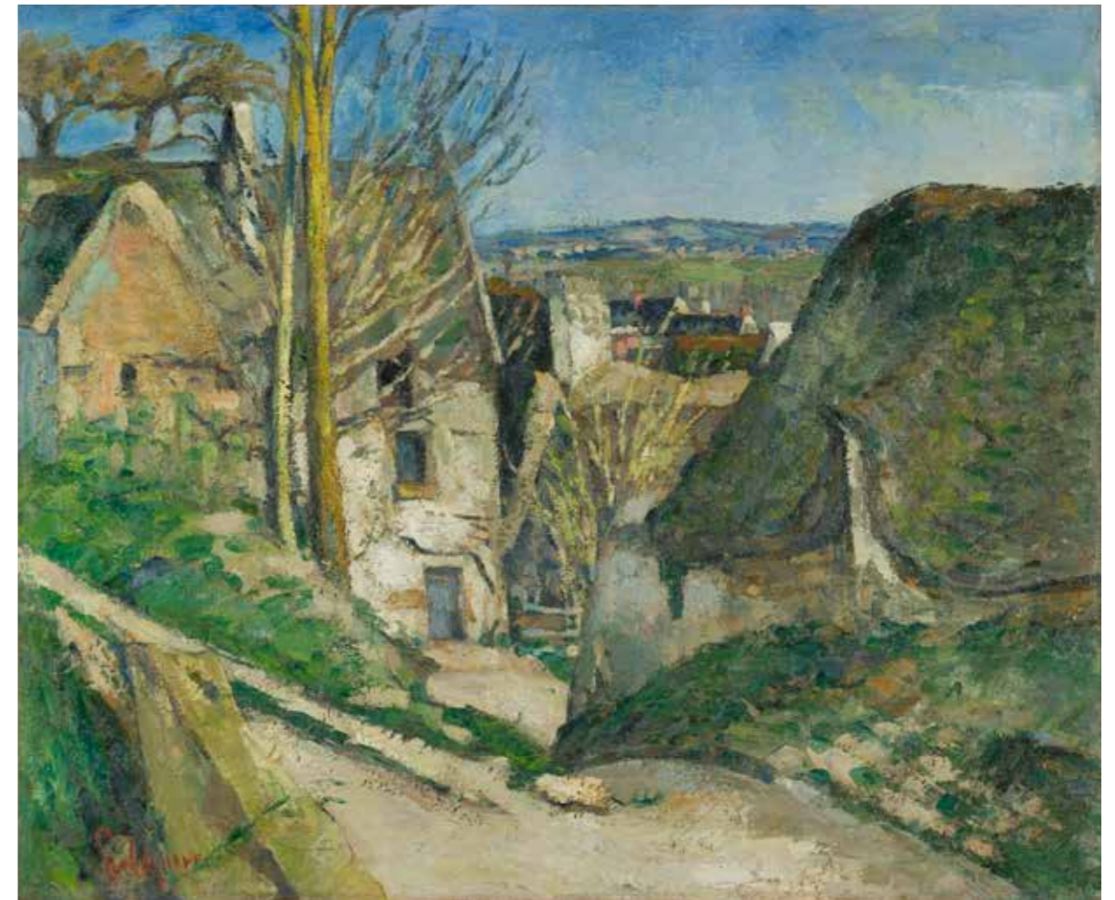
cat. 97 Paul Cézanne, La Maison du pendu , Auvers-sur-Oise, 1873