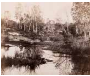
cat. 48 Eugène Carrière, Esquisse de Fromental, forêt de Fontainebleau, vers 1863