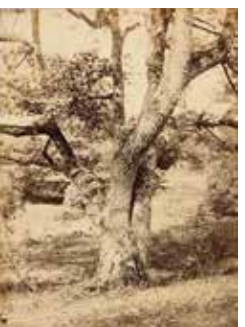
cat. 50 Constant Alexandre Famin, Arbres à Fontainebleau, vers 1870