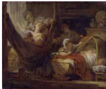
fig. 12 Jean-Honoré Fragonard (1732-1806), Le Berceau , vers 1760-1765, huile sur toile, 46 × 55 cm, Amiens, musée de Picardie, inv. M.P. Lav.1894.143.