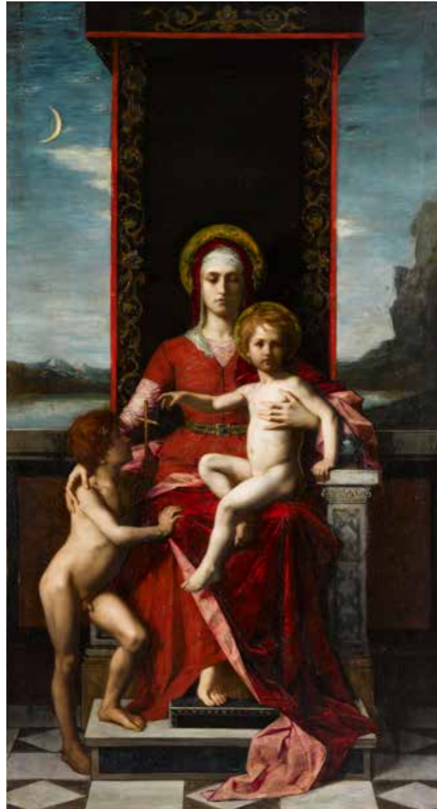
cat. 95 Ferdinand Humbert, La Vierge, l'Enfant Jésus et saint Jean-Baptiste , vers 1874