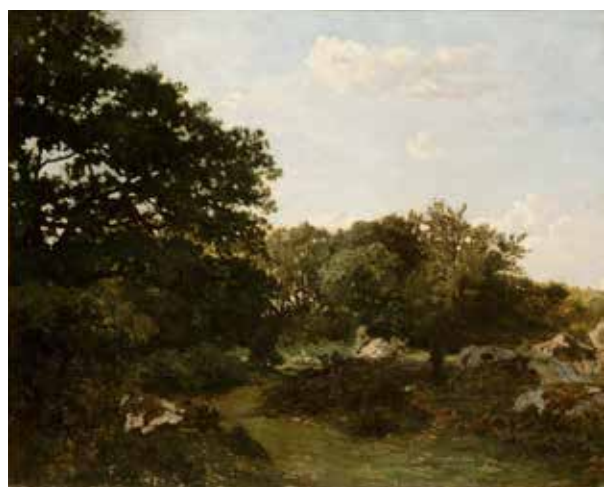
cat. 39 Fridéric Baillie, Forêt de Fontainebleau, 1865