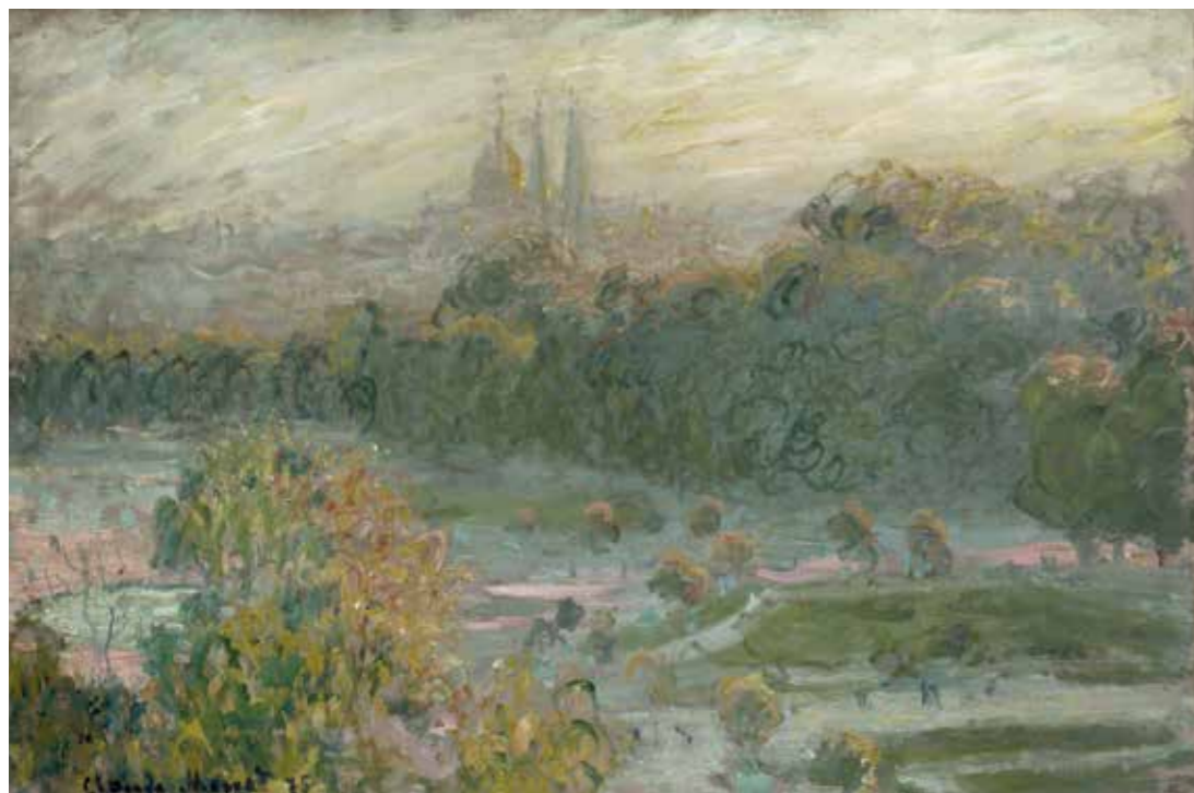
cat. 110 Claude Monet, Les Tuileries , vers 1876