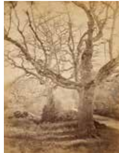
cat. 49 Constant Alexandre Famin, Arbres à Fontainebleau, vers 1870