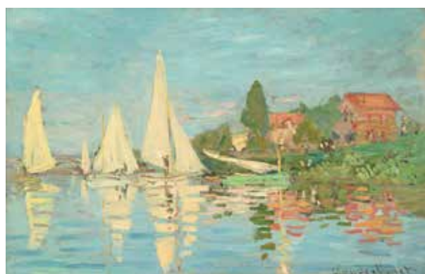
cat. 109 Claude Monet, Régate à Argenteuil, vers 1872