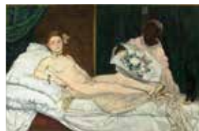
fig. 5 Edouard Manet, Olympia, 1865, huile sur toile, 130,5 x 191 cm. Paris, musée d'Orsay, RF 644