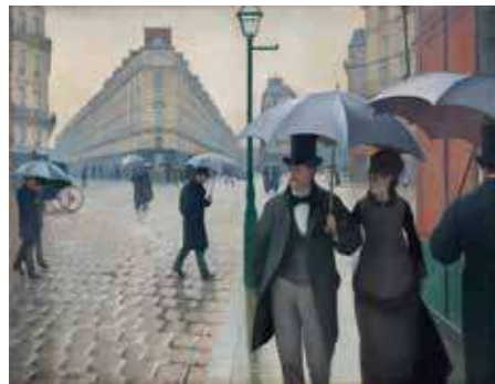
fig. 15 Gustave Caillebotte (1848-1894), Rue de Paris ; temps de pluie , 1877, huile sur toile, 212,2 × 276,2 cm, Chicago, Art Institute of Chicago, 1964.336