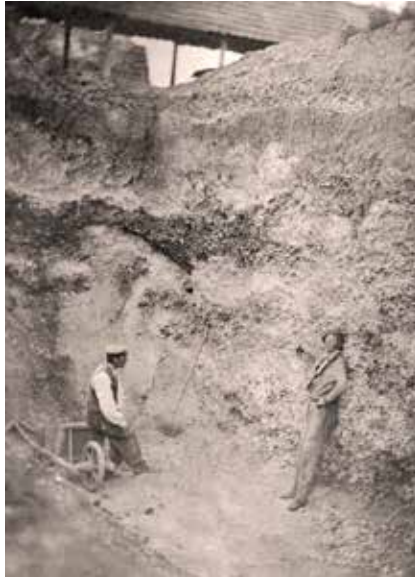
1. Prénom Pinsard, « La première hache trouvée à St Acheul : L'ouvrier montre du doigt la hache engagée dans la masse de cailloux », Les Rues d'Amiens, notes sur l'histoire et la topographie d'Amiens, t. XLIII, cote MS_1370_E, p. 34