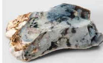
2. Éclat à dos retouché du gisement d'Étrécourt-Manancourt daté de 280 000 ans et représentatif de l'industrie lithique produite à la fin de l'Acheuléen