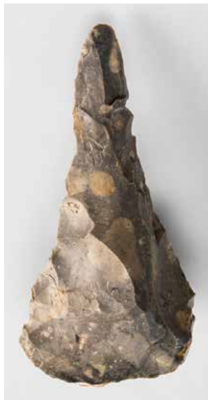
1. Biface du gisement d'Étrécourt-Manancourt daté de 280 000 ans et représentatif de l'industrie lithique produite à la fin de l'Acheuléen

À côté des outils issus du façonnage, d'autres outils lithiques sont produits par débitage. Ce mode de taille revient à fractionner la matière pour obtenir des supports, ici des éclats de silex (fig. 2 et 3). Ces éclats sont alors utilisés bruts ou retouchés sur