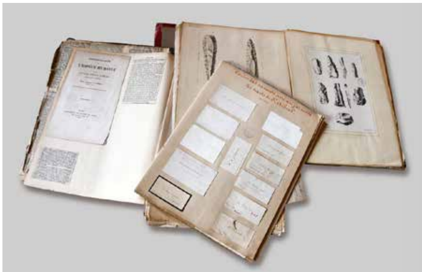
1. Société des Antiquaires de Picardie, volumes du legs Pinsard CCLV, CCLVII et CCLVIII

des événements scientifiques en cours : il garde la trace des échanges de la presse scientifique sur la Préhistoire dans un grand cahier rempli d'articles de journaux, véritable fenêtre sur les débats de son temps 9 (fig. 1).