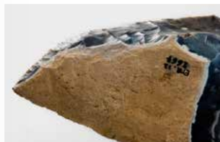
3. Éclat cortical retouché en racloir simple convexe par plusieurs rangs de retouches étagées finement réalisées, gisement d'Étrécourt-Manancourt daté de 300 000 ans