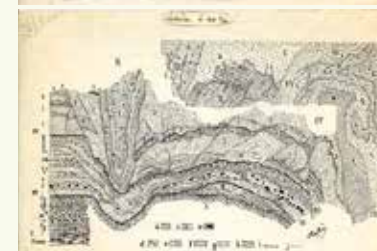
2. Coupes de la Carrière Carpentier à Abbeville réalisées par Léon Aufrère (archives Marie-Françoise Aufrère)

et Cagny-la-Garenne à Amiens. Après la Seconde Guerre mondiale, il reprend sa tâche patrimoniale, continue de dépouiller les archives et les sources de la préhistoire en Picardie au XIX e siècle et joue un rôle majeur dans la reconstruction du musée Boucher-de-Perthes (1954).