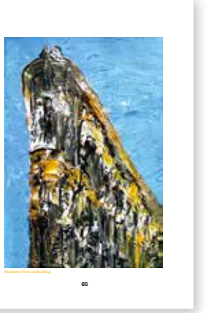
Flat Iron Building

In de vroege ochtend ergens in september 2012 om vijf uurocht thuiskomt in de Big Apple. Het is een van die momenten die je nooit vergeet.