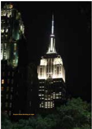
Empire State Building at night

De stad is een plek waar je altijd wilt zijn, want het is een plek waar je altijd wilt zijn. Het is een plek waar je altijd wilt zijn.