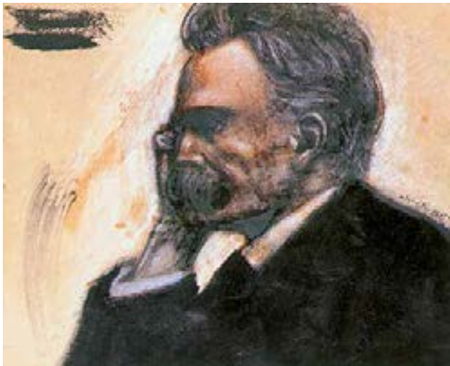
Afb. 33 Friedrich Nietzsche , 1900. Houtskool, gewassen Oost-Indische inkt, penseel, olieverf, pastel en gouache op bruin papier, 23,6 × 28 cm. Privéverzameling