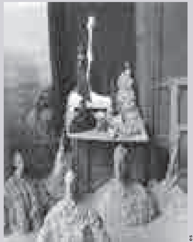
CAT. XX ALBERTO GIACOMETTI Titre de l'oeuvre date