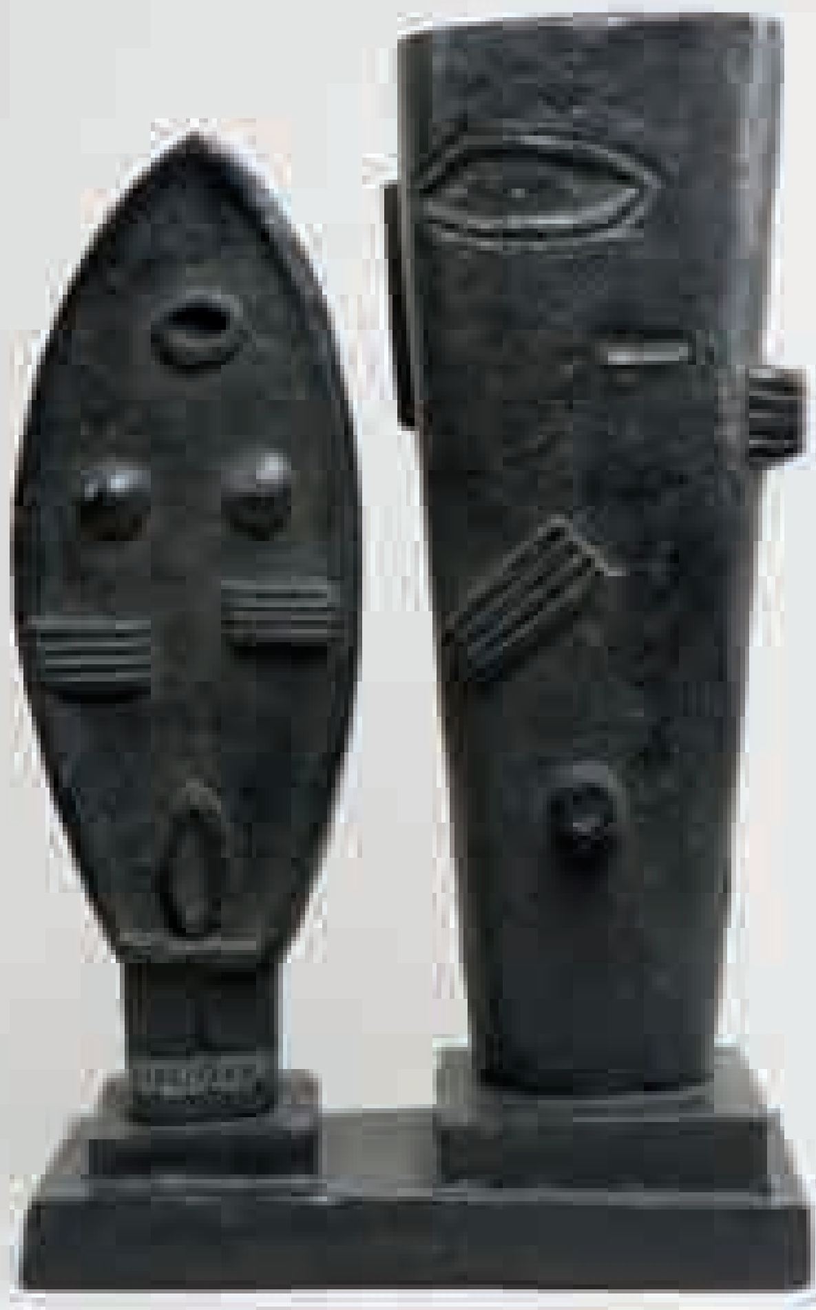
CAT. XX ALBERTO GIACOMETTI Titre de l'œuvre date