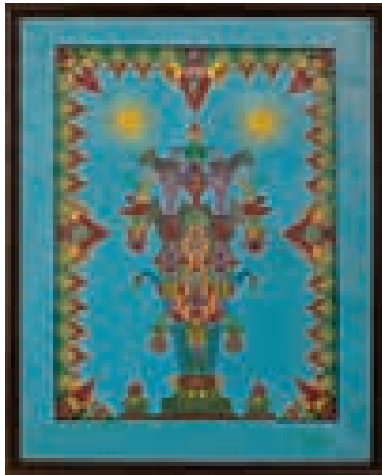
Fleury Joseph Crépin Tableau merveilleux n° 35, 5 août 1948, huile sur toile 58 × 81 cm, donation L'Aracine en 1999, LaM - Inv. : 999.12.1