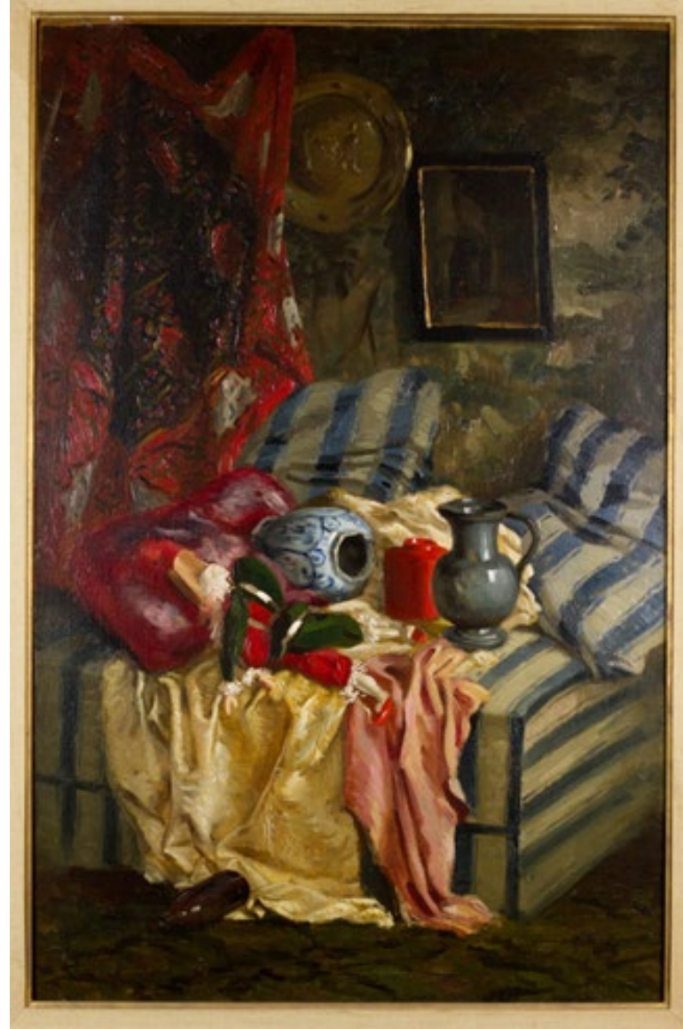
Thevenet & De Braekeleer