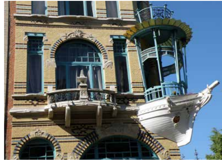
Erker in de vorm van een scheepshoek, aan het huis in pure Jugendstil dat scheepsbouwer Poels in 1901 liet bouwen in Antwerpen.