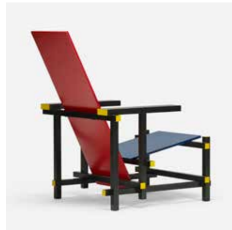
De beroemde blauwe en rode stoel van Gerrit Rietveld, ontworpen omstreeks 1920. (particuliere collectie)