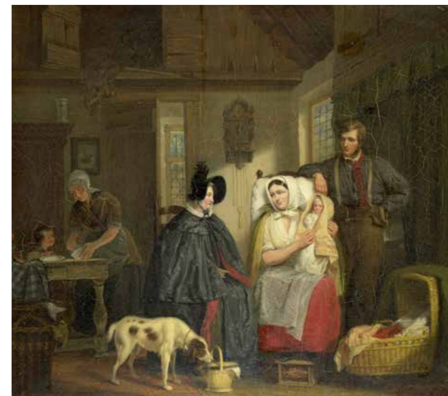
Op bezoek bij de kraamvrouw. Schilderij van Moritz Calisch, 1835. (Rijksmuseum Amsterdam)

KEY Het is bijna niet meer voor te stellen hoe allerlei uitvindingen en ontdekkingen het wonen hebben bepaald. Neem bijvoorbeeld de verwarming en de verlichting.