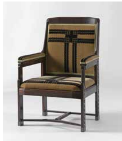
Stoel ontworpen door H.P. Berlage omstreeks 1920 in opdracht van het echtpaar Kröller-Müller voor hun jachthuis op de Veluwe. (Rijksmuseum Amsterdam)