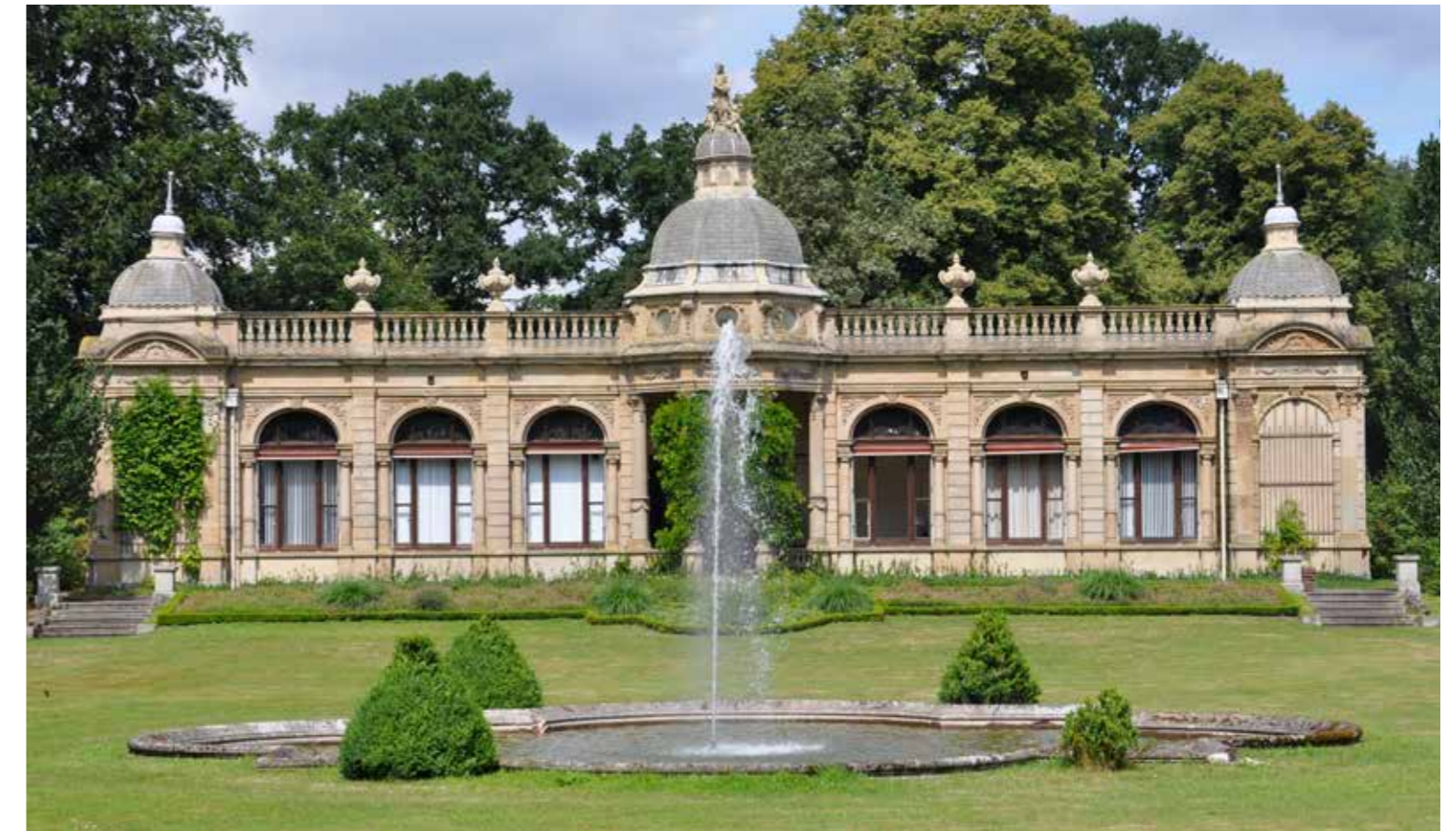
De prachtige Oranjerie, is het enige overblijfsel van het buitenhuis Hydepark in Doorn.