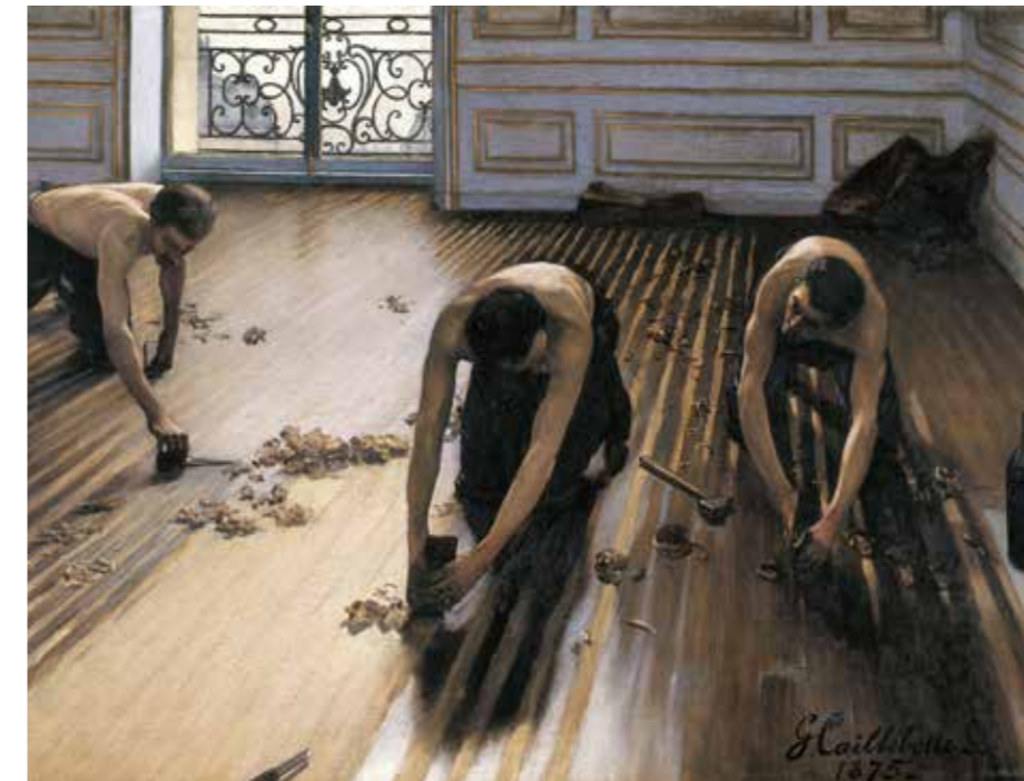
De houten vloer van de salon of mooie kamer vergt veel onderhoud, dat gebeurde in het verleden met de hand. Men kroop over de vloer met een stuk puimsteen en een lap boenwas of schraapte oude lak van het parket, zoals zo mooi te zien is op dit schilderij van Gustave Caillebotte uit 1875. (Musée d'Orsay, Parijs)