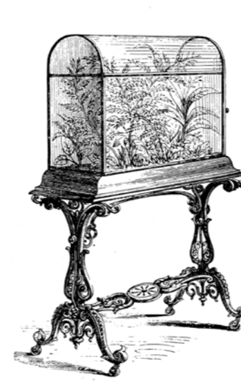
Een Victoriaans voorbeeld van een zogenaamde Wardse kas. In de afgesloten ruimte onder het glas vormt zich een soort microklimaat waarin planten kunnen gedijen, bijvoorbeeld tijdens een lange reis.

haar buiten Vijverhof in Nieuwersluis. Het probleem was om de tropische planten 's winters over te houden. Voor de oranjeboompjes en andere tropische gewassen werden daarom gebouwtjes neergezet met grote ramen en kachels die konden worden gestookt met hout of kolen om de vorst buiten te houden. Zo'n gebouwtje werd een oranjerie genoemd, naar de oranjeboompjes.