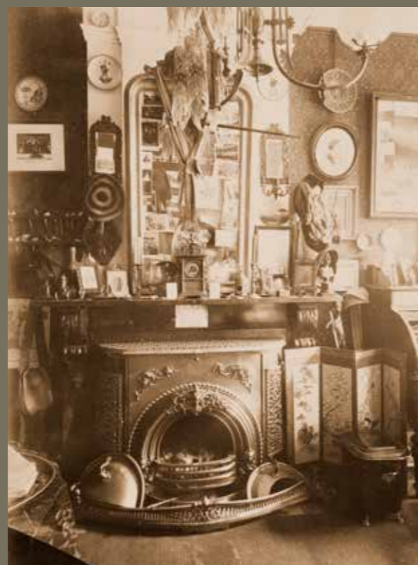
Een huiskamer op een foto uit 1889.