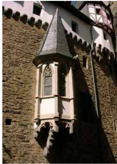
Een erker aan de muur van Burg Eltz in Münstermaifeld. (Duitsland)