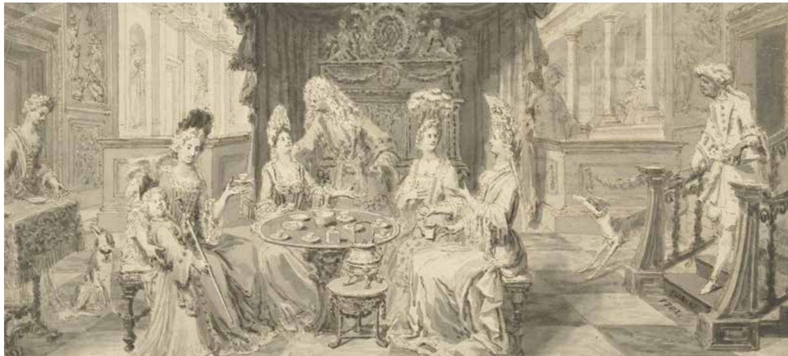
Philip Tidemann tekende aan het eind van de 17 de eeuw een theedrinkend gezelschap in een salon of sael. Waarschijnlijk was het een ontwerp voor een kamerscherm. (Rijksmuseum Amsterdam)