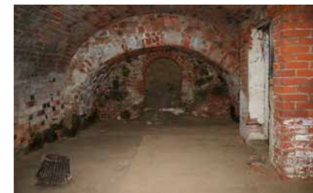
Kelder van een eeuwenoud huis.

Een kelder onder het maaiveld was het meest ideaal. In de zomer bleef de ruimte koel en in de winter zou het er niet snel vriezen. In de drassige veengrond in het westen van het land was het moeilijk om een diepe kelder te bouwen. De kelder kwam dan hoger met als gevolg dat de ruimte erboven ook hoger lag en dus een lager plafond had. Zo'n 'opkamer' was via een trapje te bereiken. Het voordeel was dat er in een kelder die boven het maaiveld uitstak, een mogelijkheid was om ramen of luiken naar buiten aan te brengen. In de binnenstad van Middelburg zie je nog overal kelderluiken aan de huizen. In veel panden uit de 17de en 18de eeuw strekken de, deels onder de grond gebouwde kelders zich uit onder het gehele huis en bevatten dan vaak een (extra) keuken en ruimten voor het personeel met een eigen toegang naar de straat. Men spreekt dan van een souterrain. Daarboven is dan de 'beletage', te bereiken via een trap langs de voorgevel. Ook als de kelder niet te diep lag, was er altijd de dreiging van grondwater. Om dat tegen te gaan, werd de vloer belegd met plavuizen, die werden ingewassen met kalkspecie. Ook de wanden werden vaak betegeld. In sommige huizen werd in de strijd tegen het vocht een 'drijvende' kelder gemaakt. Een grote gemetselde bak, die vrij staat van de wanden en als het ware drijft op het grondwater. In het Edams Museum is zo'n drijvende kelder te zien.