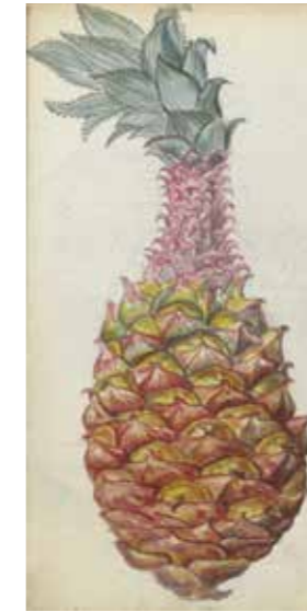
De grootste wens van 17de-eeuwse plantenkwekers was een ananas tot wasdom te brengen. Tekening uit 1785 van Jan Brandes.