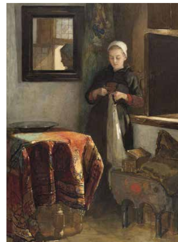
Een jonge vrouw in een kamer in Hindelopen, geschilderd door Christoffel Bisschop. (Rijksmuseum Amsterdam)