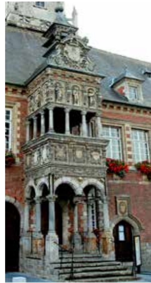
De loggia aan het voormalige paleis van Maria van Hongarije in Hesdin. (Frankrijk)