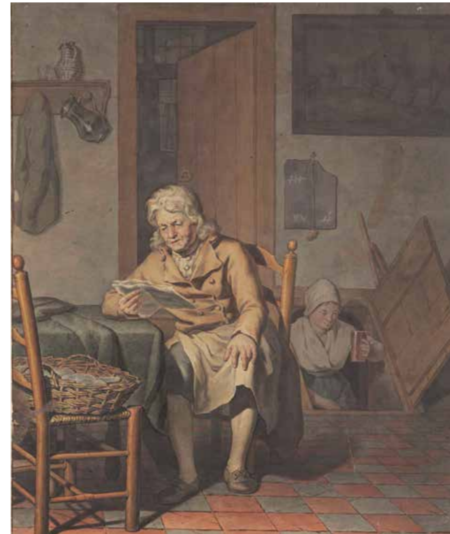
Een man leest de krant, een vrouw komt uit de kelder met een kan fris bier. Pentekening van Pieter Chr. Wonder. (Rijksmuseum Amsterdam)