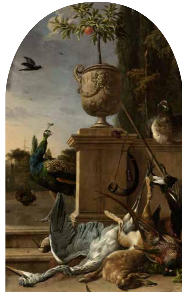
Een schilderij van Melchior d'Hondecoeter uit ca. 1678 met een jachtbuit en een oranjeboompje. (Rijksmuseum Amsterdam)

In de 17 de eeuw raakte het in de mode om exotische planten te bezitten. Eigenaren van buitenhuizen hadden veel geld over voor planten, zaden en pitten, die zeelui meenamen uit exotische oorden. Ze kochten ook sinaasappelboompjes, of zoals men toen zei: Oranjeboompjes. En verder citroenen, dadels en bananen. Het summum was het om een ananas in je tuin te hebben. De eerste ananassen werden uit Zuid-Amerika meegenomen door Spanjaarden, die er de naam 'depiña' aan gaven, omdat de vrucht aan een dennenappel (piña) deed denken. De Nederlanders namen de Indiaanse naam anana over, dat betekent 'goed fruit'. De rijke koopmansweduwe Agnes Block, was volgens zeggen, de eerste tuinliefhebber in Nederland die erin slaagde om ananas te kweken, op