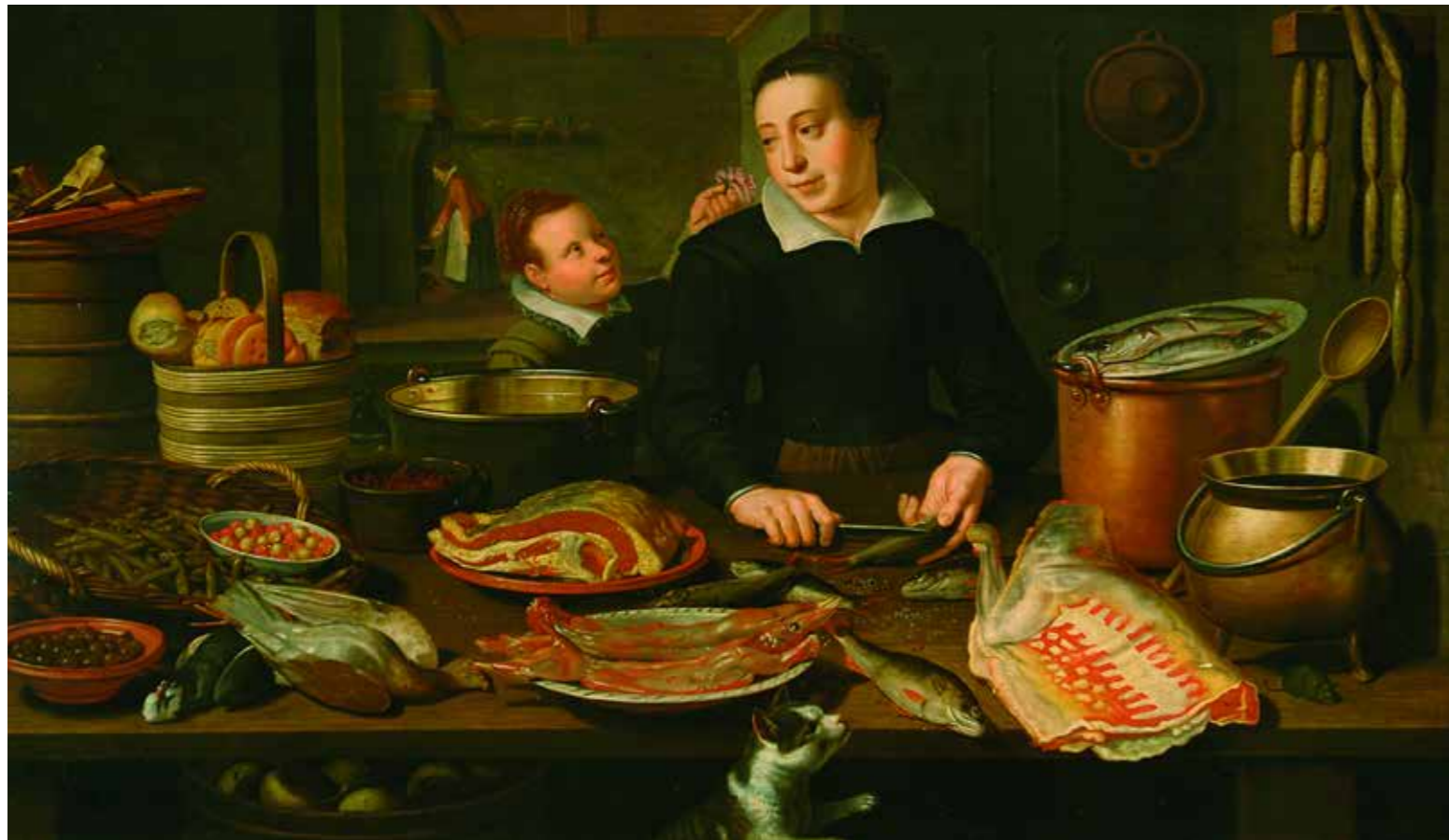
Voedsel conserveren was een grote zorg. Schilderij van Floris van Schooten, ca. 1620. (Frans Halsmuseum, Haarlem)