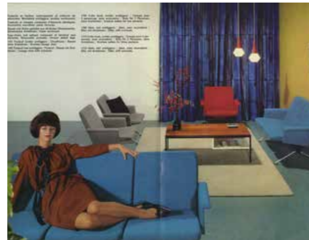
Catalogus voor de meubelen van Gispen naar ontwerp van André Cordemeijer. (Museum Boymans van Beuningen)

gebogen stroken werden vervolgens op gelijke maat gezaagd en gelamineerd, dat wil zeggen: gebundeld en gelijmd en versterkt met een metalen strip. Het lukte Thonet nog niet meteen om een flink bedrijf op te zetten. Zijn patentaanvraag in Berlijn werd afgewezen. Men vond de techniek niet vernieuwend genoeg. Maar toen viel het geluk hem in de schoot. Bij de presentatie op een beurs, wandelde prins Metternich rond, de kanselier van Oostenrijk-Hongarije. Hij had grote belangstelling voor de meubelen van Thonet en nodigde hem uit om naar Wenen te komen. Na enige aarzeling liet Thonet zich overhalen om een oriëntatieris te maken. Tijdens zijn verblijf in Wenen kreeg zijn vrouw bezoek van schuldeisers, die dreigden om alle bezittingen in beslag te nemen. Dat gaf de doorslag. Het gezin Thonet verliet Boppard en vestigde zich in Wenen. Na de eerste leveranties, aan voornamelijk adellijke families die de elegante lichte stoelen kochten voor hun buitenverblijven, kreeg Thonet een flinke bestelling van het befaamde koffiehuis Daum, dat het interieur wilde oprispen en lichte makkelijke stoelen zocht. Het was het begin van een zegetocht van stoelen voor huishoudens en cafés over de hele wereld. Er kwamen ontwerpen voor schommelstoelen, kinderstoelen en ligstoelen, maar de eenvoudige caféstoel bleef het meest populair.