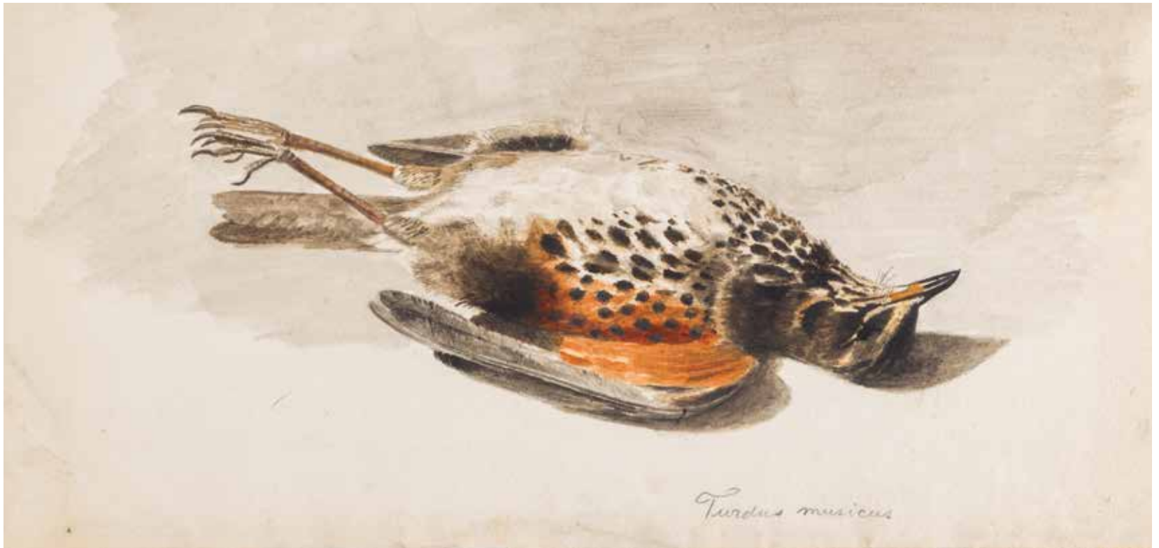
Dode Turdus Musicus , ongedateerd, waterverf op papier, 13,5 x 28 cm, Drents Museum (langdurig bruikleen Gemeente Hoogeveen)

> Zonder titel [grijze gar- naal] , ongedateerd, wa- terverf op papier, 17,5 x 21,8 cm, Drents Museum (langdurig bruikleen Gemeente Hoogeveen)