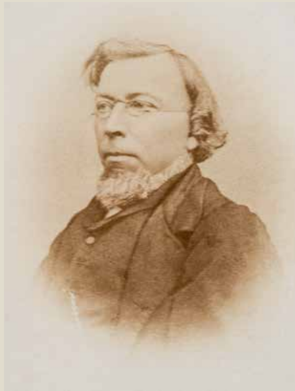
Een foto van Steenbergen, omstreeks 1865

andere bezigheden dan het aanheffen van dezelfde lofzang, begeleid door hetzelfde instrument... Ook de meest godbegerige zal dan er op den duur van walgen en niet kunnen nalaten met heimwee terug te denken aan het aardse leven, vol van zorgen en ellende dikwijls, maar dat men wist kort te zijn en dat tot afwisseling en rust had: de nacht!