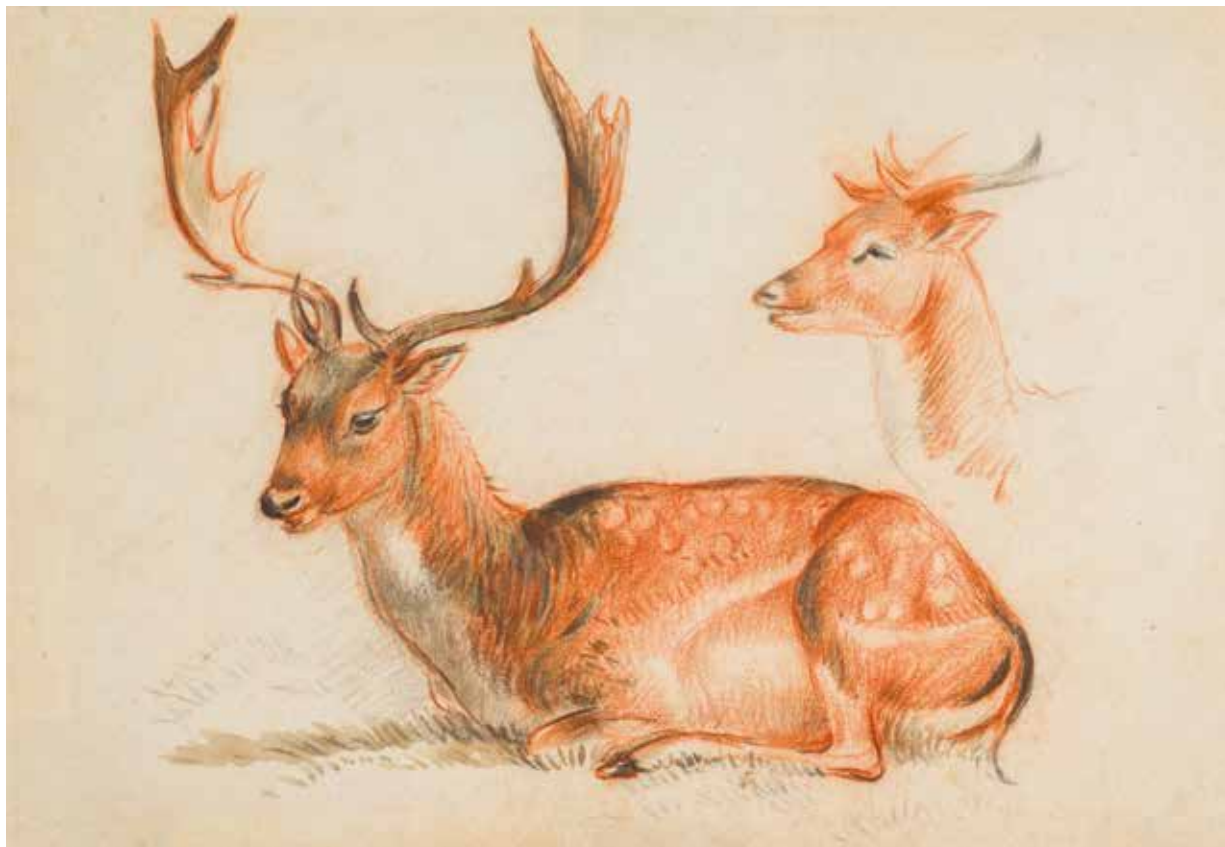
Liggend edelhert en de kop van een hinde, ongedateerd, potlood op papier, 17,5 x 21,8 cm, Drents Museum (langdurig bruikleen Gemeente Hoogeveen)

nen van Teylers Museum en het Wereldmuseum. We zijn verguld dat we deze voor Drenthe zo belangrijke kunstenaar en schrijver nu in een grote tentoonstelling met publicatie centraal kunnen stellen. We hopen dat dankzij dit project de betekenis van Steenbergen voor de toekomst zowel voor onze provincie als binnen de Nederlandse kunst- en literatuurgeschiedenis is geborgd. Steenbergen verdient het om meer aandacht te krijgen. Ik wens u veel lees- en kijkplezier toe.