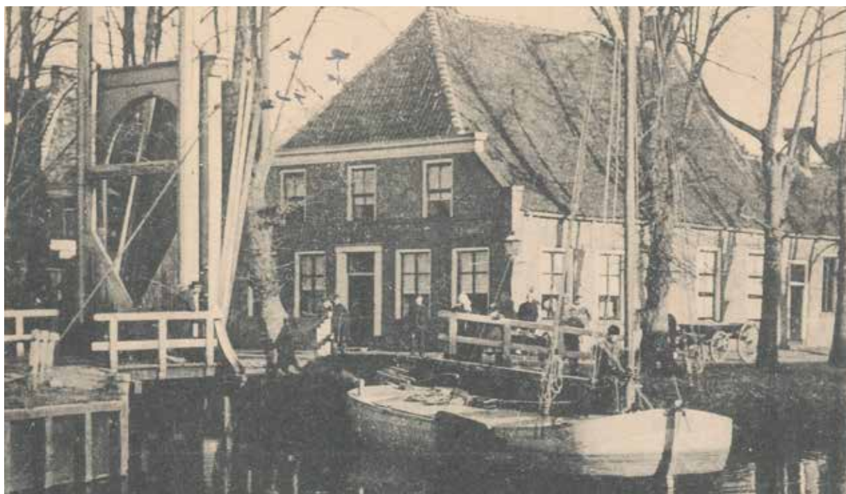
Een ansichtkaart met daarop het ouderlijk huis van Steenbergen aan 't Kruis, omstreeks 1900

officierensociëteit was ook bij hem gevestigd. Door de grote toeloop van allerlei lieden in het logement en door het dienstponeel leerde Steenbergen 'krachtige uitdrukkingen en tamelijk onverhulde toespelingen op zaken waarvan het mij beter was op zulke jeugdige leeftijd het bestaan slechts te vermoeden.' 9 Steenbergen heeft beweerd dat hij veel moeite had de lelijke hebbelikheden die hij in Coevorden had opgedaan af te leren. Het lukte hem maar ten dele, want 'een vies bijmaakje van Hollandsche conversatietoon, is mij altijd bijgebleven.' 10