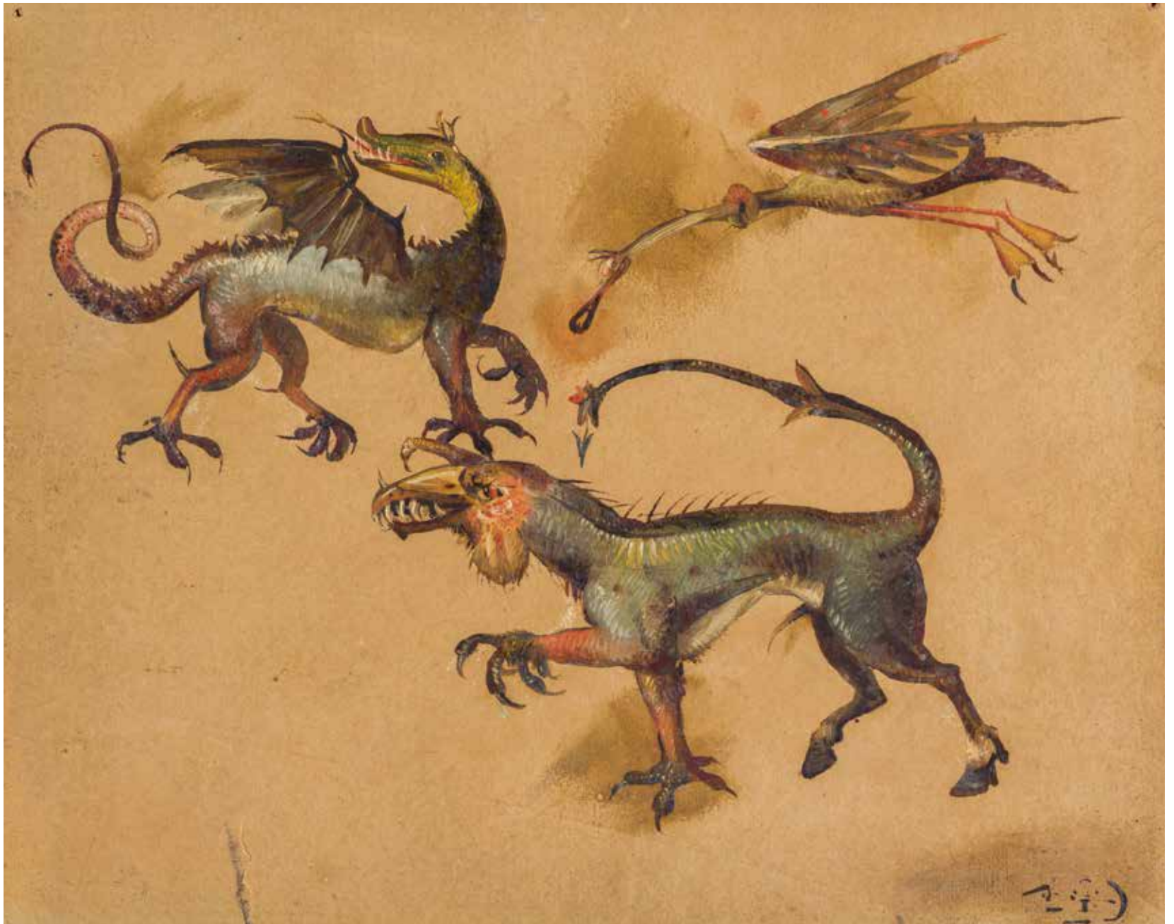
Zonder titel [fantasie- figuren], ongedateerd, gouache en waterverf op papier, 18 x 23 cm, Drents Museum (langdurig bruikleen Gemeente Hoogeveen)