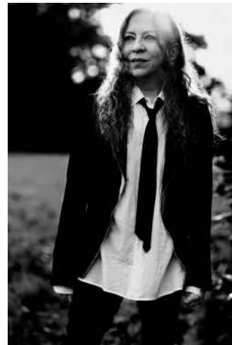
Ann Demeulemeester, Kessel, 2019