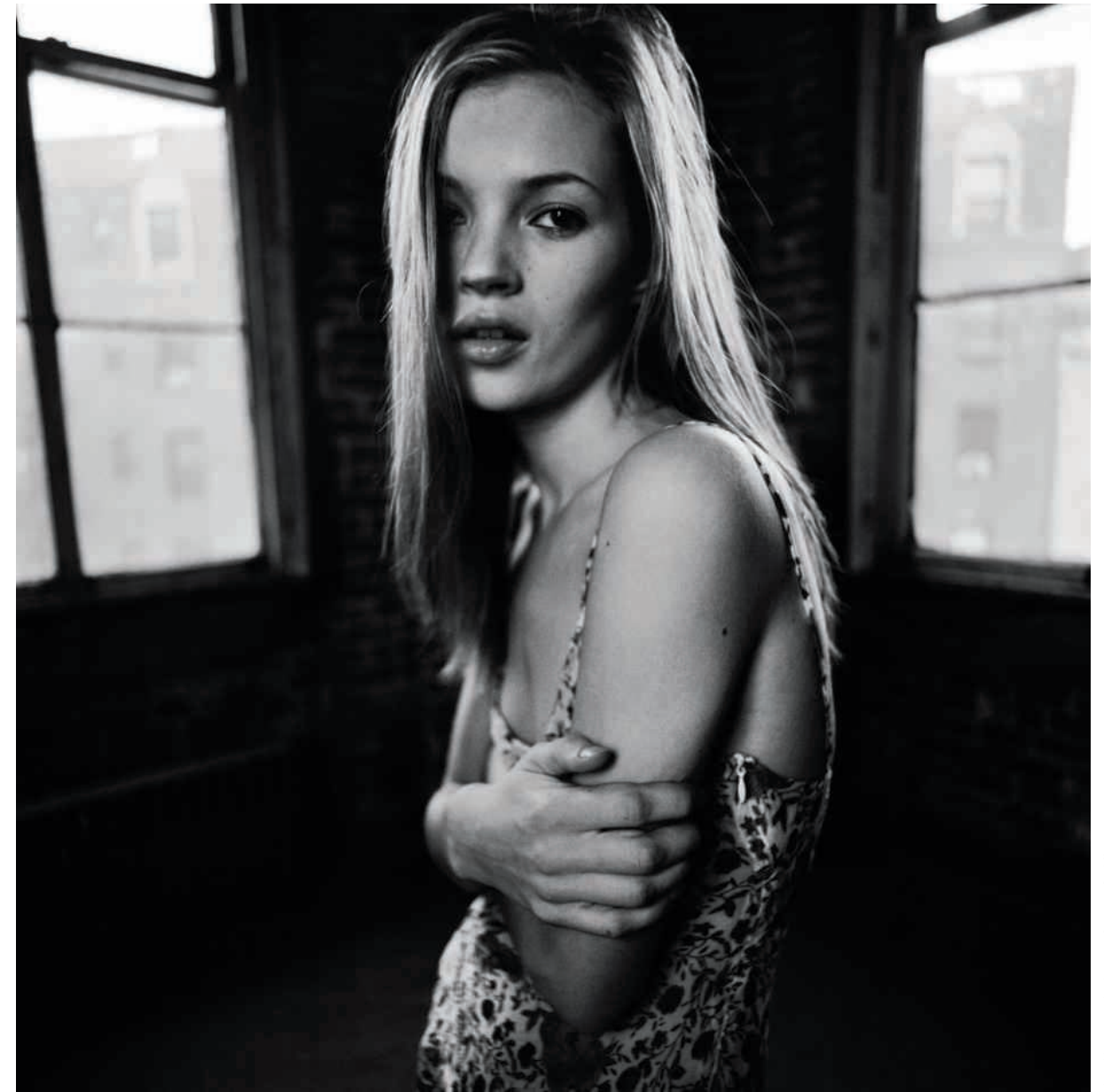
Kate Moss, New York, 1993