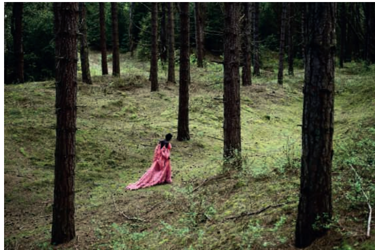
Adut Akech in Alexander McQueen, Hokkaido 2018