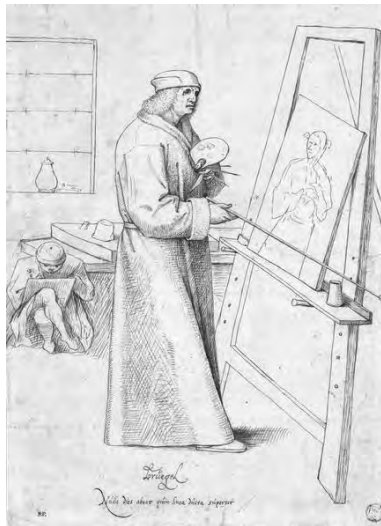
Louvre Inv. RF19723