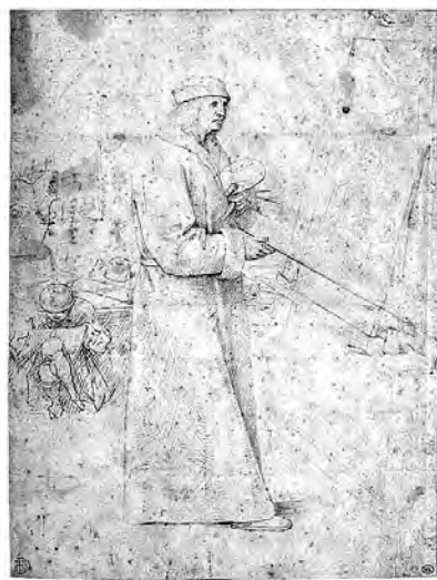
Louvre Inv. RF29478 5

Dit alles in overweging genomen menen wij de tekening De Schilder voor zijn Ezel te kunnen beschouwen als een origineel werk van Pieter Bruegel de Oude 4 . Wij denken een datering circa 1560 - 1565 te mogen voorstellen.