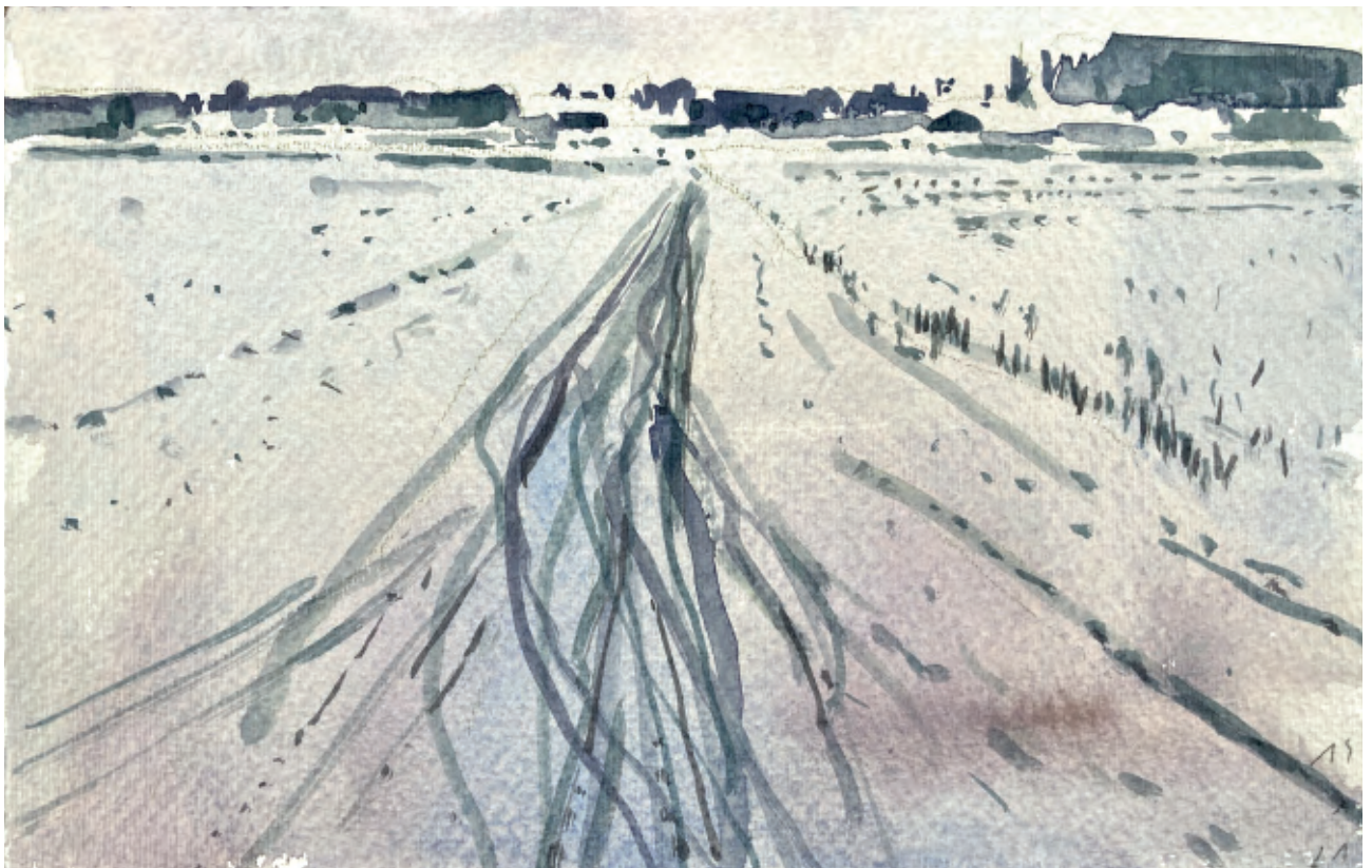
Sporen in de sneeuw , aquarel op Fabriano, 2021