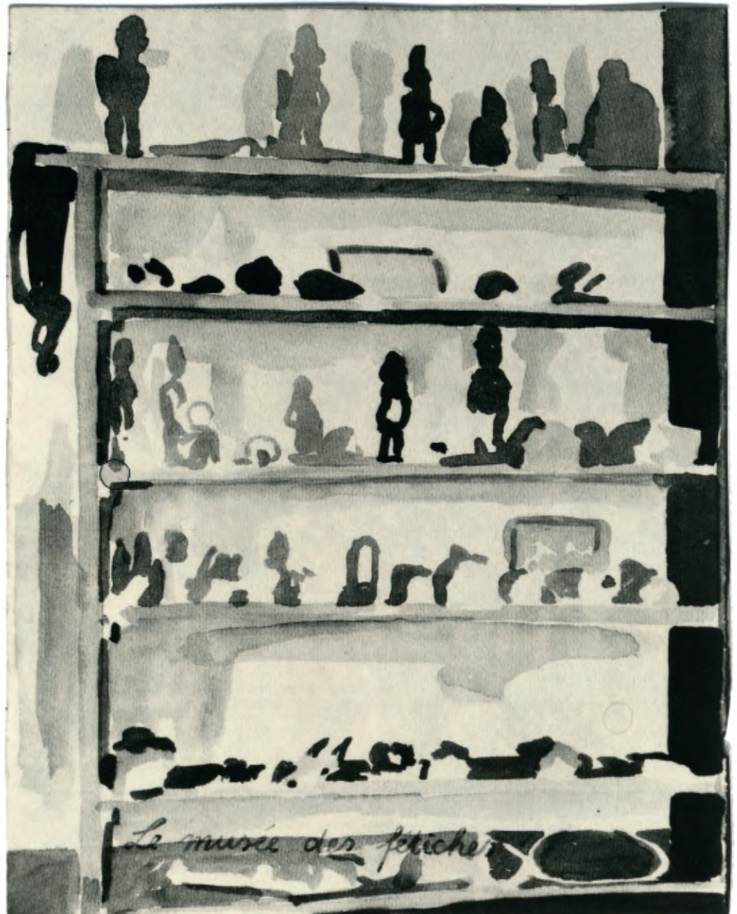
Le musée des fétiches , aquarel op papier, 1994

mensen die elkaar niet fysiek ontmoetten, via mij een boodschap aan elkaar doorgaven. De boodschap was subtiel, ontastbaar, als een galm. Het was alsof ik in die transactie een bijzonder, noodzakelijk aandeel had. Men had hiervoor zelfs geduldig op mij gewacht. Mijn hypothese was dat boodschappen zich bedienen van mensen, niet omgekeerd. Mensen zijn vehikels. Wij zijn werktuigen van een hoger, ons onbekend doel."