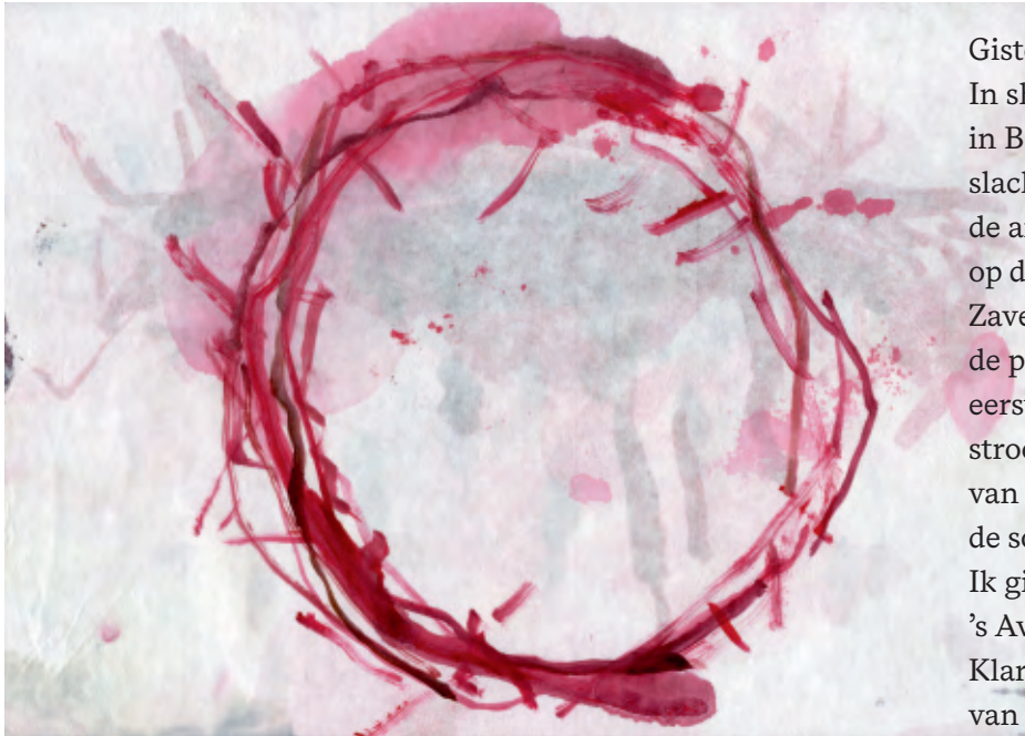
Doornenkroon , acrylverf op papier, 2009