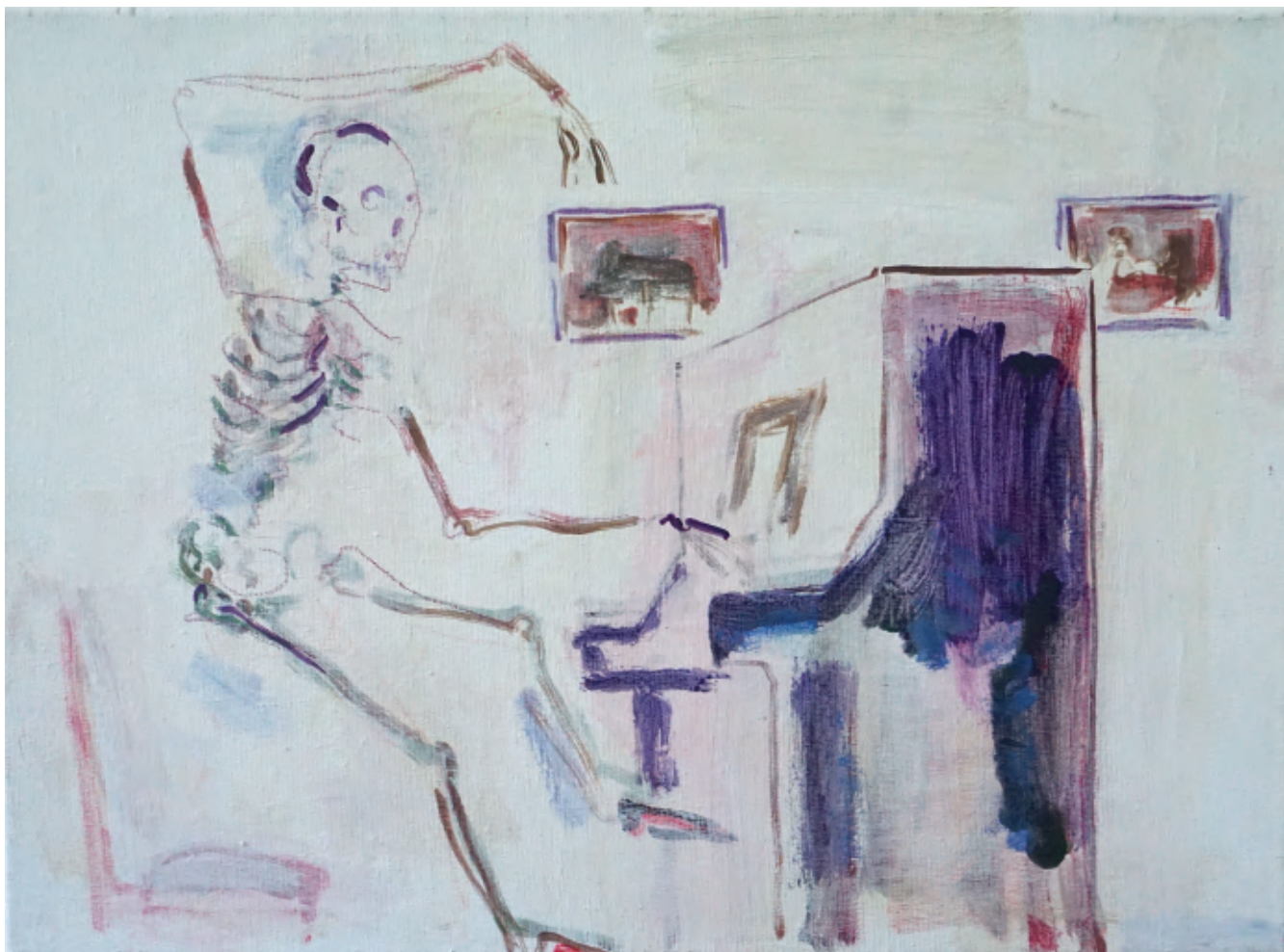
Ensor aan de piano , acrylverf op doek, 2019

“En welke wereld rammelt het meest? Onze wereld of de gespiegelde wereld?” op de gouden muur in het Ensorkabinet in de tentoonstelling OER, Wortels van Vlaanderen , Caermersklooster, Gent. Het is een citaat uit een tekst die ik schreef voor de catalogus bij het werk Squelette arrêtant masques : “Dit is de ‘ideale’ wereld, waarin skeletten maskers mogen tegenhouden, arresteren zelfs, of de overgang bepalen tussen links en rechts, de grimmige maskers en de gelukkige maskers, het leven en de dood. Het skelet heeft een kolbak of berenmuts op zijn hoofd en is een gendarme. Het masker dat wordt tegengehouden is een kwezel. Zij tracht het skelet te omhelzen, en krijgt nog een extra duwtje