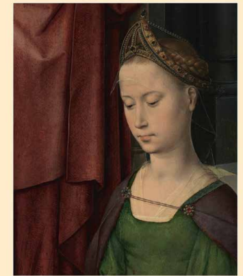
MUSEUM SINT-JANSHOSPITAAL BEZOEKERSGIDS | ELUDION

In het museum vind je dan ook de op één na grootste Memlingcollectie ter wereld met verschillende werken, die speciaal voor het Sint Janshospitaal werden gemaakt, naast hedendaagse toppers zoals Berlinde De Bruyckere of Patricia Piccinini.