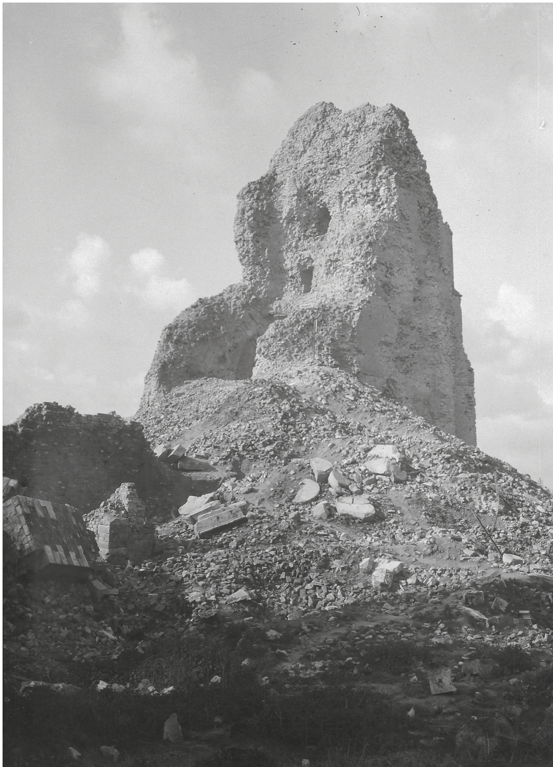
De ruïne van de toren van de kathedraal, vanuit het puin. Ieper, 25-4-1919 Links: bijschrift ontbreekt. Ieper, 25-4-1919