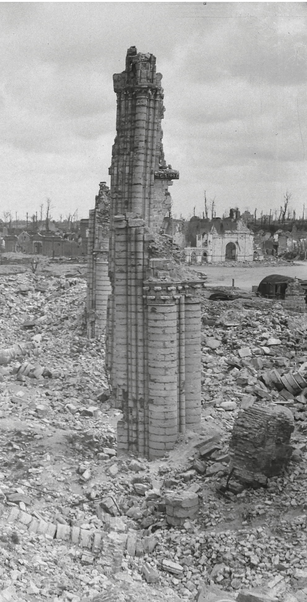
Van op de torenstomp van de kathedraal kijkend naar resten van het interieur en verder naar de muur en de voorgevel van het Onze-Lieve-Vrouwehospitaal (nu Gerechtshof) op de Grote Markt. Op de horizon de boomstompen op de vestingen. Ieper, 4-4-1919