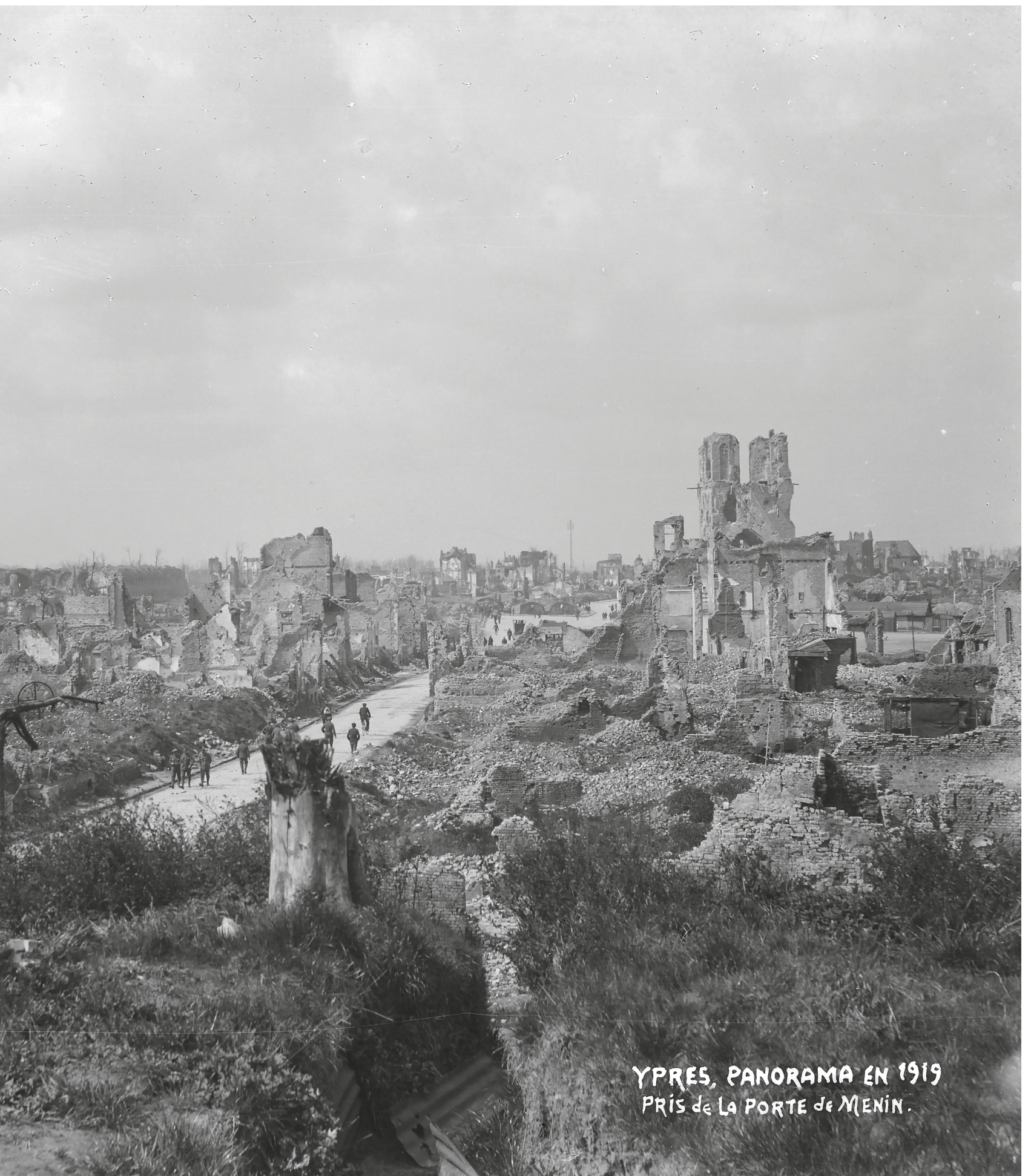
YPRES, PANORAMA EN 1919 PRIS de LA PORTE de MENIN.