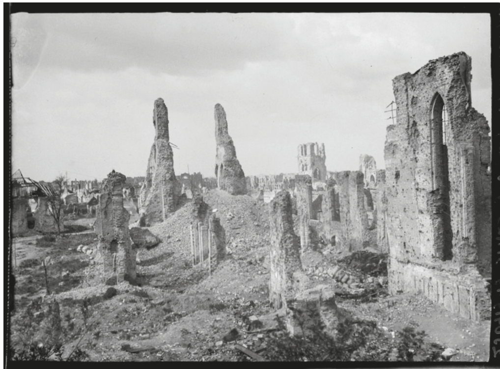
De ruïnes van de Lakenhallen en de Sint-Maartenskerk. Ieper, 5-6-1918