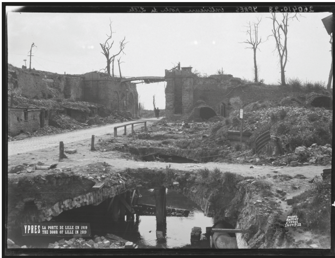
De ruïnes van de Lakenhallen en de Sint-Maartenskathedraal. Ieper, 5-6-1918

De kleine rivier de Ieperlee die sinds de eerste helft van de 19de eeuw was overwelfd, was door de aanhoudende beschietingen op veel plaatsen opnieuw zichtbaar geworden. Op niet minder dan 15 foto's zijn de opengebroken gewelven en het daaronder stromende water te zien.