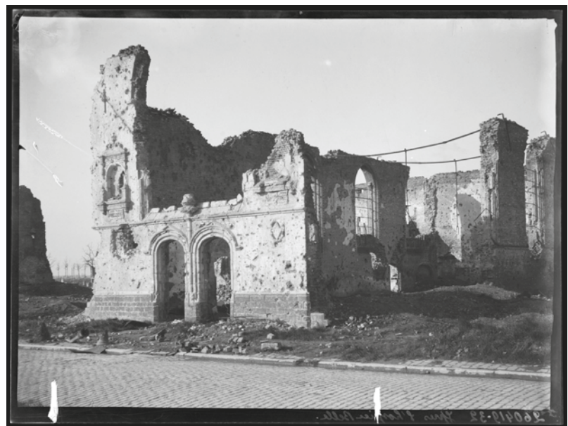
De ruïnes van de Lakenhallen en de Sint-Maartenskathedraal. Ieper, 5-6-1918

De kleine rivier de Ieperlee die sinds de eerste helft van de 19de eeuw was overwelfd, was door de aanhoudende beschietingen op veel plaatsen opnieuw zichtbaar geworden. Op niet minder dan 15 foto's zijn de opengebroken gewelven en het daaronder stromende water te zien.