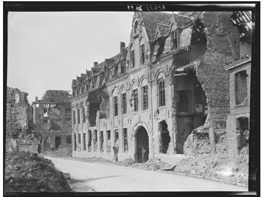
De ruïnes van de Lakenhallen en de Sint-Maartenskerk. Ieper, 5-6-1918

Maar de foto's tonen ook de exacte staat van de vernietiging. Op 4 april 1919 fotografeerden de Antony's reeds zo goed als alle gebouwen die nadien nog geres- taureerd konden worden, zoals het Huis Vandermersch, het Genthof, het Huis Biebuyck, het oude Tempelsteen (Postgebouw) of het Instituut H. Familie e.a. (zie hierna en verder in het boek).