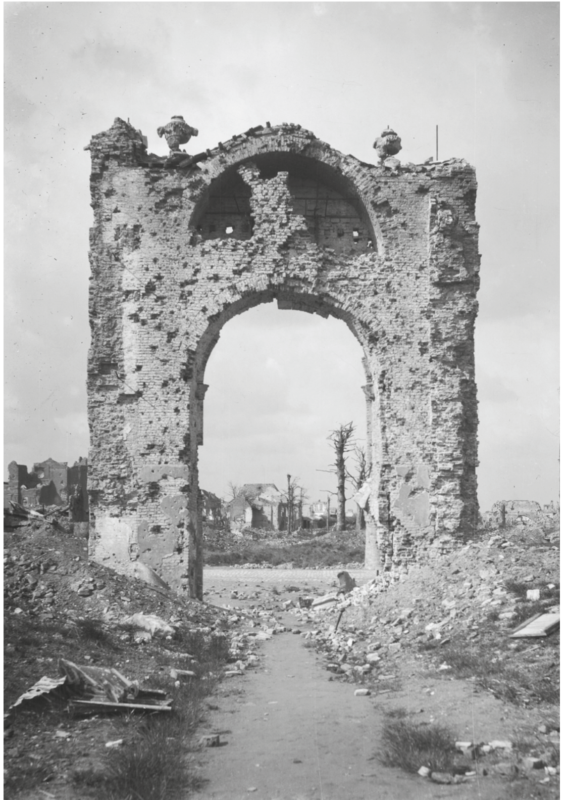
Langsheen de vrijstaande voorgevel van het Belle Godshuis kijkend naar het belfort. Ieper, 4-4-1919