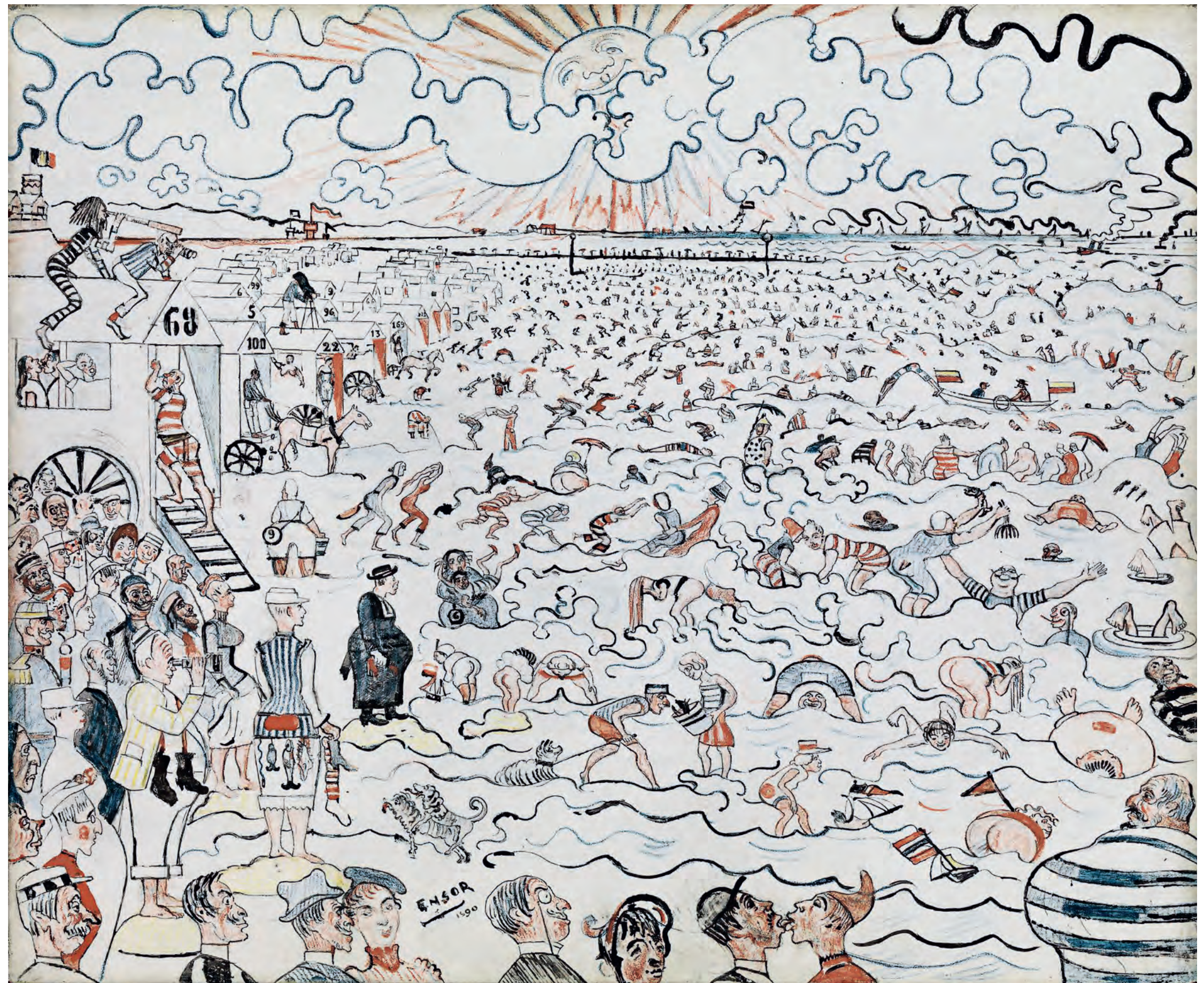
JAMES ENSOR, BADEN IN OOSTENDE, 1890