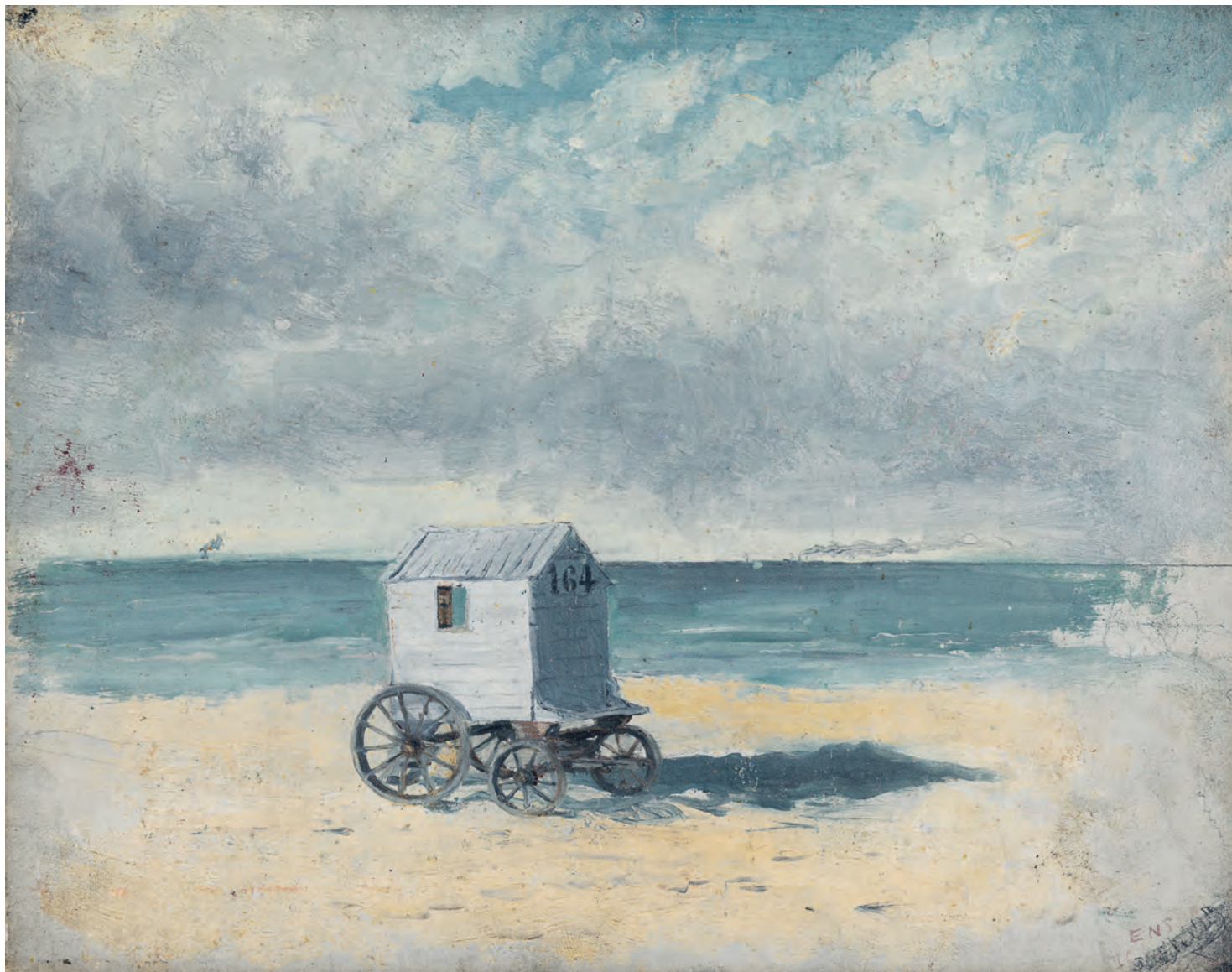
JAMES ENSOR, DE BADKOETS, 1876