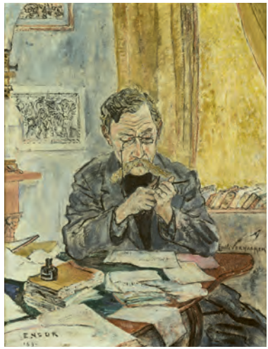
James Ensor, Portret van Emile Verhaeren , 1890. Koninklijke Bibliotheek, Brussel

in geestelijke verwaarlozing en de stilte. Ensor houdt daarvan ... Het leven in de haven is het enige leven in Oostende, in de winter. Het dringt de stad niet binnen; het bezielt alleen haar grenzen. ... / Ensor heeft deze uitgelatenheid vertaald in bijna sinistere werken die verbazen en beangstigen. De schilderachtigheid van de kleding, de versleten, afgedragen plunjes... de stomme koddigheid van het masker, de verveling die van de muren lijkt te sijpelen (...). 5