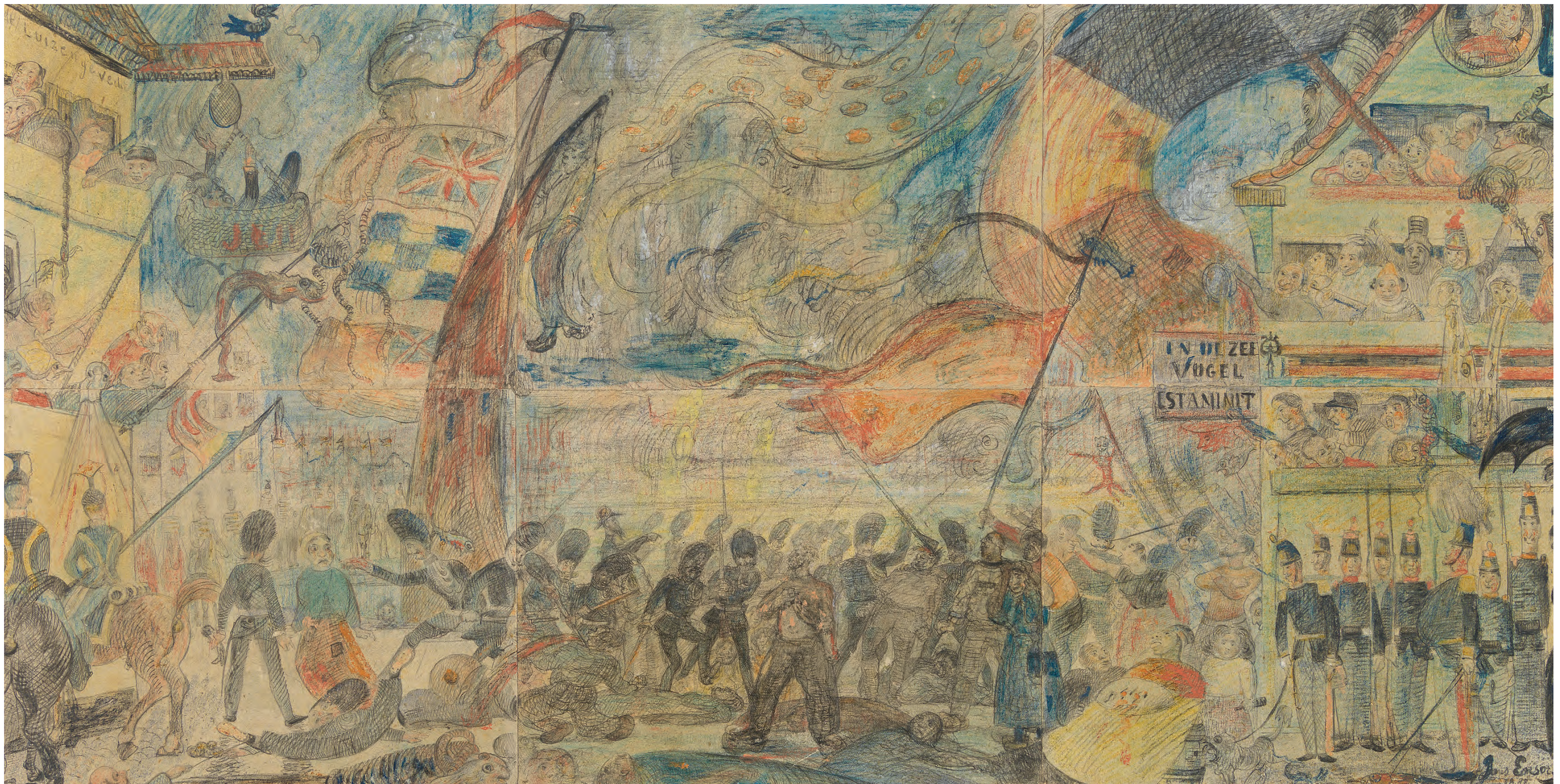
JAMES ENSOR, HET AFSLACHTEN VAN DE OOSTENDSE VISSERS (IN AUGUSTUS 1887) OF DE STAKING, 1888