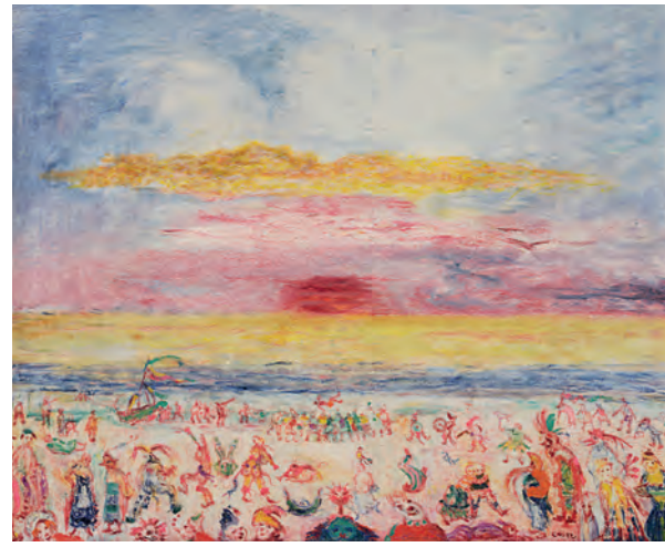
James Ensor, Carnaval in Oostende (op het strand) , 1933. Privécollectie

'In Oostende, een stad met een grillig klimaat, leeft Ensor in zijn echte fysieke klimaat, de natuurlijke omgeving waar hij voeding vindt voor zijn wortels en de bloemen van zijn fantasie. Zijn longen, zijn zenuwen, zijn hersenen zijn sinds zijn kindertijd doordrenkt van de Oostendse lucht, geïodeerd, marien, sprankelend van licht, gegeseld door de wind. De zeden van de stad, tussen het conventionele en het wilde, folkloristisch, kleinburgerlijk, groots of halfgaar, netjes gekleed, in een vissersblouse of in zwempak, die leerden de menselijke passies te beoordelen. De geest van de kunst wordt belichaamd door het vlees en het vlees van Ensors kunst is dat van zijn stad. Oostende maakt in meerdere opzichten aanspraak