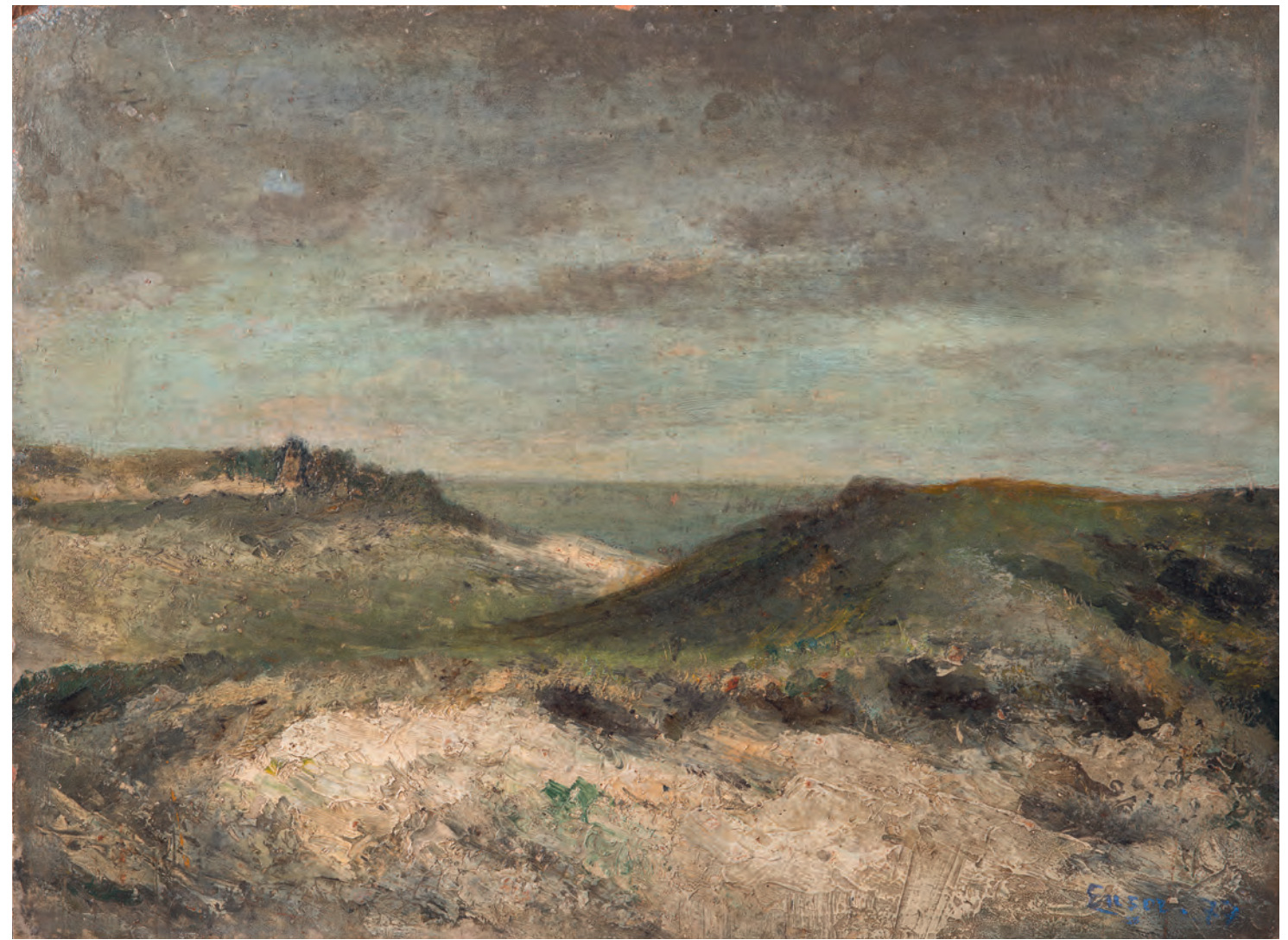
JAMES ENSOR, DUINEN, 1877