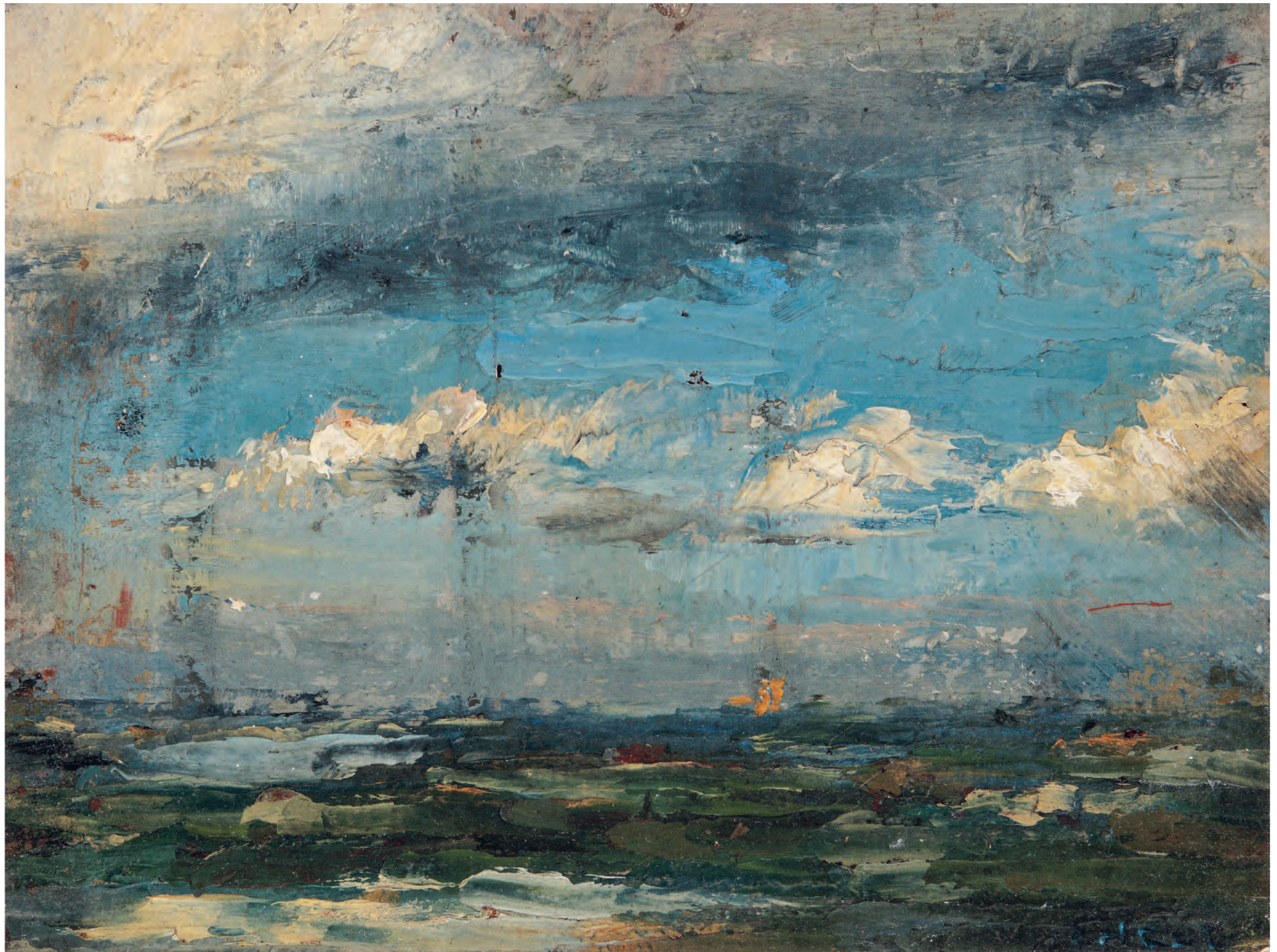
JAMES ENSOR, MARINE IN BLAUW, 1880