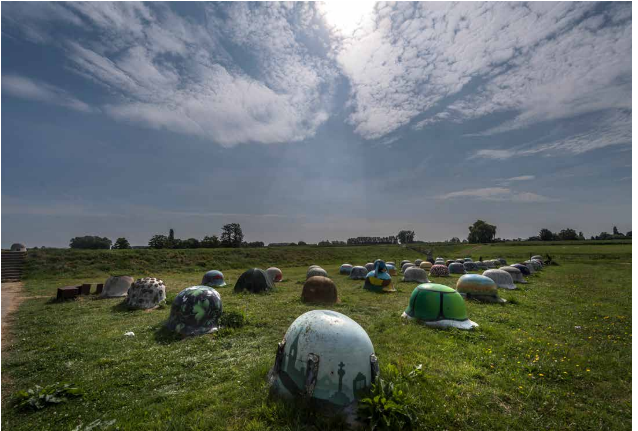
"Helmen" in Halen op het voormalige slagveld.