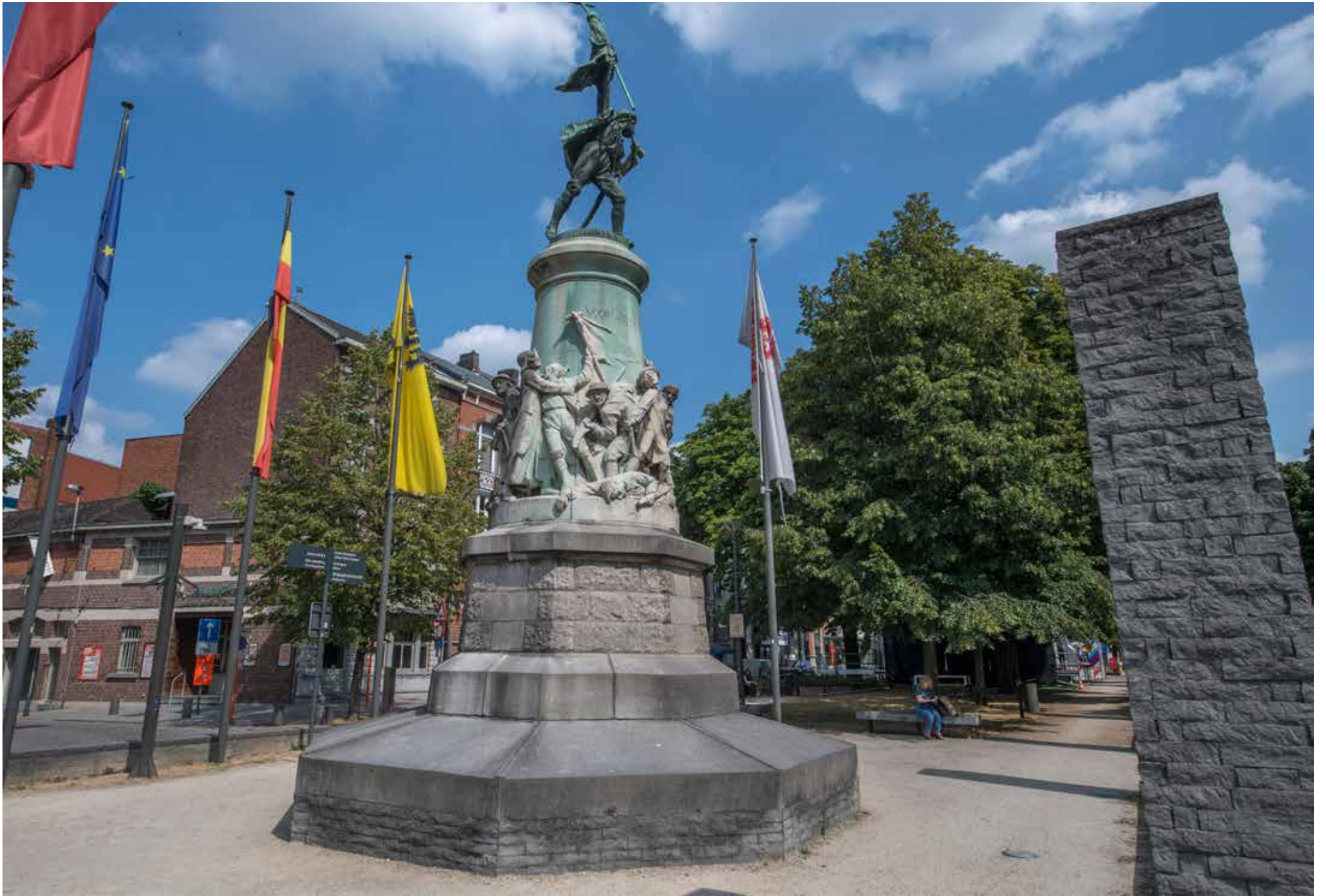
Monument voor de Boerenkrijg, Hasselt.