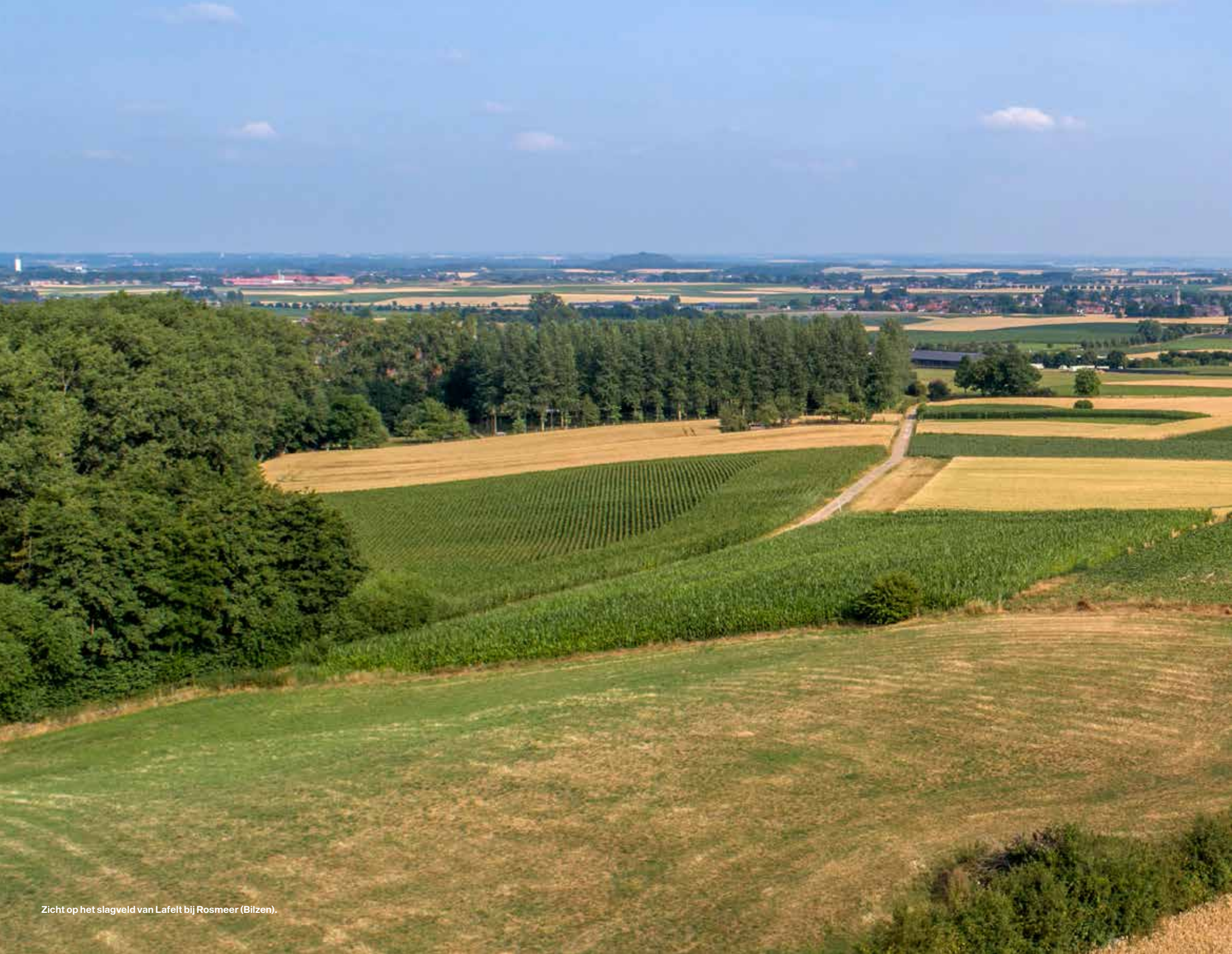
Zicht op het slagveld van Lafelt bij Rosmeer (Bilzen).