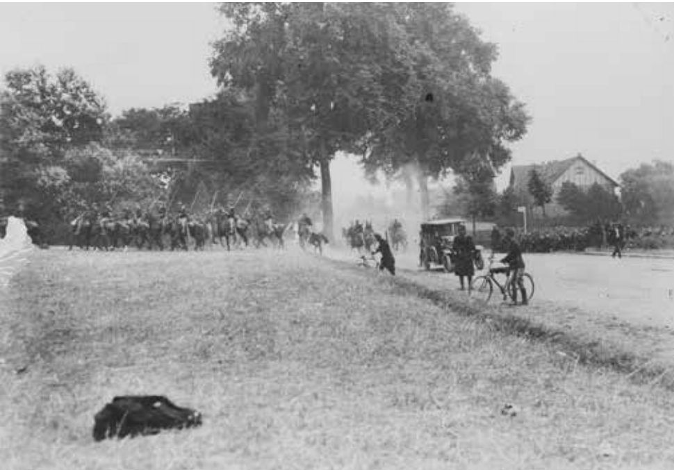
Belgische ruiters en karabiniers vertrekken naar hun stellingen voor de slag bij Halen.

Archief van het Koninklijk Museum van het Leger en de Krijgsgeschiedenis, onbekende fotograaf, 1914