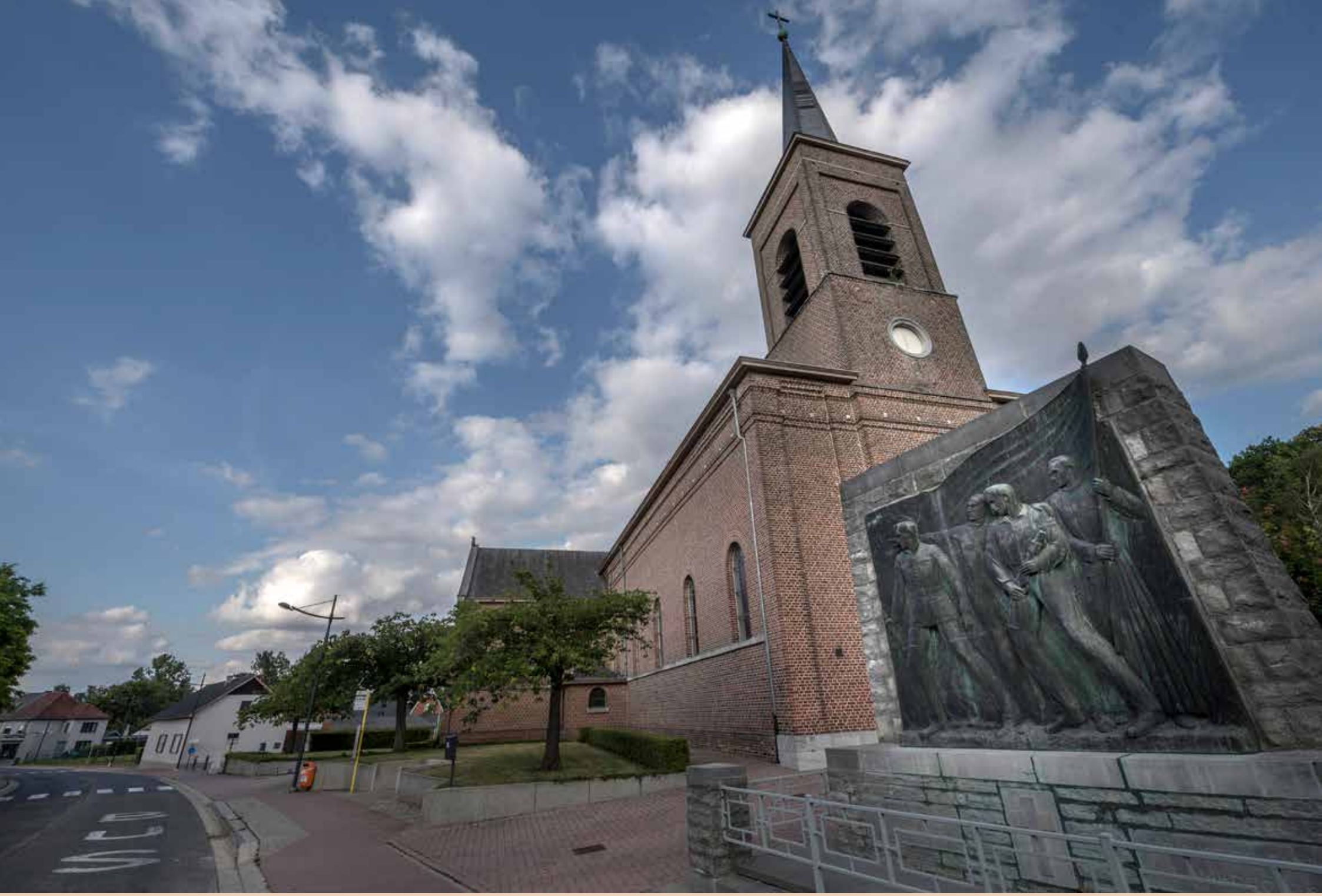
Provinciaal Monument voor de Weerstand, Wijer.