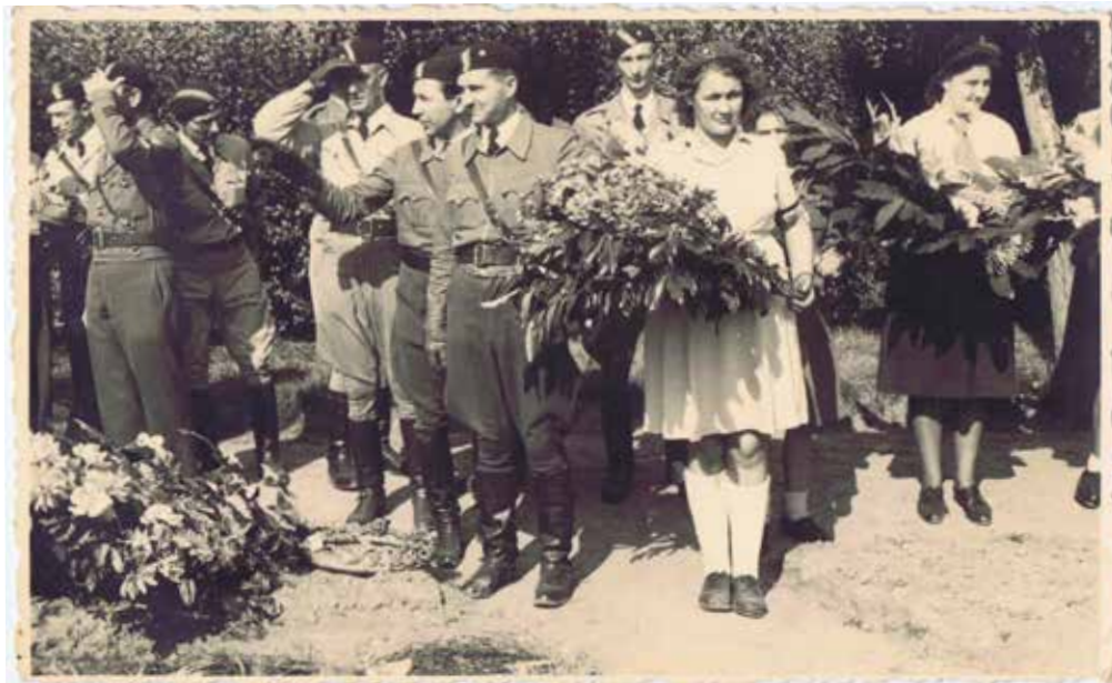
Foto van een herdenking van de slachtoffers op het Geheim Kerkhof in Hechtel.

Heemkundige Kring Hechtel-Eksel, onbekende fotograaf, 1952