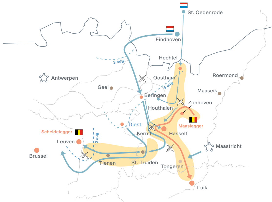
Het Nederlandse leger drong tussen het Maasleger en het Scheldeleger door tot in Leuven.

Ondertussen vangt de Nederlandse regering berichten op over een wijdverspreide Nederlandse sympathie in het Zuiden. Veel mensen zouden daar weer verlangen naar de vrede en welvaart die zij onder de Nederlandse regering kenden. Optimistische berichten van gezanten in de buurlanden bevestigen dat een militair ingrijpen door een groot deel van de bevolking in België met gejuich begroet zou worden. De Nederlandse overheid beschikt ook nog over twee stadsgarnizoenen in België. In de citadel van Antwerpen en in de stad Maastricht zijn nog altijd sterke Nederlandse legerafdelingen aanwezig. Het grootste deel van wat nu Nederlands Limburg is, behoort namelijk tot 1839 tot België.