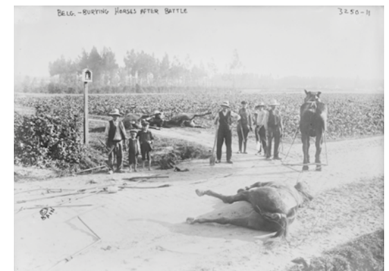
De boeren begroeven de gedode paarden na de slag.