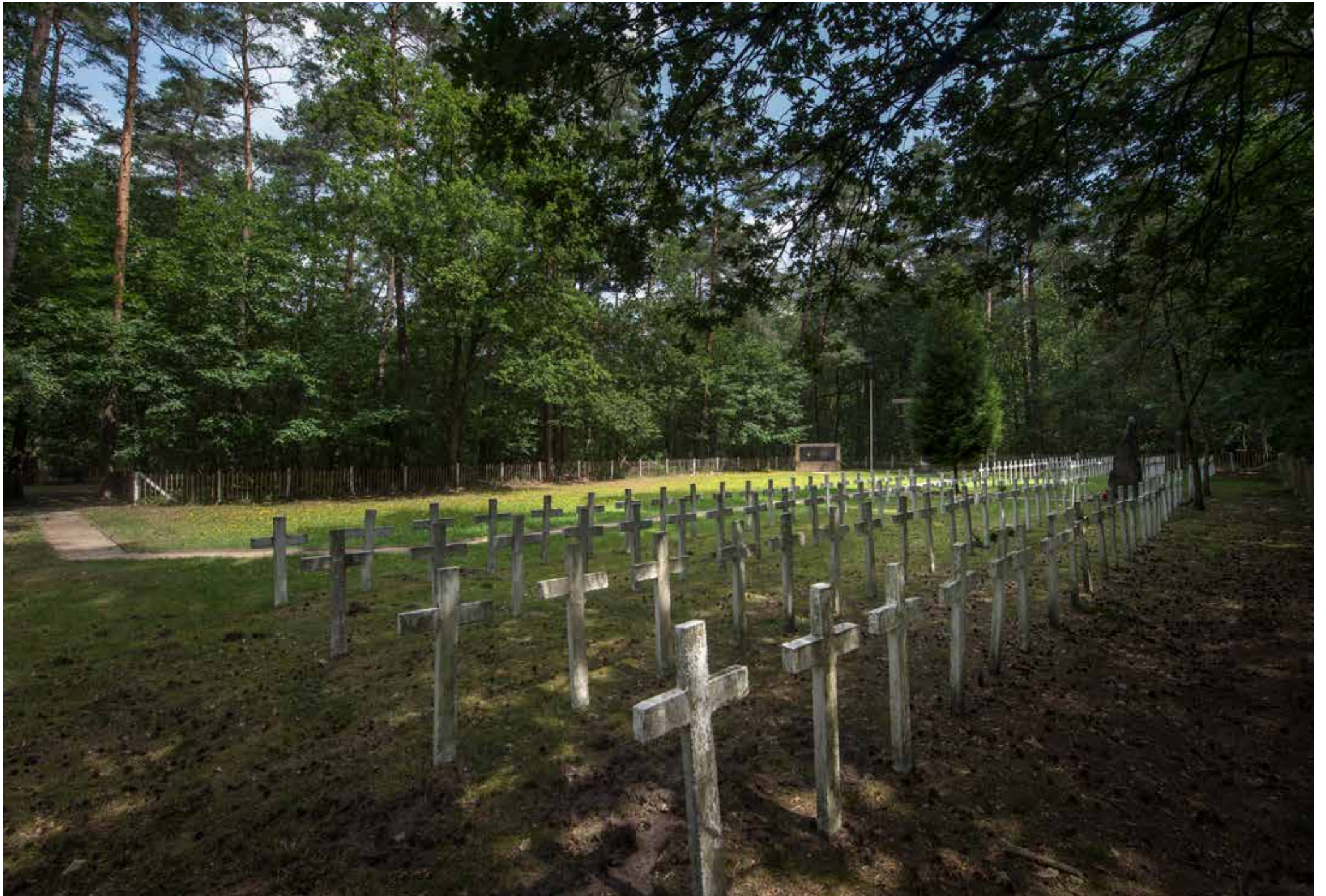
Het executieoord en het Geheim Kerkhof in Hechtel, Hechtel-Eksel.