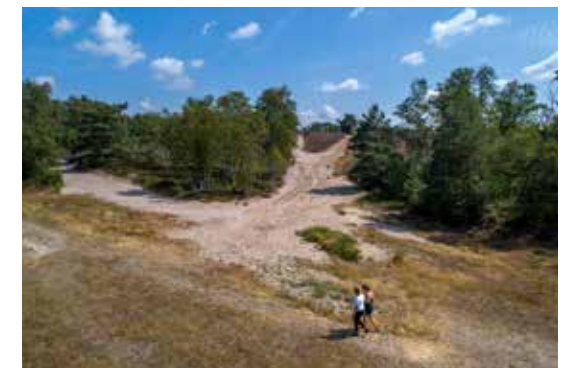
De Teut, Zonhoven.