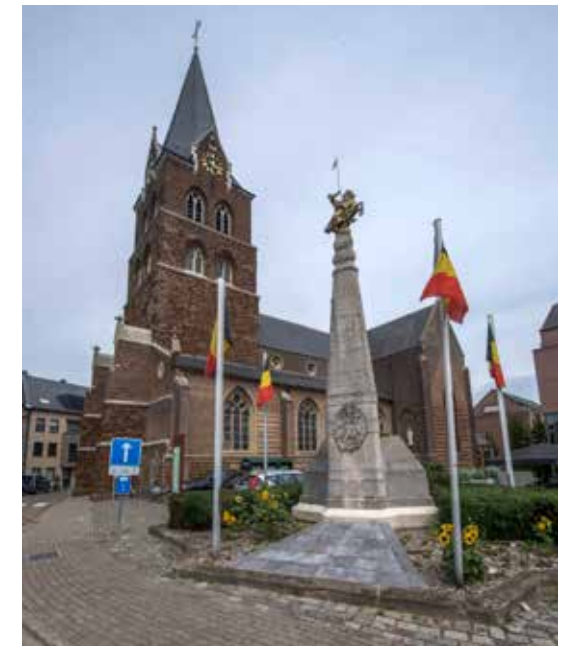
Het oorlogsmonument in het centrum van Halen.