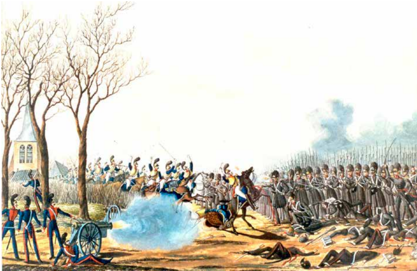
Deze aquarel toont hoe een regiment van het Maasleger de Nederlandse ruitery teruggrijft bij Kermt.

Het Stadsms Hasselt, A. von Geusau, 1835