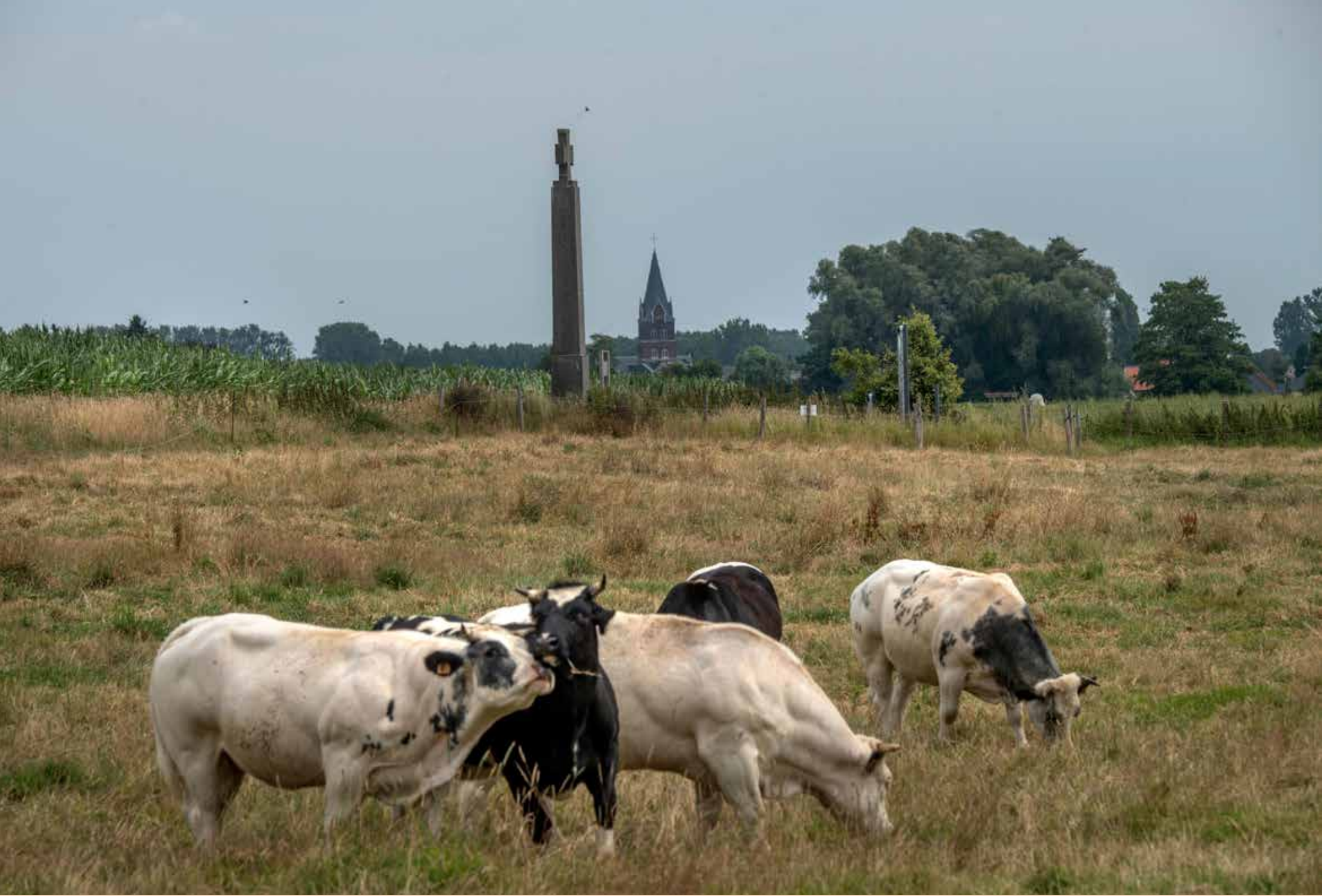
Kruis van het voormalige Duitse oorlogskerkhof, Halen.