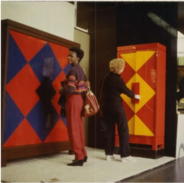
Links Kasten van Emiel Veranneman tentoongesteld op Interieur 80.